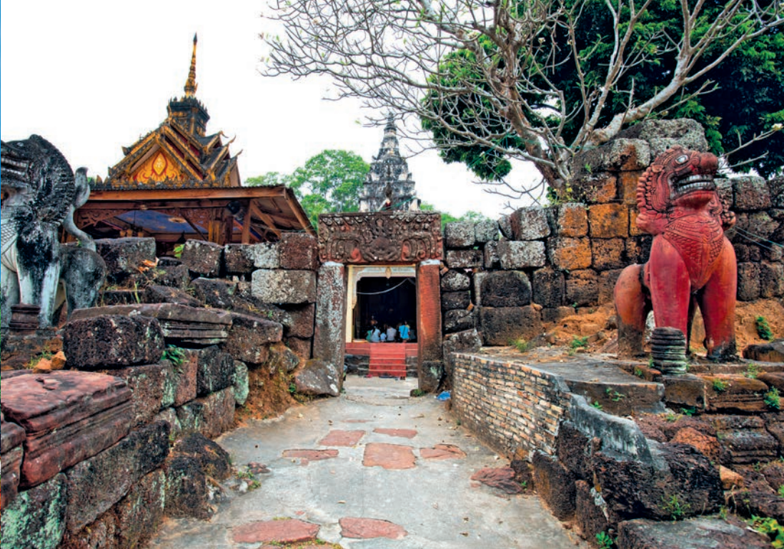
กุพระโกนา

จึงเป็นต้นแบบในการสร้างพระเจดีย์ นับเป็นเจดีย์หินทรายแห่งแรกของประเทศไทย สร้างลดลันเป็น ๗ ชั้นตระการตา ตกแต่งผนังด้านนอกเจดีย์ ดังนี้ ชั้นที่ ๑ เป็นภาพแกะสลักหินทรายเหลือองุ่นดำเล่าเรื่องพระเวสสันดรชาดกซึ่งเป็นพระชาติสุดท้ายที่ทรงบำเพ็ญทานบารมี