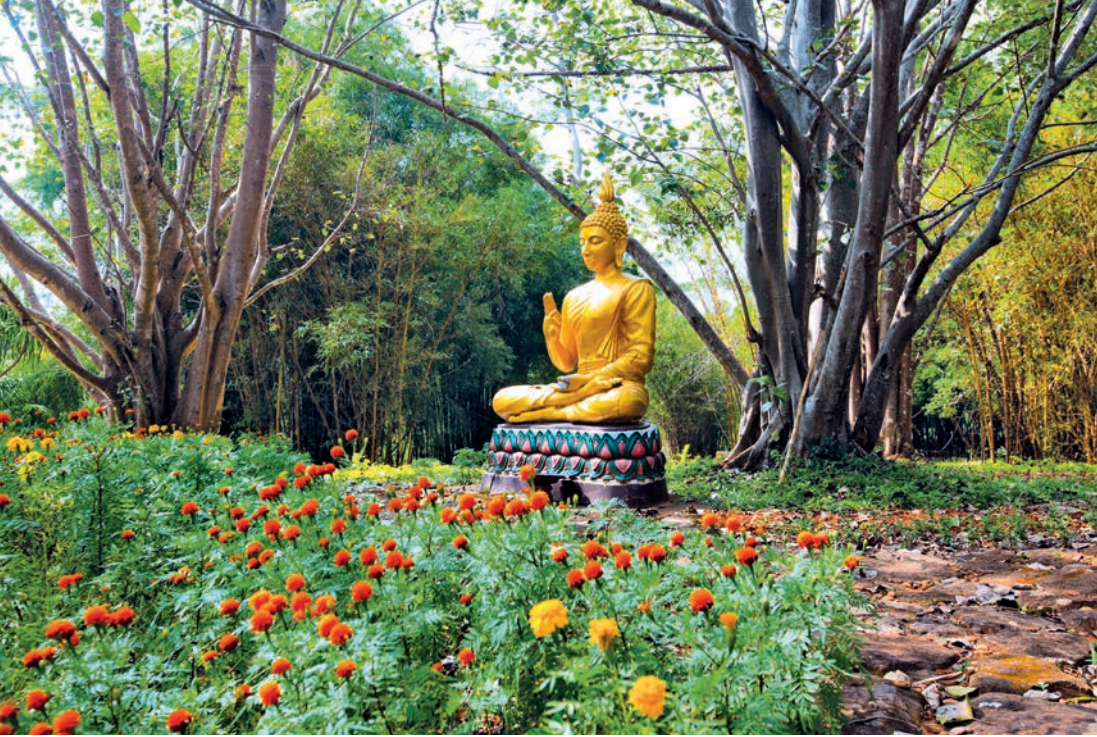
สวนพฤกษศาสตร์วรรณคดี

ติดต่อล่วงหน้าถึงหัวหน้าสวนพฤกษศาสตร์วรรณคดี ภาคตะวันออกเฉียงเหนือ เขตห้ามล่าสัตว์ป่าถ้ำผา น้ำทิพย์ ตู ปณ.๑ ตำบลปึงงาม อำเภอหนองพอก จังหวัดร้อยเอ็ด ๔๕๒๑๐