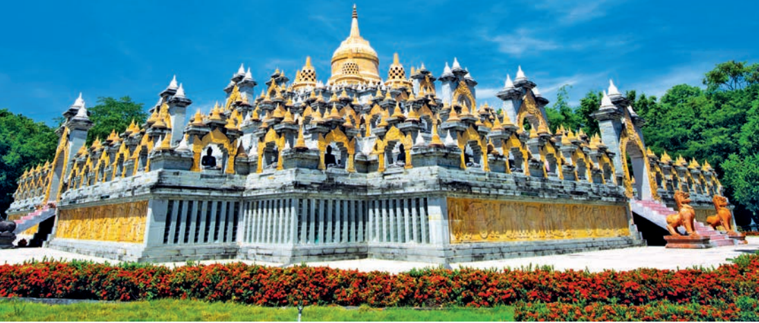
วัดประชาคมวนาราม หรือ วัดป่ากุง

ตาพรหมอันประกอบด้วยปราสาทประธาน บรรณาลัย กำแพง ซุ้มประตูและสระน้ำนอกกำแพง บางส่วนได้บูรณะให้คงสภาพเดิม กำแพงแก้วก่อในผังรูปสี่เหลี่ยมผืนผ้าล้อมรอบด้วยปราสาทประธานและบรรณาลัย บริเวณกึ่งกลางกำแพงแก้วด้านทิศตะวันออกเป็นซุ้มประตูทางเข้าออกที่เรียกว่าโคปุระ ถัดจากโคปุระมาทางทิศตะวันออกเฉียงเหนือ มีสระน้ำศิลาแลง ๑ สระ สร้างขึ้นในสมัยพระเจ้าชัยวรมันที่ ๗ ศิลปะเขมรแบบบายน ราวพุทธศตวรรษที่ ๑๘