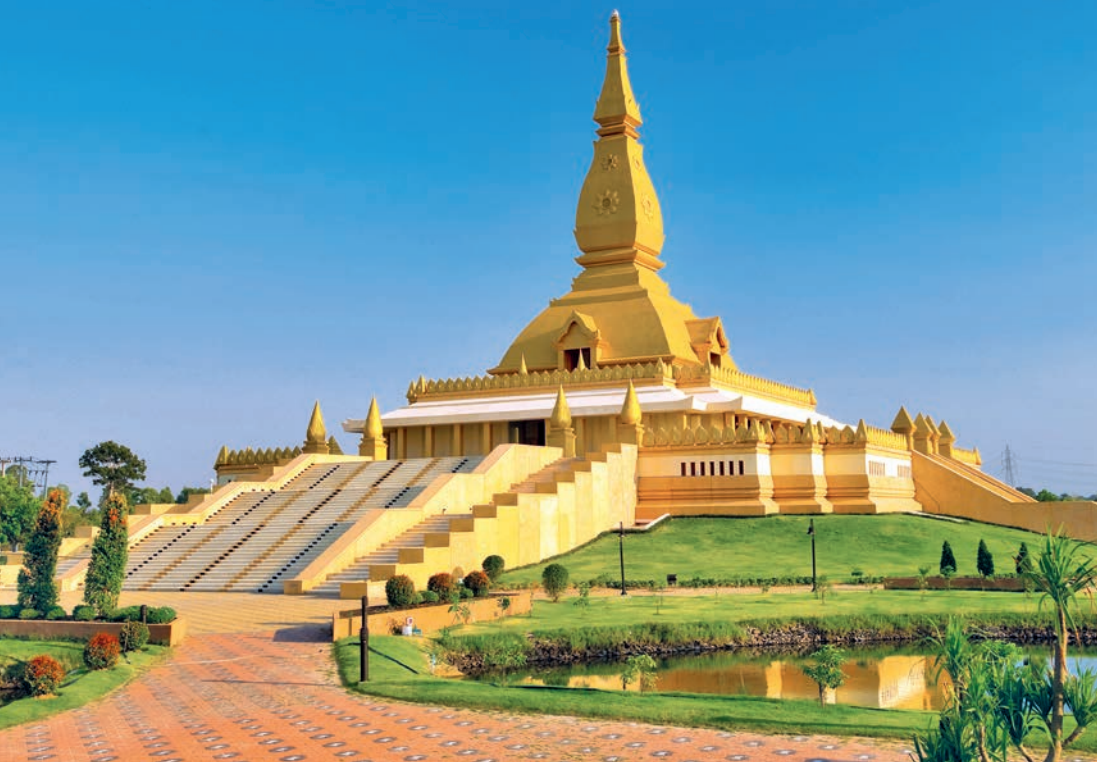
พระเจดีย์มหาเมฆมล บัว

ด้านหลังองค์พระบรรจุพระบรมสารีริกธาตุที่อัญเชิญมาจากประเทศอินเดีย ได้ฐานองค์พระจัดเป็นพิพิธภัณฑ์ หลวงพ่อใหญ่เป็นที่เคารพนับถือของชาวเมืองร้อยเอ็ดเป็นอย่างมาก นอกจากนี้ภายในบริเวณวัดยังจัดเป็นอุทยานพุทธประวัติ ที่ตั้งศูนย์งานพระธรรมทูต โรงเรียนปริยัติธรรม และมีศาลเจ้าพ่อมเหศักดิ์ซึ่งเป็นที่เคารพของชาวเมืองอยู่ด้วย