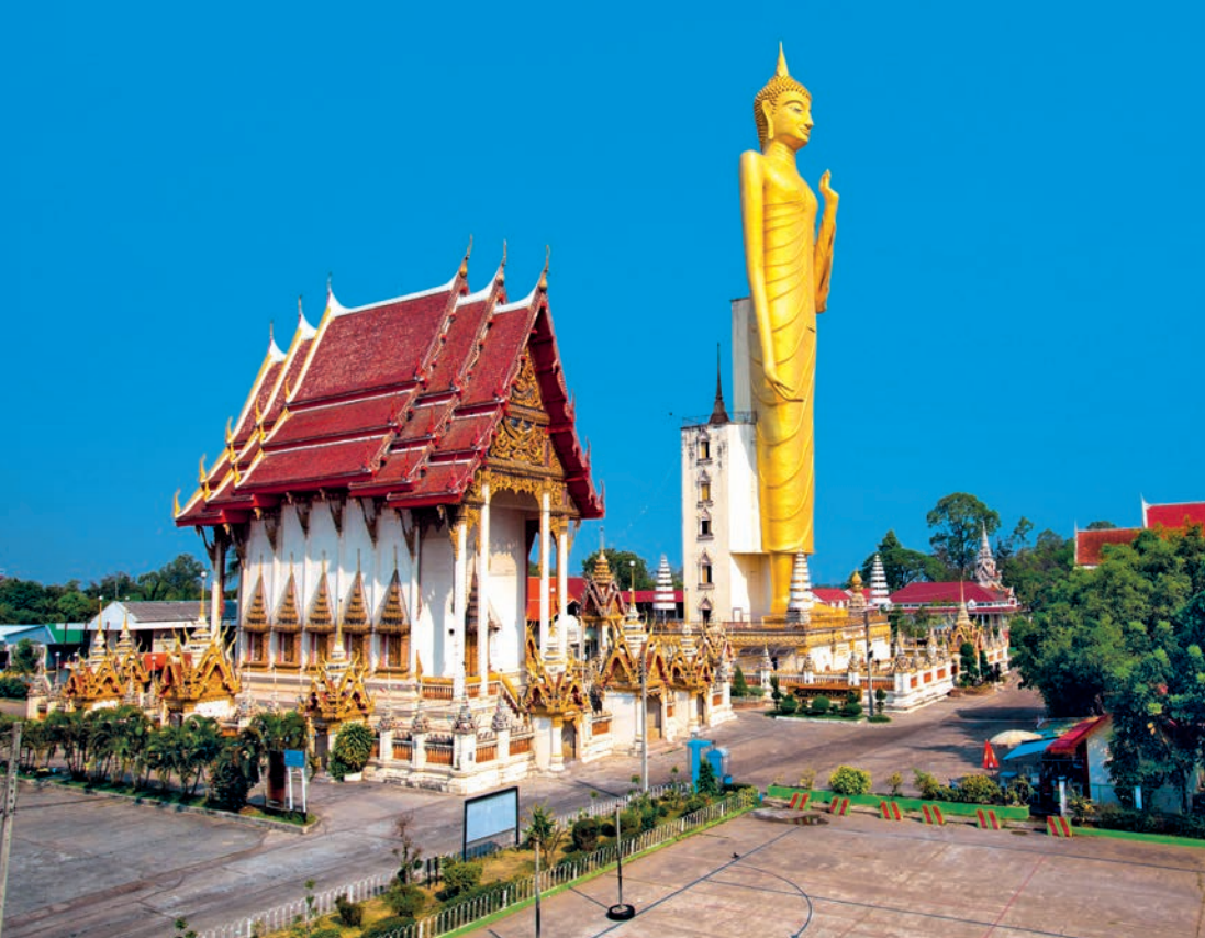
วัดบูรพาภิราม

เคยใช้เป็นสถานที่ประกอบพิธีถือน้ำพิพัฒน์สัตยา ภาพจิตรกรรมฝาผนังรอบพระอุโบสถเกี่ยวกับพุทธประวัติมีศิลปะสวยงามมาก ภายในบริเวณมีโรงเรียนสุนทรธรรมปริยัติเป็นสถานที่ศึกษาปริยัติธรรมและสอบธรรม สอบถามข้อมูล โทร. ๐ ๔๓๕๑ ๒๔๐๐