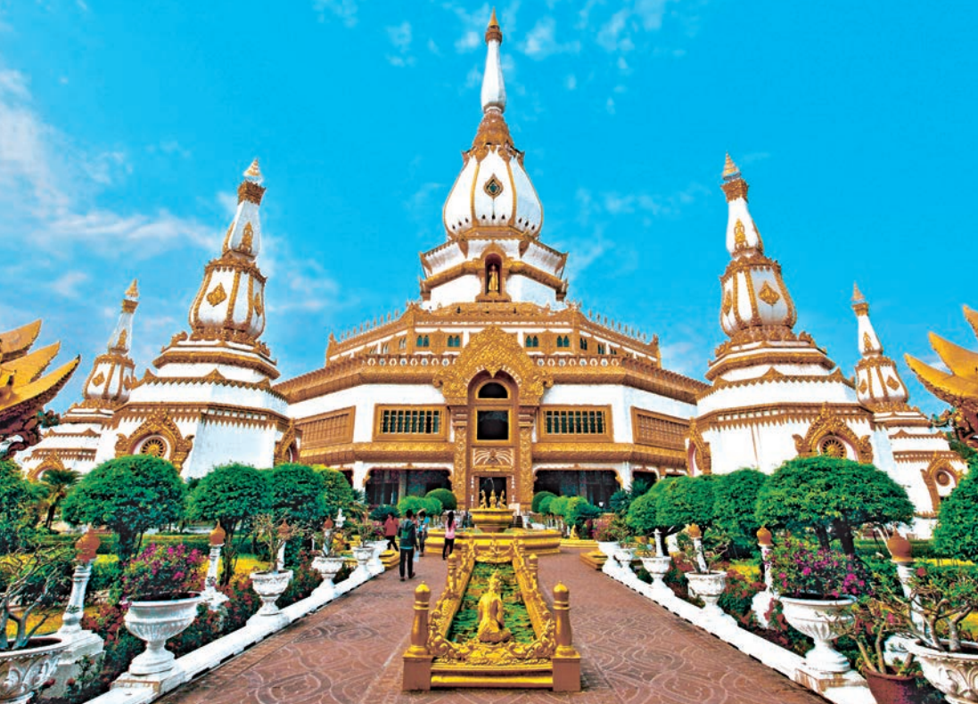
พระมหาเจดีย์ชัยมงคล

การเดินทาง จากอำเภอเมืองไปตามทางหลวงหมายเลข ๒๑๔ เข้าทางหลวงหมายเลข ๒๑๕ ถึงอำเภอสุวรรณภูมิ เลี้ยวซ้ายเข้าซอยข้างอำเภอตรงไปประมาณ ๕ กิโลเมตร รวมระยะทางจากตัวเมืองประมาณ ๕๕ กิโลเมตร