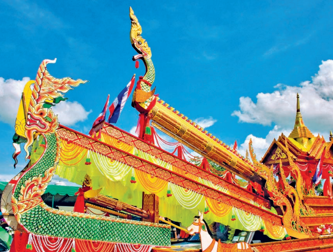
ประเพณีบุญบั้งไฟ

ประเพณีแห่เทียนพรรษา จัดขึ้นในวันอาสาฬหบูชา ของทุกปี ณ บริเวณสวนสมเด็จพระศรีนครินทร์ โดย ขบวนแห่ต้นเทียนแต่ละวัด (คุ้ม) จะตกแต่งอย่าง สวยงามด้วยดอกไม้สีสวยสด และสวยงามจะเคลื่อน ขบวนจากคุ้มต่าง ๆ ผ่านตลาดไปยังบริเวณหน้า ศาลาจตุรมุขในสวนสมเด็จพระศรีนครินทร์ เพื่อร่วม ประกวดต้นเทียนและขบวนแห่ต้นเทียน โดยมีการ รำเชิงแบบอีสานประกอบ