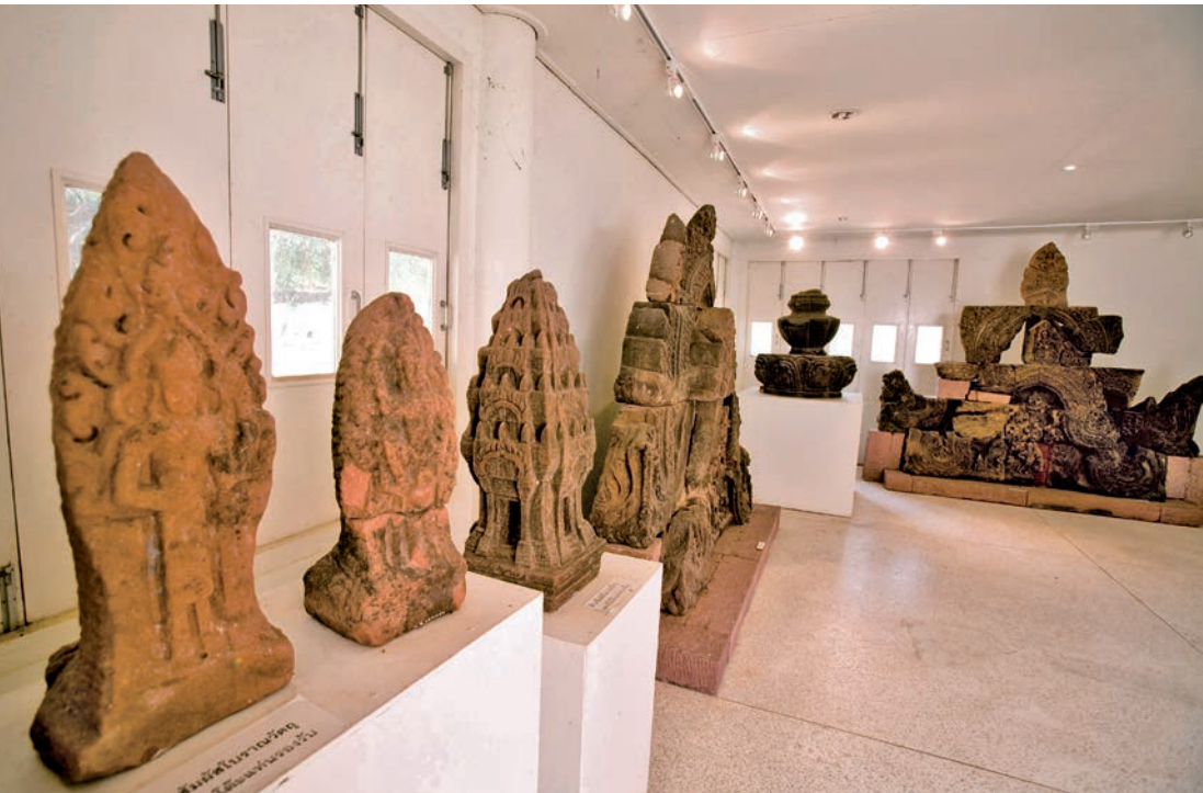
พิพิธภัณฑสถานแห่งชาติร้อยเอ็ด

จัดแสดงผ้าไหมพื้นเมืองและงานศิลปหัตถกรรมของจังหวัดร้อยเอ็ด ต่อมากรมศิลปากรมีนโยบายจัดตั้งพิพิธภัณฑสถานแห่งชาติประจำเมือง เพื่อแสดงเรื่องราวด้านต่าง ๆ ของจังหวัด สถานที่แห่งนี้จึงได้รับการปรับปรุงให้เป็นพิพิธภัณฑสถานแห่งชาติแห่งแรก เนื้อหาที่จัดแสดงครอบคลุมเรื่องราวต่าง ๆ ของจังหวัดร้อยเอ็ด ทั้งสภาพภูมิศาสตร์ ทรัพยากรธรณี ประวัติศาสตร์ โบราณคดี วิถีชีวิตความเป็นอยู่ และงานหัตถกรรมการทอผ้าไหมที่โดดเด่นของจังหวัด เปิดทุกวันวันวันจันทร์-อังคาร และวันหยุดนักขัตฤกษ์ เวลา ๐๙.๐๐-๑๖.๐๐ น. อัตราค่าเข้าชมสำหรับชาวไทย ๑๐ บาท ชาวต่างชาติ ๓๐ บาท สอบถามข้อมูล โทร. ๐ ๔๓๕๑ ๔๔๕๖