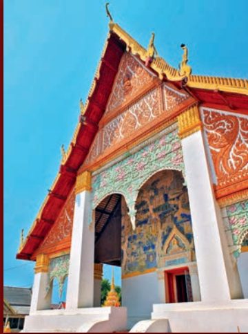
วัดกลางมิ่งเมือง