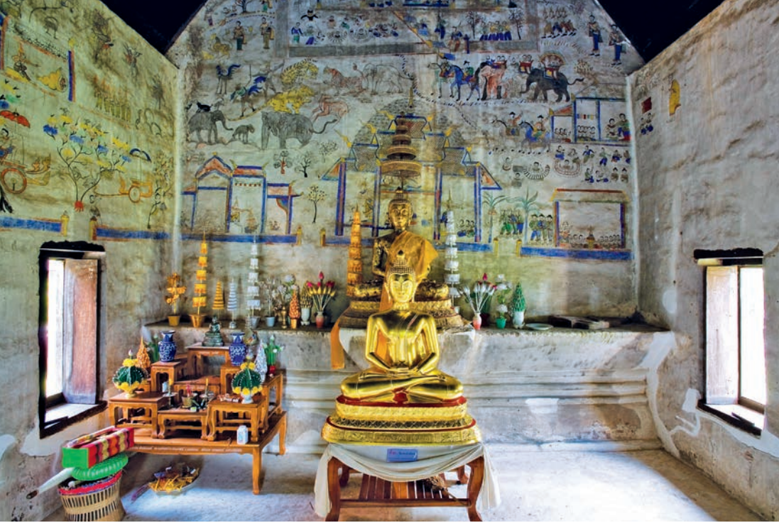
ลิมวัดจักรวาลภูมิพิณี หรือ วัดหนองหมื่นถ่าน

การเดินทาง จากอำเภอเมืองใช้ทางหลวงหมายเลข ๒๐๔๓ ถึงอำเภออาจสามารถเดินทางต่อไปอีก ๑๐ กิโลเมตร แล้วเลี้ยวเข้าทางบ้านหนองหมื่นถ่าน ๒ กิโลเมตร