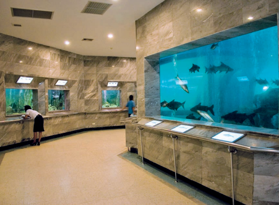
สถานแสดงพันธุ์สัตว์น้ำเทศบาลเมืองร้อยเอ็ด

ภายในบึงพลาญชัยยังมีสิ่งก่อสร้างที่น่าสนใจคือ ศาลเจ้าพ่อหลักเมือง คูบ้านคูเมืองที่ชาวร้อยเอ็ดเคารพนับถือ และเชื่อว่าเจ้าพ่อหลักเมืองจะช่วยลดบันดาลให้ชาวเมืองมีความสุข คิดสิ่งใดสมปรารถนา จึงเป็นสถานที่อีกแห่งหนึ่งที่ชาวเมืองร้อยเอ็ดมากราบนมัสการขอพรเป็นประจำ พระพุทธรูปปางลีลาขนาดใหญ่กลางสวนดอกไม้ พานรัฐธรรมนูญ นาฬิกาดอกไม้ ภูพลาญชัยมีลักษณะเป็นน้ำตกจำลอง และรูปปั้นสัตว์ต่าง ๆ คล้ายสวนสัตว์ สนามเด็กเล่น และสวนสุขภาพ บริการรถรางรอบบึงเที่ยวละ ๑๐ บาท