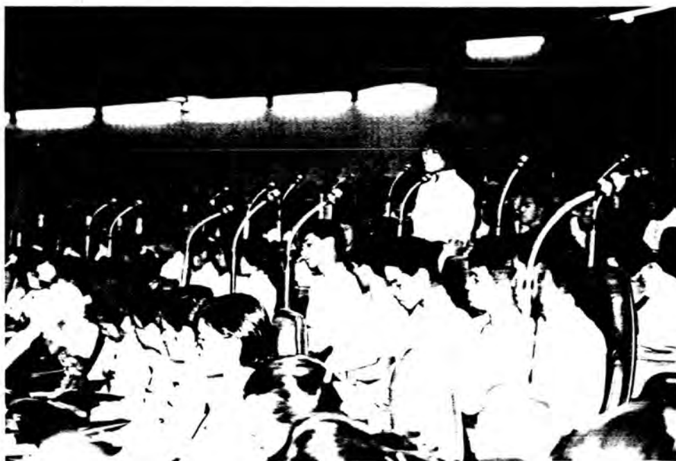
เด็กและเยาวชนกล่าวแสดงความคิดเห็นในที่ประชุม