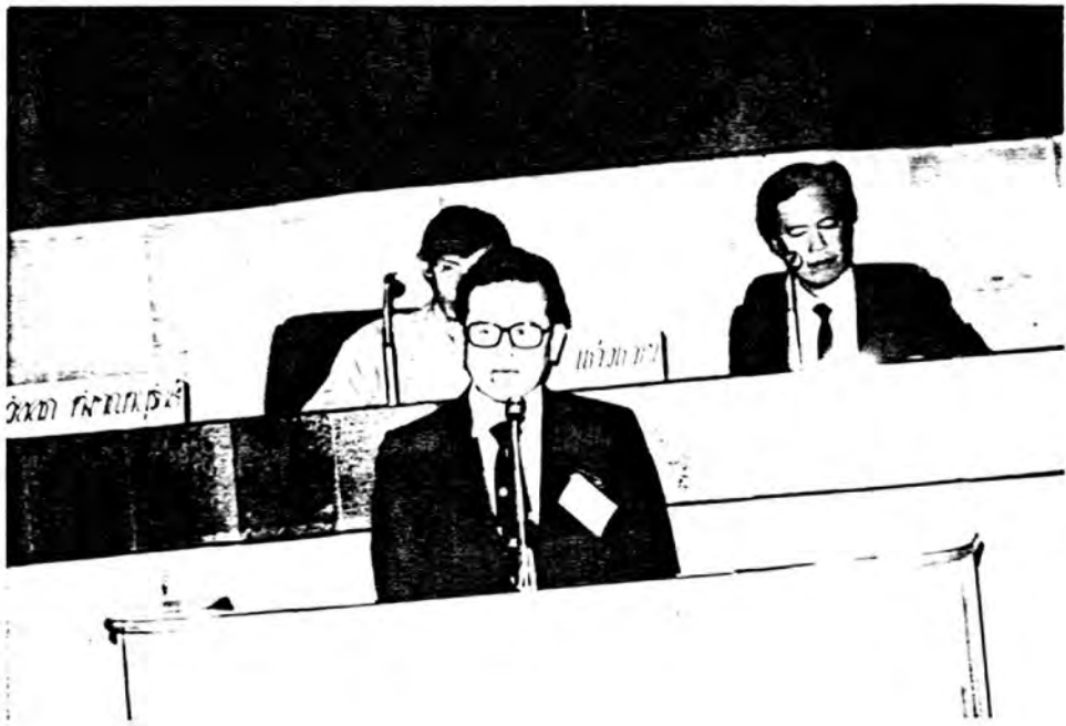
ศาสตราจารย์ นพ.ประเวศ วะสี กล่าวแสดงความคิดเห็น