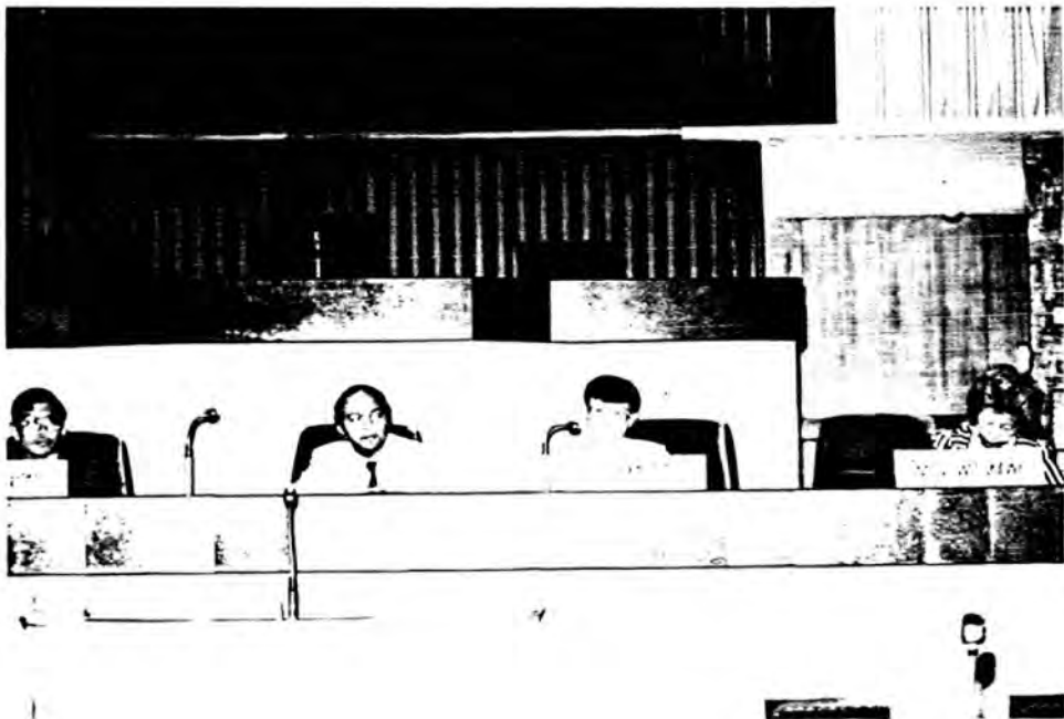
คณะผู้อภิปรายสรุป