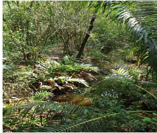
ภาพที่ 3 พื้นที่บริเวณสวนศรีนครเขื่อนขันธ์

การลงพื้นที่สำรวจข้อมูลช่วงวันที่ 29-30 มีนาคม 2562 พบว่าพื้นที่ตำบลบางกะเจ้า มีพื้นที่สวนป่าที่มีสภาพความอุดมสมบูรณ์ มีพื้นที่เกษตรกรรม สร้างความร่มรื่นและเป็นแหล่งสร้างอากาศบริสุทธิ์ และมีจำนวนนักท่องเที่ยวหนาแน่นเป็นจำนวนมากตามแหล่งท่องเที่ยวที่สำคัญ เช่น ตลาดน้ำบางน้ำผึ้ง สวนศรีนครเขื่อนขันธ์ เป็นต้น