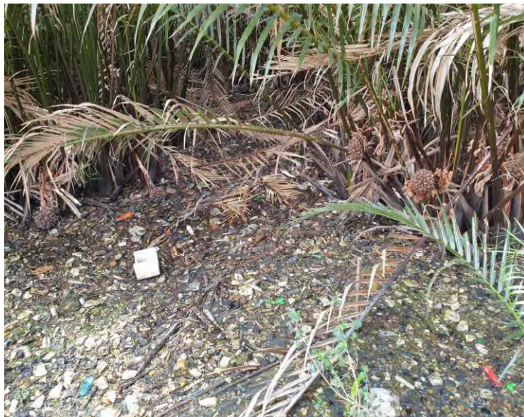
ภาพที่ 4 ขยะลอยน้ำในบริเวณป่าริมแม่น้ำ

การลงพื้นที่สำรวจข้อมูลช่วงวันที่ 29-30 มีนาคม 2562 พบว่าพื้นที่ตำบลบางกะเจ้า มีพื้นที่สวนป่าที่มีสภาพความอุดมสมบูรณ์ มีพื้นที่เกษตรกรรม สร้างความร่มรื่นและเป็นแหล่งสร้างอากาศบริสุทธิ์ และมีจำนวนนักท่องเที่ยวหนาแน่นเป็นจำนวนมากตามแหล่งท่องเที่ยวที่สำคัญ เช่น ตลาดน้ำบางน้ำผึ้ง สวนศรีนครเขื่อนขันธ์ เป็นต้น