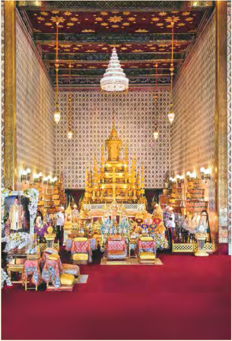
พระโกศทองใหญ่ทรงพระบรมศพ พระบาทสมเด็จพระปรมินทรมหาภูมิพลอดุลยเดช ประดิษฐานบนพระเบญจกษัตริย์ ภายในพระที่นั่งดุสิตมหาปราสาท