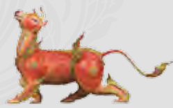
ไกรสรคาวี