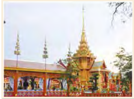
ราชวัติในงานพระเมรุสมเด็จพระเจ้าภคินีเธอเจ้าฟ้าเพชรรัตนราชสุดา สิริโสภาพัณณวดี

เป็นแนวรั้วกำหนดขอบเขตปริมณฑลของพระเมรุมาศและพระเมรุทั้ง ๔ ด้าน สร้างต่อเนื่องไปกับทิมและทับเกษตร ตกแต่งด้วยฉัตรและธง บางที่เรียกรวมกันว่า ราชวัติฉัตรธง