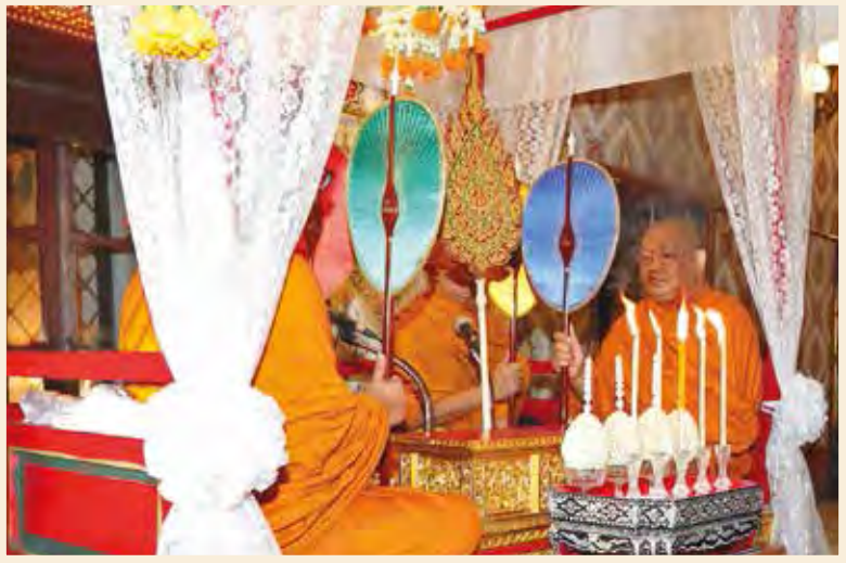
พระพิธีธรรมสวดพระอภิธรรมในการพระราชพิธีบำเพ็ญพระราชกุศล พระบรมศพ พระบาทสมเด็จพระปรมินทรมหาภูมิพลอดุลยเดช