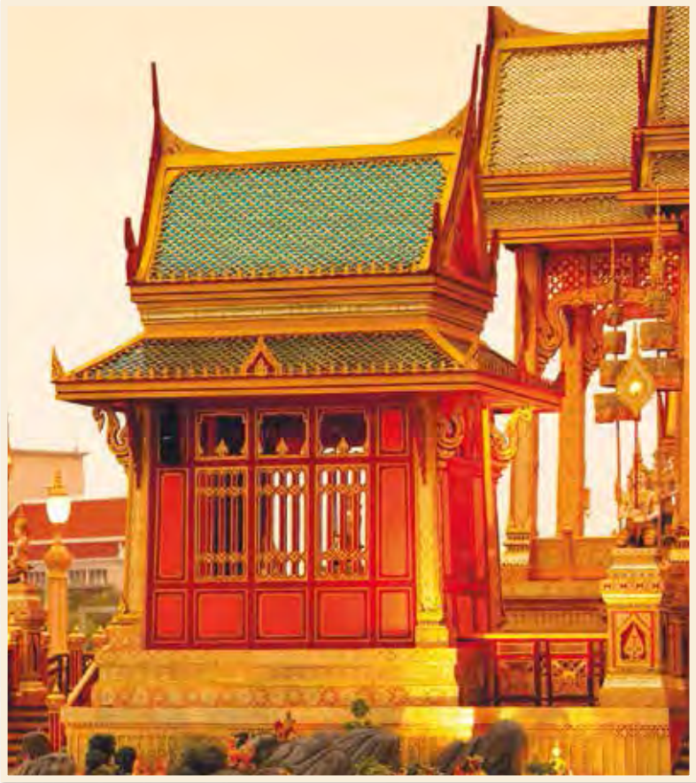
ช่างในงานพระเมรุ สมเด็จพระเจ้าภคินีเธอ เจ้าฟ้าเพชรรัตนราชสุดา สิริโสภาพัณณวดี