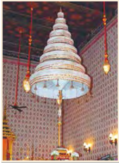
นพปฎลมหาเศวตฉัตร ภายในพระที่นั่งดุสิตมหาปราสาท

ฉัตรสำหรับตั้งในพิธี หรือเชิญเชิญเข้ากระบวนแห่เป็นเกียรติยศ แบ่งเป็น ๖ ชนิด คือ พระมหาเศวตฉัตรกรรณิรมย์ (พระเสนธิปัตย์ พระฉัตรชัย พระเกาวพ่าห์) พระอภิรมชুমสาย (พระอภิรมชুমสายปักหักทองขวาง พระอภิรมชুমสายทองแผ่ลวด) ฉัตรเครื่องสูงวงหน้า ฉัตรเครื่องสูง ฉัตรเบญจา ฉัตรราชวัติ