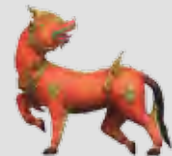
ดุงรงค์ไกรสร