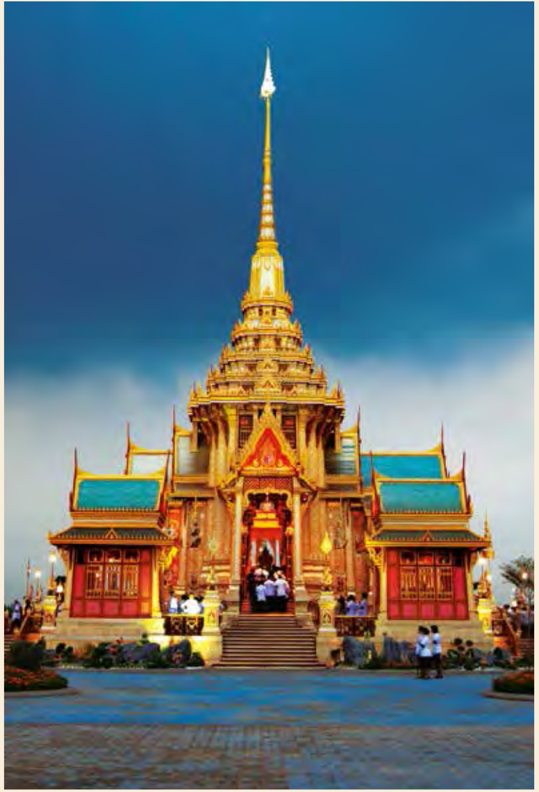
พระเมรุในการพระราชพิธีพระราชทานเพลิงพระศพ สมเด็จพระเจ้าภคินีเธอ เจ้าฟ้าเพชรรัตนราชสุดา สิริโสภาพัณณวดี