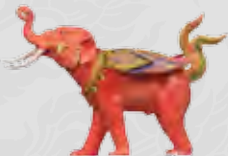
กรินทร์ปักษา