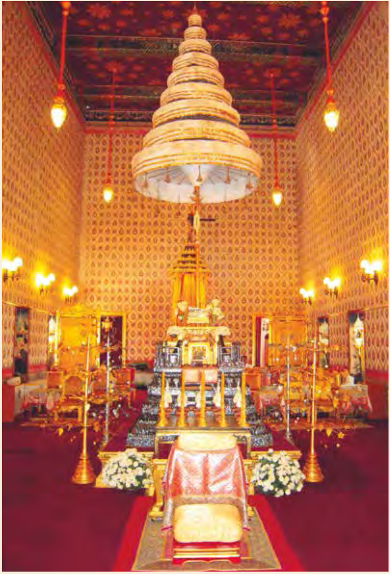
นพปฎลมหาเศวตฉัตร ประดิษฐานเหนือพระแท่นราชบัลลังก์ประดับมุก ภายในพระที่นั่งดุสิตมหาปราสาท