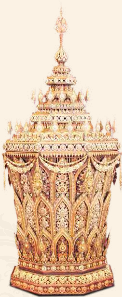
พระโกศจันทน์ในงานพระเมรุ สมเด็จพระเจ้าภคินีเธอ เจ้าฟ้าเพชรรัตนราชสุดา สิริโสภาพัณณวดี