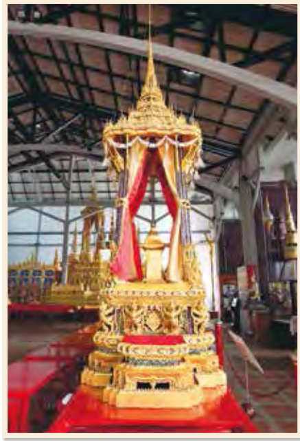
พระที่นั่งราชนทรยาน เก็บรักษาอยู่ในโรงราชรถ พิพิธภัณฑสถานแห่งชาติ พระนคร