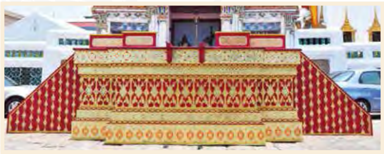
เกยลาในงานพระศพ สมเด็จพระเจ้าภคินีเธอเจ้าฟ้าเพชรรัตนราชสุดา สิริโสภาพัณณวดี

เป็นแท่นฐานยกพื้นสี่เหลี่ยมย่อมุม มีรางเลื่อนสำหรับเชิญพระบรมโกศ หรือพระโกศขึ้นประดิษฐานบนพระยานมาศ ตั้งอยู่ด้านหน้าประตูกำแพงแก้ว ด้านทิศตะวันตกของพระที่นั่งดุสิตมหาปราสาท ในพระบรมมหาราชวัง มีบันไดขึ้นลง ๓ ด้าน คือ ด้านตะวันออกเป็นที่อัญเชิญพระบรมโกศ หรือพระโกศจากพระที่นั่งดุสิตมหาปราสาทขึ้นเกย ด้านเหนือและด้านใต้สำหรับเจ้าพนักงานส่วนด้านตะวันตกเป็นที่เทียบพระยานมาศสามลำคาน เพื่ออัญเชิญพระบรมโกศ หรือพระโกศขึ้นประดิษฐาน