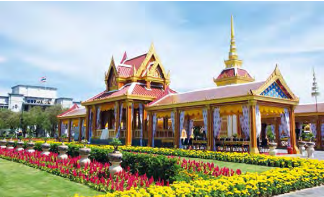
ปลับพลายกท้องสนามหลวงในงานพระเมรุ สมเด็จพระเจ้าภคินีเธอ เจ้าฟ้าเพชรรัตนราชสุดา สิริโสภาพัณณวดี

เป็นโถงใช้สำหรับพระมหากษัตริย์ และพระบรมวงศานุวงศ์ ทรงรอ รับส่งพระบรมศพ พระศพ ขึ้นราชรถ ในอดีตมีการสร้างปลับพลายก หน้าวัด พระเชตุพนวิมลมังคลาราม ตั้งอยู่มุมกำแพงวัด เยื้องกรมการรักษาดินแดน ปลับพลายกหน้าพระที่นั่งสุทไธสวรรยปราสาท และปลับพลายกท้องสนามหลวง ด้านหน้าทางเข้าปริมณฑลท้องสนามหลวง