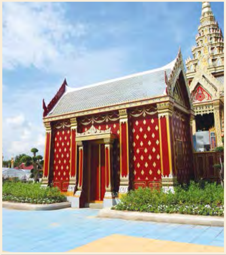
หอเปลื้องในงานพระเมรุ สมเด็จพระเจ้าพี่นางเธอ เจ้าฟ้ากัลยาณิวัฒนา กรมหลวงนราธิวาสราชนครินทร์