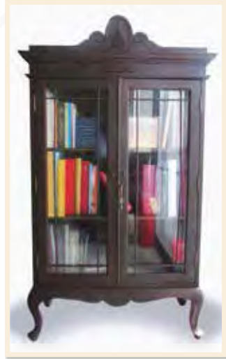
ตู้สังเค็ดในงานพระเมรุสมเด็จพระเจ้าภคินีเธอ เจ้าฟ้าเพชรรัตนราชสุดา สิริโสภาพัณณวดี

สังเค็ด มาจากคำว่า สังคีต แปลว่า การสวด ดังนั้นที่ซึ่งพระสงฆ์ขึ้นไปนั่งสวดได้ ๔ รูป จึงเรียกว่า เตียงสังคีตอันเดียวกับเตียงสวด หรือร้านสวดในการศพ เว้นแต่ทำให้ประณีตขึ้น มียอดดุงปราสาทก็มี ไม่มียอดก็มี ทั้งนี้เครื่องสังเค็ดอันหมายถึงสิ่งของที่ใช้ในการทำบุญศพมีที่มาจากแต่เดิมนิยมนำสังเค็ดอันเป็นเตียงสวดของพระสงฆ์นั้นมาใช้ของหามเข้ากระบวนแห่ศพ ต่อมาภายหลังของเหล่านี้ไม่ได้จัดใส่ในสังเค็ดแล้ว แต่ผู้คนยังเรียกของทำบุญในการศพว่า เครื่องสังเค็ดอยู่