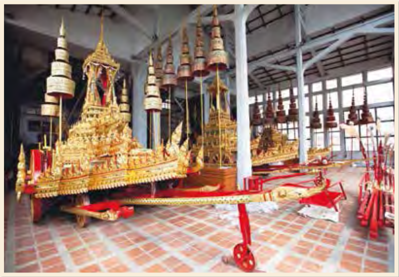
ราชรถน้อย เก็บรักษาอยู่ในโรงราชรถ พิพิธภัณฑสถานแห่งชาติ พระนคร

เป็นราชรถไม้ มีลักษณะคล้ายพระมหาพิชัยราชรถ และเวชยันตราชรถ คือมีส่วนตัวรถที่แกะสลักลงรักปิดทองประดับกระจก คานที่ยื่นออกมาเป็นรูปนาคราช บนราชรถมีบุษบกตั้งอยู่เช่นเดียวกัน เพียงแต่มีขนาดเล็กกว่า ราชรถน้อยองค์หนึ่งใช้เป็นราชรถที่สมเด็จพระสังฆราชประทับ ทรงสวดนาคระบวนพระมหาพิชัยราชรถ ราชรถองค์ที่สอง เป็นราชรถโยงพระภูษาจากพระบรมโกศ จากนั้นเป็นราชรถน้อยองค์ที่สาม ใช้เป็นราชรถสำหรับพระบรมวงศานุวงศ์ผู้ใหญ่ประทับ เพื่อทรงไปรยทานพระราชทานแก่ประชาชนที่มาเฝ้ากราบพระบรมศพตามทางสู่พระเมรุมาศ