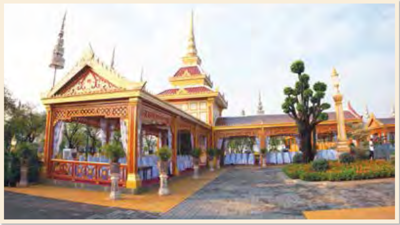
ทับเกษตรในงานพระเมรุ สมเด็จพระเจ้าภคินีเธอ เจ้าฟ้าเพชรรัตนราชสุดา สิริโสภาพัณณวดี