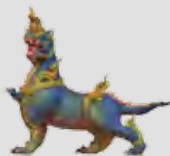
ไกรสรนาคา