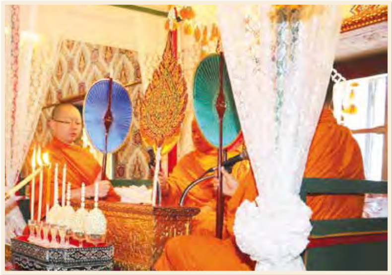
พระพิธีธรรมสวดพระอภิธรรมในการพระราชพิธีบำเพ็ญพระราชกุศล พระบรมศพ พระบาทสมเด็จพระปรมินทรมหาภูมิพลอดุลยเดช

ทำนองสรภัญญะ เน้นคำสวดชัดเจนและเอื้อนทำนองเสียงสูงต่ำ