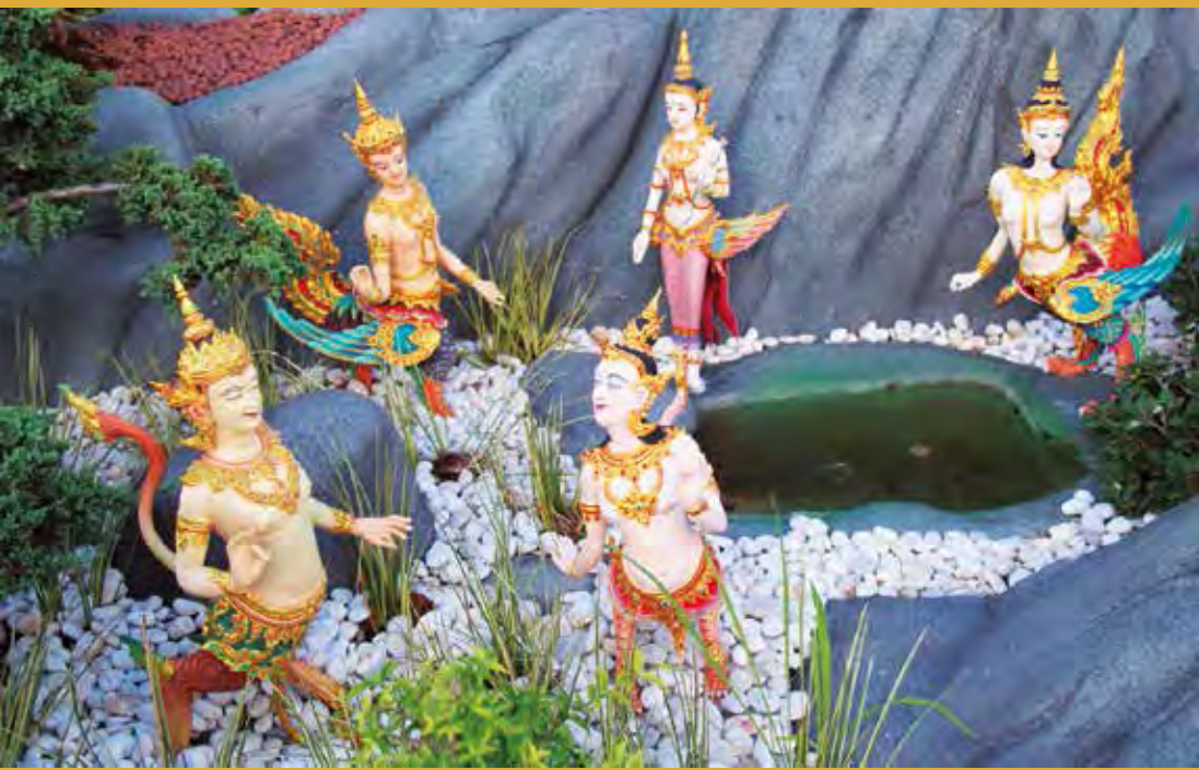
กinnar กinnari ประดับพระเมรุ สมเด็จพระเจ้าภคินีเธอ เจ้าฟ้าเพชรรัตนราชสุดา สิริโสภาพัณณวดี