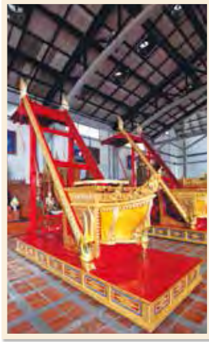
เกรินบันไดนาค เก็บรักษาอยู่ในพระราชรถ พิพิธภัณฑ์สถานแห่งชาติ พระนคร