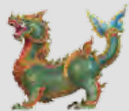
ไกรสรวาริน