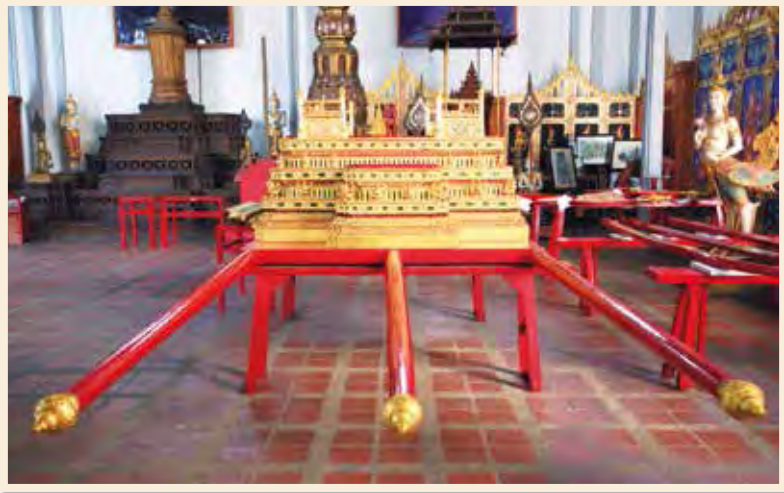
พระยานมาศสามลำคาน เก็บรักษาอยู่ในพระราชรถ พิพิธภัณฑ์สถานแห่งชาติ พระนคร