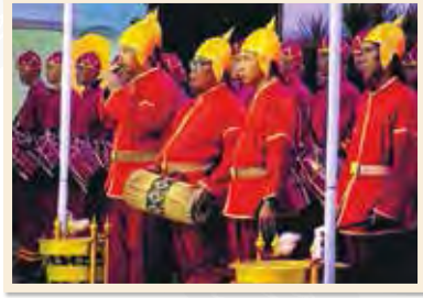
การประโคมย่ำยามในการพระราชพิธีบำเพ็ญพระราชกุศล พระบาทสมเด็จพระปรมินทรมหาภูมิพลอดุลยเดช