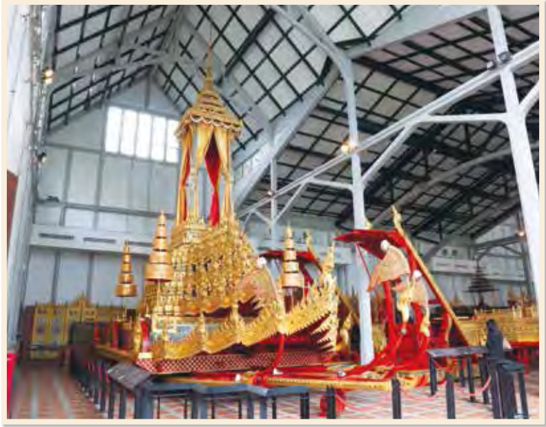
พระมหาพิชัยราชรถ เก็บรักษาอยู่ในโรงราชรถ พิพิธภัณฑสถานแห่งชาติ พระนคร