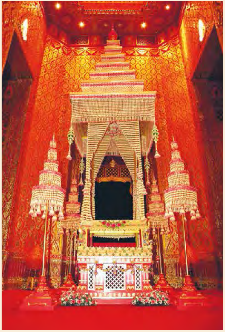
พระจิตกาธานที่ประดับเครื่องสดเรียบร้อยแล้วในงานพระเมรุ สมเด็จพระเจ้าภคินีเธอ เจ้าฟ้าเพชรรัตนราชสุดา สิริโสภาพัณณวดี