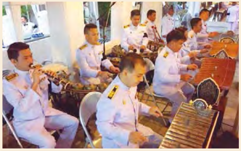
การบรรเลงของวงปี่พาทย์นางหงส์ในการพระราชพิธีบำเพ็ญพระราชกุศล พระบรมศพ พระบาทสมเด็จพระปรมินทรมหาภูมิพลอดุลยเดช