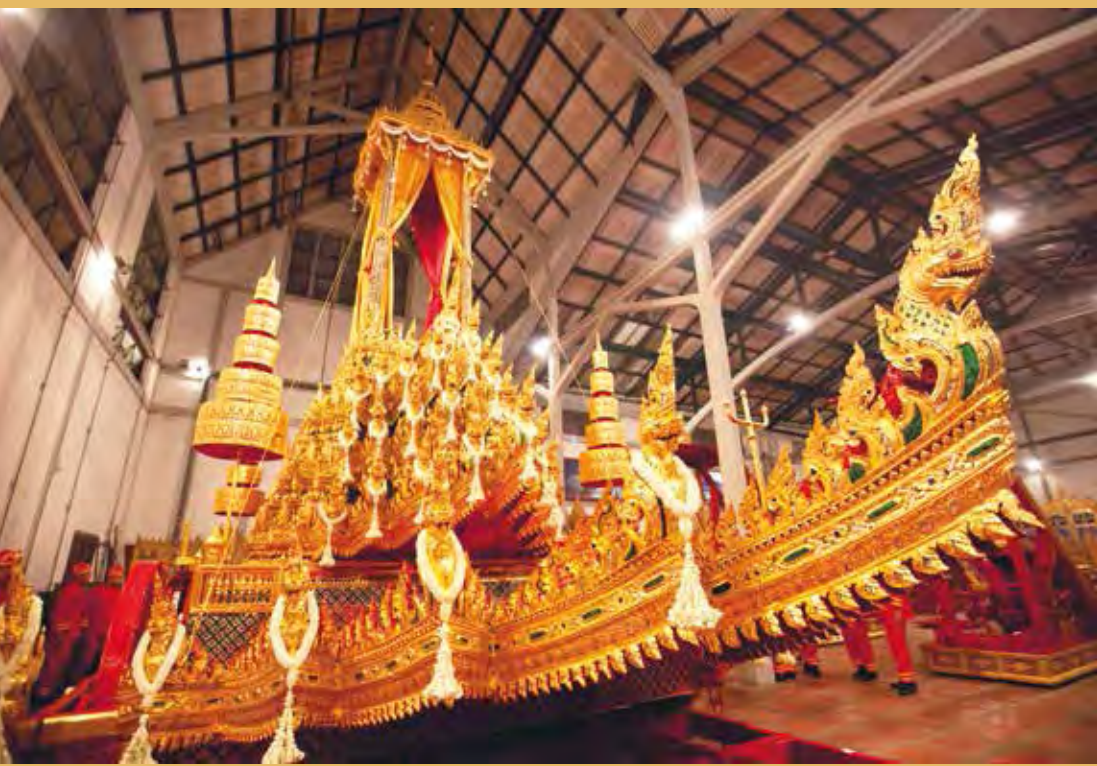
พระมหาพิชัยราชรถ เก็บรักษาอยู่ในโรงราชรถ พิพิธภัณฑสถานแห่งชาติ พระนคร