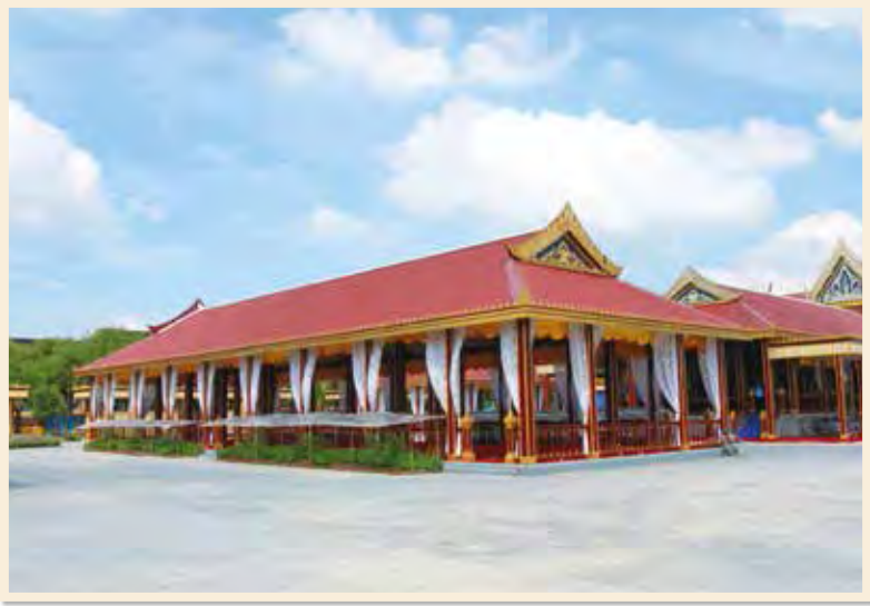
ศาลาลูกขุนในงานพระเมรุ สมเด็จพระเจ้าภคินีเธอ เจ้าฟ้าเพชรรัตนราชสุดา สิริโสภาพัณณวดี