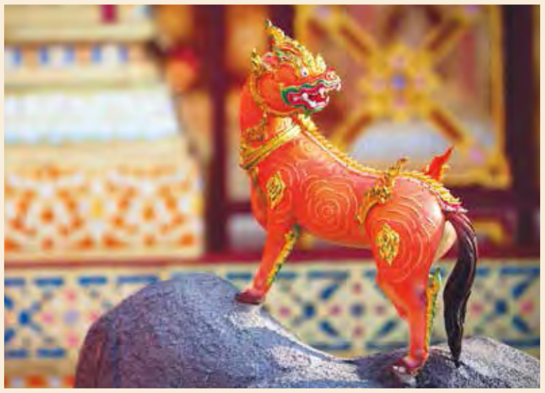
ดุรงค์ไกรสร เป็นหนึ่งในสัตว์หิมพานต์ประดับพระเมรุ สมเด็จพระเจ้าภคินีเธอ เจ้าฟ้าเพชรรัตนราชสุดา สิริโสภาพัณณวดี

เป็นรูปสัตว์ที่ประดับตกแต่งรายรอบพระเมรุมาศ ตามคติเรื่องโลกและจักรวาล ซึ่งมีเขาพระสุเมรุเป็นศูนย์กลาง ล้อมรอบด้วยเขาสัตตบริภัณฑ์ และดาษด้นด้วยสิงสาราสัตว์นานาพันธุ์ สมัยก่อนจึงจัดทำรูปสัตว์รายรอบพระเมรุมาศและพระเมรุ รวมทั้งมีการผูกหุ่นรูปสัตว์เข้าขบวนแห่พระบรมศพหรือพระศพไปสู่พระเมรุมาศหรือพระเมรุด้วย