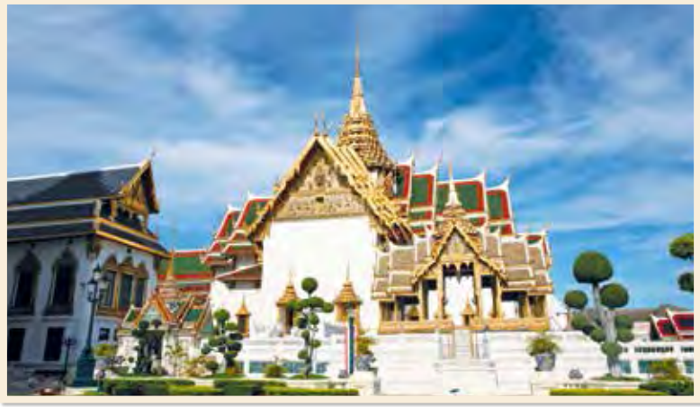
พระที่นั่งดุสิตมหาปราสาท แลเห็นพระที่นั่งอาภรณ์ภิโมกข์ปราสาทอยู่ทางด้านขวา

มุขด้านใต้ของพระที่นั่งดุสิตมหาปราสาทเชื่อมต่อกับพระที่นั่งพิมานรัตยา ด้วยมุขกระสัน ส่วนมุขด้านตะวันออกมีทางเดินเชื่อมกับพระที่นั่งอาภรณ์ภิโมกข์ปราสาท และมุขด้านทิศตะวันตกมีทางเดินเชื่อมกับศาลาเปลื้องเครื่อง มีอัฒจันทร์ทางขึ้นพระที่นั่งสองข้างมุขเด็จ และทางขึ้นด้านทิศตะวันออกและทิศตะวันตกอย่างละ ๑ แห่ง ซึ่งสร้างเพิ่มเติมในรัชสมัยพระบาทสมเด็จพระจุลจอมเกล้าเจ้าอยู่หัว