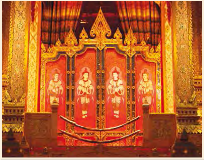
ฉากบังเพลิงในงานพระเมรุ สมเด็จพระเจ้าภคินีเธอ เจ้าฟ้าเพชรรัตนราชสุดา สิริโสภาพัณณวดี