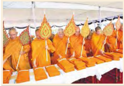
พระสงฆ์สดับปกรณ์ที่ประจำ ณ พระลานพระที่นั่งดุสิตมหาปราสาท ในงานพระเมรุ สมเด็จพระเจ้าภคินีเธอ เจ้าฟ้าเพชรรัตนราชสุดา สิริโสภาพัณณวดี