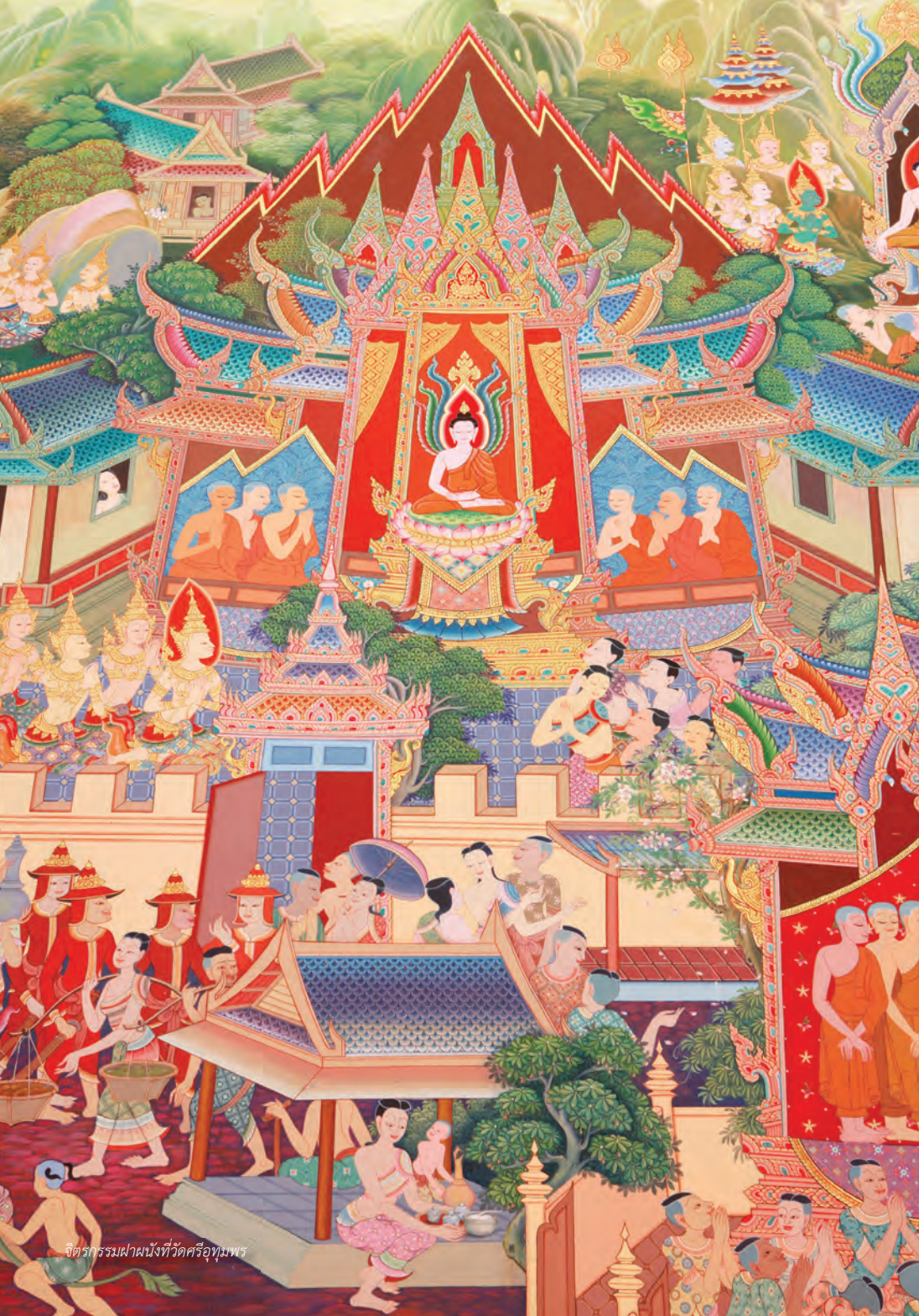
จิตรกรรมฝาผนังที่วัดศรีอุทุมพร