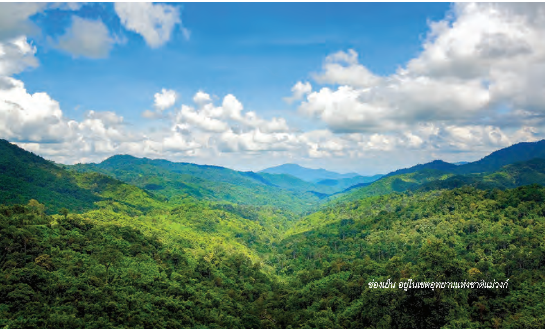
ช่องเย็น อยู่ในเขตอุทยานแห่งชาติแม่วงก์

สถานที่ท่องเที่ยวภายในเขตอุทยานฯ มีอยู่หลายแห่ง แต่ส่วนใหญ่อยู่ในพื้นที่จังหวัดกำแพงเพชร บริเวณที่ทำการอุทยานฯ ได้แก่ ช่องเย็น ซึ่งมีอากาศหนาวเย็นทั้งปี และยังเป็นจุดดูนกที่สำคัญอีกแห่งหนึ่งพบนกหายาก เช่น นกเงือกคอแดง นกภูหงอนพม่า นกพญา