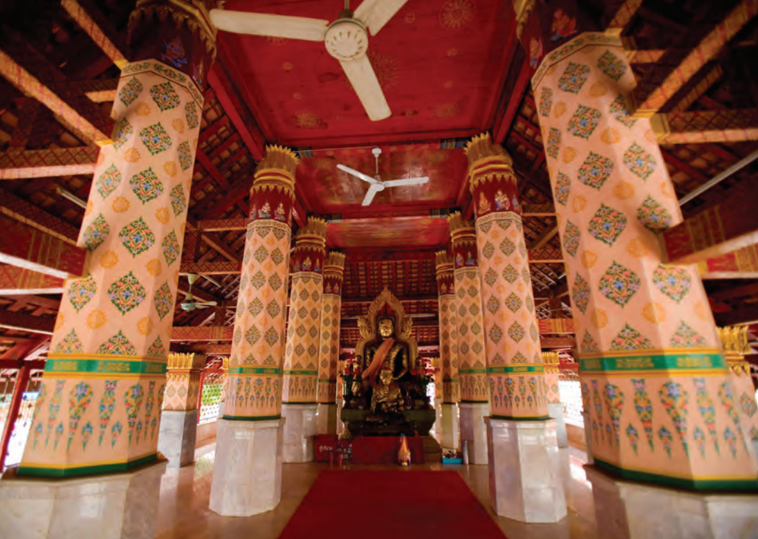
วัดจอมศรีนาคพรต

บ่อเพาะพันธุ์จระเข้ มีเรือหางยาวนำชมบึงบอระเพ็ด เรือลำเล็กนั่งได้ ๕ คน ราคา ๔๐๐ บาท เรือลำใหญ่นั่งได้ ๑๐ คน ราคา ๕๐๐ บาท เรือจะล่องไปถึงเกาะลัดและกลับใช้เวลา ๑ ชั่วโมง สามารถนำอาหารไปรับประทานบนเรือได้ มีเรือบริการ ตั้งแต่เวลา ๐๙.๐๐-๑๗.๐๐ น. แต่ถ้าล่องเรือในช่วงแปดถึงเก้าโมงเช้าจะพบนกได้ง่ายกว่า ติดต่อสอบถามข้อมูลได้ที่สถานีพัฒนาประมงน้ำจืดบึงบอระเพ็ด โทร. ๐ ๕๖๒๗ ๔๕๐๑, ๐ ๕๖๒๓ ๐๑๘