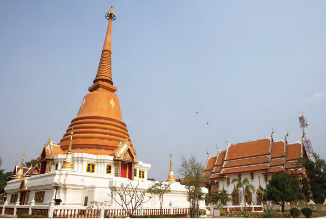
วัดศรีสวรรค์สังฆาราม (วัดถือน้ำ)

สานให้เกิดการผสมผสานกันระหว่าง คน สถานที่ และช่วงเวลา โดยมีรูปแบบอาคารที่มีความหมายเชิงสัญลักษณ์ ที่เป็นเอกลักษณ์ของแม่น้ำเจ้าพระยา ถูกสะท้อนออกมา ในรูปแบบของสถาปัตยกรรมที่โดดเด่นริมน้ำได้อย่างกลมกลืนกับ ลักษณะโครงสร้าง คล้ายเส้นสายที่สอดประสานกันมาบรรจบที่ปลายสื่อถึงการรวมตัวกันของแม่น้ำหลักจาก ๔ สาย ประสานกันเป็นสองสายและรวมเป็นหนึ่งเดียว อาคารถูกออกแบบและก่อสร้างขึ้นให้สามารถคงอยู่ในสภาพภูมิประเทศ ที่จะมีน้ำขึ้นสูงในช่วงฤดูน้ำหลาก เป็นลักษณะของอาคารที่ยกโค้งพ้นน้ำ ประชาชนหรือนักท่องเที่ยวสามารถพายเรือลอดส่วนโค้งของอาคารชมความงามของริมฝั่งน้ำตลอดจนความงามของสถาปัตยกรรมแห่งนี้ท่ามกลางสายน้ำ