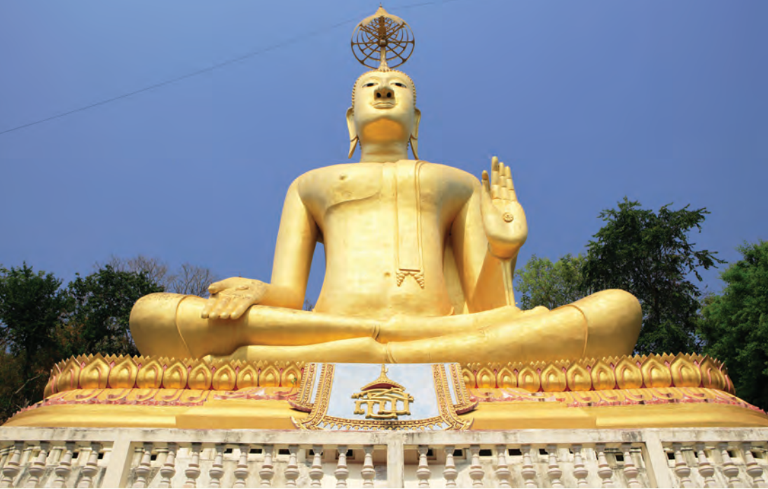
วัดวรนาถบรรพต (วัดเขากบ) พระอารามหลวง

วัดศรีสุวรรณศรีสังฆาราม (วัดถือน้ำ) ตำบลนครสวรรค์ ออกเป็นวัดเก่าแก่ทางประวัติศาสตร์ ซึ่งเป็นสถานที่สำหรับข้าราชการทำพิธีถือน้ำพิพัฒน์สัตยา พระประธานในพระอุโบสถหลังเก่าอายุได้ ๑๐๐ ปีเศษ ใน พ.ศ. ๒๕๑๙ พระบาทสมเด็จพระบรมชนกาธิเบศร มหาภูมิพลอดุลยเดชมหาราช บรมนาถบพิตร สมเด็จพระนางเจ้าสิริกิติ์ พระบรมราชินีนาถ พระบรมราชชนนีพันปีหลวง และสมเด็จพระเจ้าน้องนางเธอทั้งสอง พระองค์เสด็จฯ มาทรงตัดลูกนิมิต พระอุโบสถหลังใหม่ นอกจากนี้ยังพบบุษบกซึ่งเชื่อว่าเป็นของรัชกาลที่ ๕ และมีพิพิธภัณฑของใช้โบราณ อยู่ในเจดีย์กาญจนาภิเษก ๕๐ ปี วัดนี้ถือได้ว่าเป็นวัดเก่าแก่ที่สุดที่มีคุณค่าแก่การศึกษาทางประวัติศาสตร์อย่างยิ่งแห่งหนึ่ง ติดต่อสอบถามข้อมูลเพิ่มเติม โทร. ๐ ๕๖๒๕ ๕๔๔๔