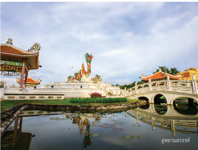
อุทยานสวรรค์