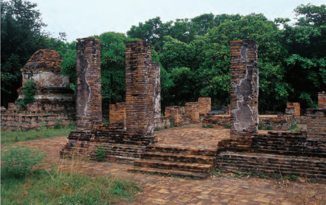
เมืองเก่าเวสาลี

สุวรรณภูมิตลอดทั้งในแคว้นโคตรบูร แคว้นโยนก และ แคว้นทวารวดี โดยมีกรุงละโว้ (ลพบุรี) เป็นราชธานี เมืองเวสาลีนี้ได้สร้างขึ้นในสมัยนั้น มีอายุรุ่นราวคราว เดียวกับกรุงสุโขทัย นครโยนก เมืองโอชะบุรี และ เมืองศรีเทพ โดยที่เมืองเหล่านี้ได้สร้างขึ้นไว้เพื่อเป็น เมืองหน้าด่านของกรุงละโว้ทั้งสิ้น