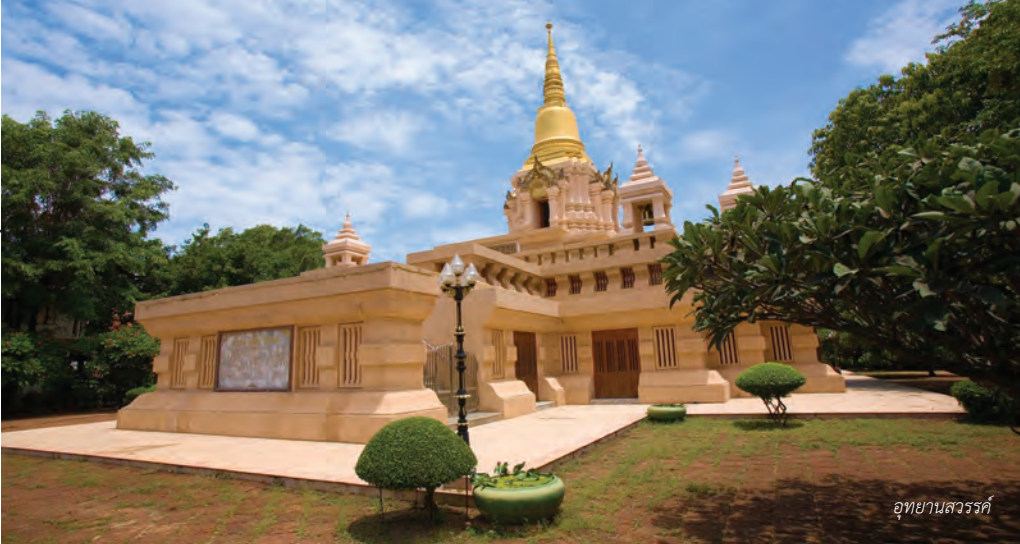
อุทยานสวรรค์