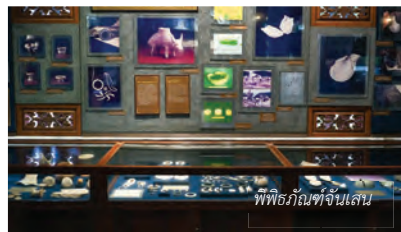
พิพิธภัณฑ์จันทน์เสน่