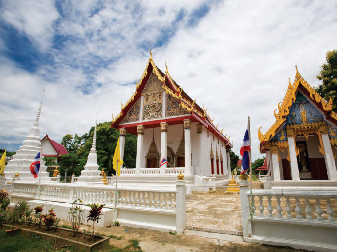
วัดบางมะฝ่อ

ทางไปไกล โดยสร้างมาตั้งแต่ปี ๒๕๖๒ เป็นปาง ประธานพรเวลาคนกราบไหว้ขอพร พรที่ขอนั้นจะ สมหวังทุกประการ