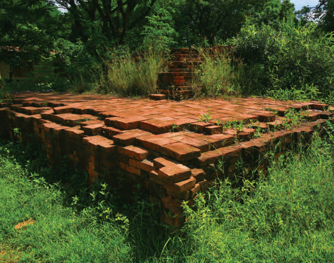
เมืองโบราณโคกไม้เดน