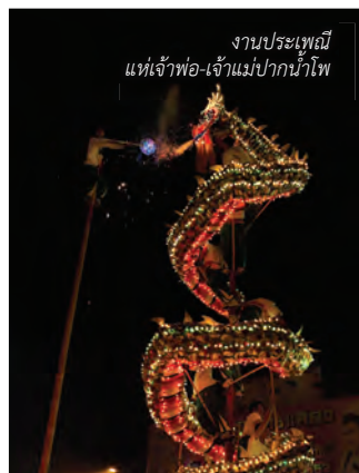
งานประเพณี แห่เจ้าพ่อ-เจ้าแม่ปากน้ำโพ