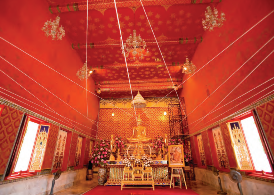
วัดนครสวรรค์

๑๖.๓๐ น. ไม่เสียค่าเข้าชม ติดต่อสอบถามข้อมูล โทร. ๐ ๕๖๒๑ ๙๑๐๐-๒๙ ต่อ ๑๑๓๕