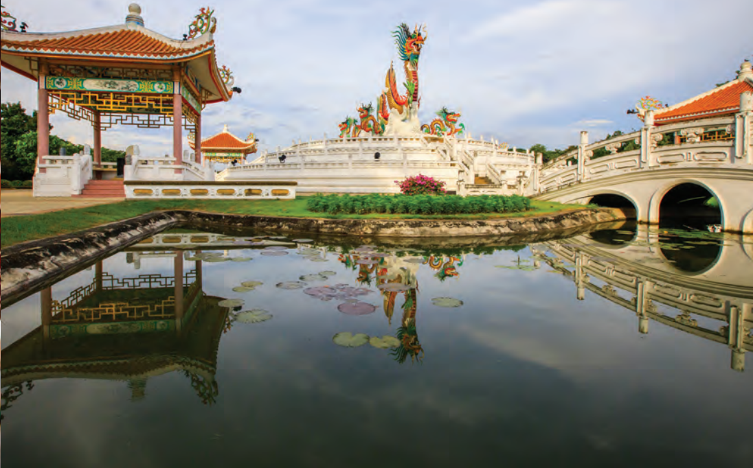
อุทยานสวรรค์

อยู่บนยอดเขาบวชนาคและมองลงมาจะเห็นทัศนียภาพที่สวยงามของสะพานเดชาติวงศ์ แม่น้ำเจ้าพระยา และเขากบ