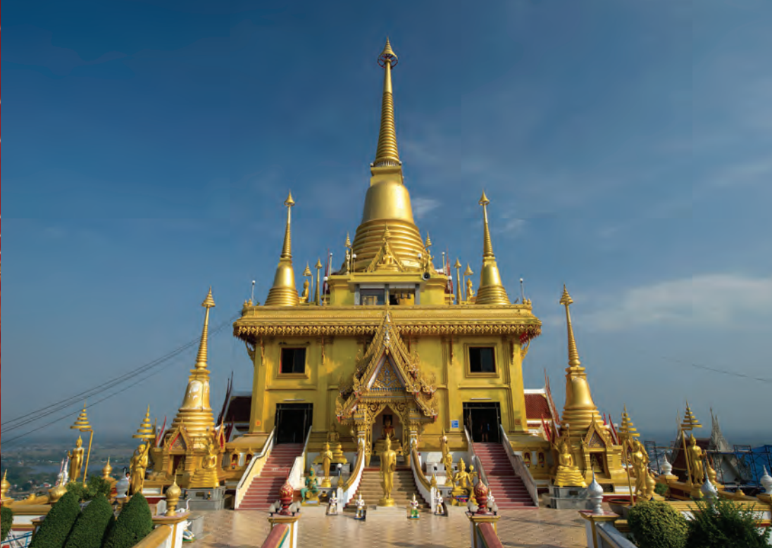
วัดคีรีวงศ์

พระพุทธชินสีห์ เป็นพระพุทธรูปปูนปั้นปางสมาธิ หน้าตักกว้าง ๕ วา ๙ นิ้ว ลักษณะผสมรูปแบบสมัย เชียงแสน สุโขทัย และรัตนโกสินทร์ คือ ขัดสมาธิเพชร เกตุดอกบัวตูม สังฆาฏิสั้น ซึ่งเป็นแบบพระพุทธรูปสมัย เชียงแสน พระพักตร์ส่วนองค์และพระพาหาเป็นแบบ สมัยสุโขทัย ส่วนแท่นพระเป็นแบบสมัยรัตนโกสินทร์