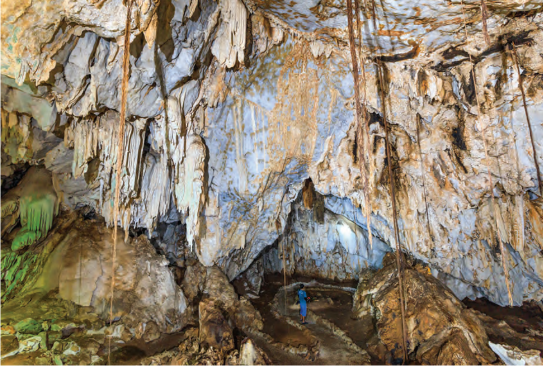
วนอุทยานถ้ำเพชร ถ้ำทอง

วนอุทยานถ้ำเพชร-ถ้ำทอง ตำบลตาคลี ห่างจากที่ทำการอำเภอตาคลี ๑๐ กิโลเมตร ตั้งอยู่ที่เขาซอนเตือ ซึ่งเป็นป่าสลักกับภูเขาหินปูน และมีเส้นทางศึกษาธรรมชาติ บนเขามีถ้ำหินปูนใหญ่น้อยกว่า ๗๐ ถ้ำ เช่น ถ้ำดาวดิงส์ อยู่ทาง ด้านทิศเหนือ มีห้องโถงขนาดใหญ่จุคน ๔๐๐-๕๐๐ คน มีช่องระบายอากาศด้านบน ถ้ำเจ้าพ่อเสือ ถ้ำวิมานลอย ถ้ำมหาโพธิ์ทอง ถ้ำประกายเพชร อยู่ในด้านทิศตะวันตก ลึก ๕๐ เมตร มีห้องโถงขนาดใหญ่ ๕ ห้อง มีหินงอกหินย้อยรูปต่าง ๆ เช่น ปลาโลมาและกำแพงเมืองจีน เป็นต้น ถ้ำประดับเพชร ทางด้านใต้ เป็นห้องโถง ๔ ห้อง มีหินงอกหินย้อยสีน้ำตาลอ่อน-ขาวนวล สีแสงระยิบเหมือนเพชร ถ้ำวังไข่มุก อยู่ทางด้านใต้ มีหินงอกหินย้อย สีน้ำตาลเข้ม น้ำตาลอ่อน จนถึงสีขาวนวล และมีห้องโถง ๓ ห้อง ประดับด้วยเกล็ดเพชร ส่องแสง