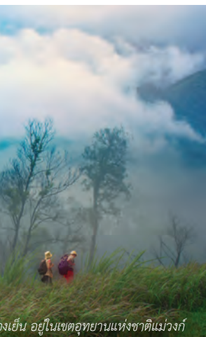
จงเย็น อยู่ในเขตอุทยานแห่งชาติแม่วงก์