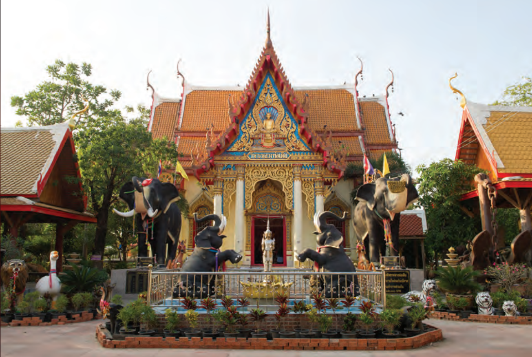
วัดหนองกลับ

เขาพระ-เขาสูง ตำบลหนองกลับ เป็นดินแดนมหัศจรรย์ที่มีทรัพยากรอันทรงคุณค่าอย่างยิ่ง อาทิ หินแกรนิตสีชมพู หินสีดำ และหินมรกต บนยอดเขาพระ มีหินก้อนสีชมพูขนาดมหึมาวางเรียงรายทับซ้อนกันเด่นตระหง่านอย่างน่ามหัศจรรย์ ซึ่งเป็นจุดชมวิวที่สามารถมองเห็นทิวทัศน์อันสวยงามของอำเภอหนองบัว ก่อนเดินทางถึงยอดเขาจะต้องผ่านซอกยอกเขา หรือซอกยอกหินหนับ มีขนาดแคบ ๓๐ เซนติเมตร เป็น จุดที่ทำท้าทายความสามารถต่อการพิสูจน์ความสวยงาม ของยอดเขาพระ-เขาสูง แห่งนี้ รวมถึงพรรณไม้นานาชนิดที่น่าสนใจ เช่น ป่าลาน นอกจากนี้ยังมีโครงการ อันเนื่องมาจากพระราชดำริ ได้แก่ อ่างเก็บน้ำหลวงพ่อกไร อ่างเก็บน้ำคลองไม้แดง และอ่างเก็บน้ำคลองวังเหียง