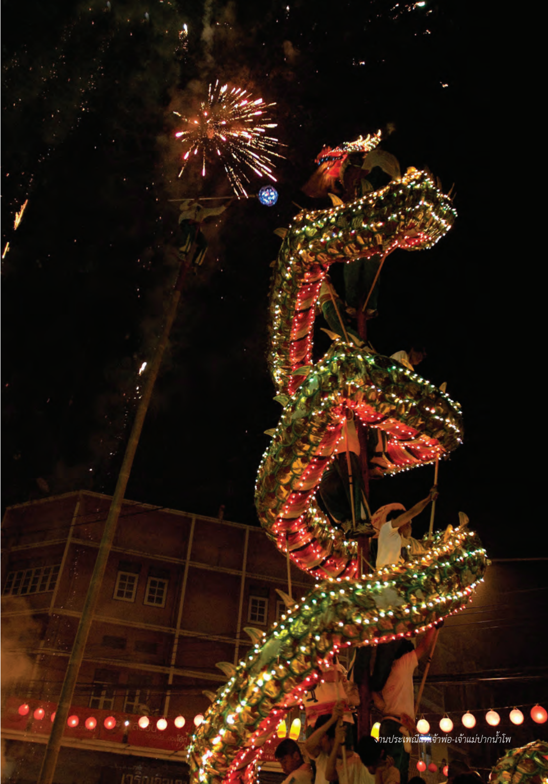
งานประเพณีไฟเจ้าพ่อ-เจ้าแม่ปากน้ำโพ