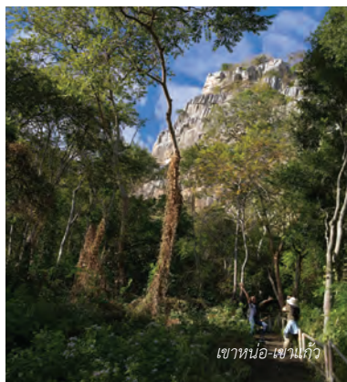
เขาน้ำร้อน-เขาน้ำแก้ว