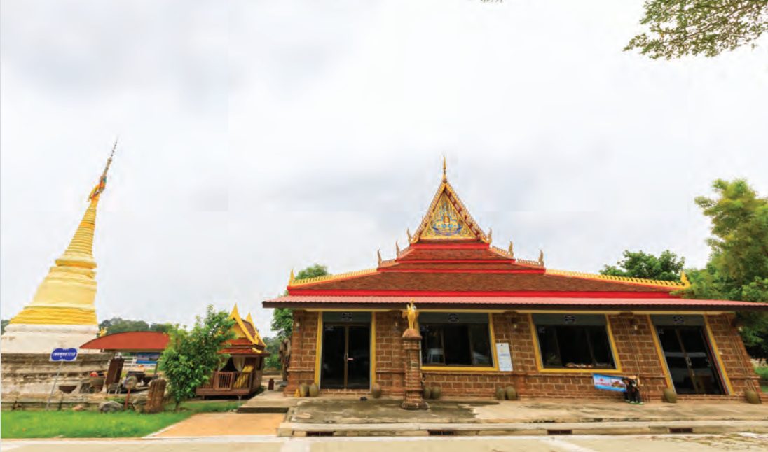
วัดเกยไชยเหนือ

๒๕๕๒ เพื่อให้ผู้คนจากสองฟากฝั่งแม่น้ำน่านสัญจรข้ามไป-มา โดยข้ามรถยนต์ ๔ ล้อวิ่งผ่าน อนุญาติเฉพาะจักรยาน มอเตอร์ไซด์ และเดินเท้าเท่านั้น