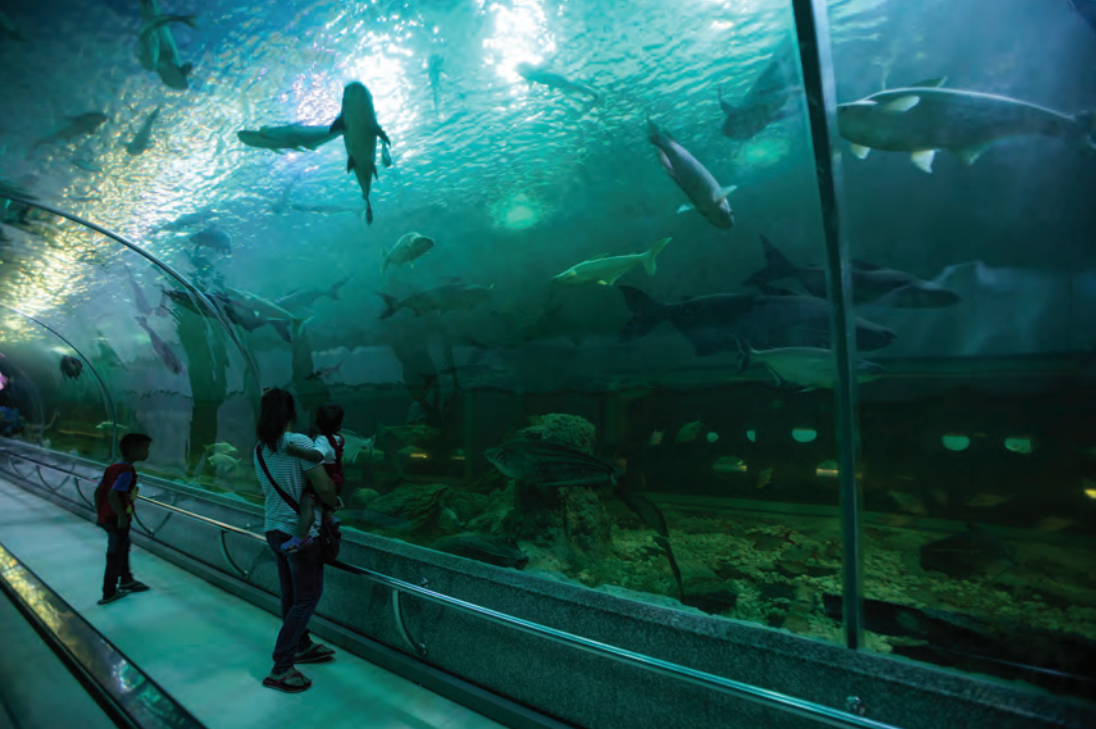
อาคารแสดงพันธุ์สัตว์น้ำบึงบอระเพ็ด