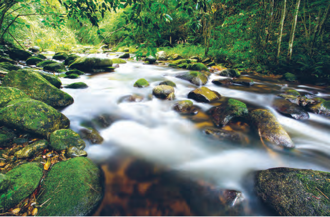
น้ำตกแม่เฒ่า อยู่ในเขตอุทยานแห่งชาติแม่วงก์

ปากกว้างหางยาว นกหัวขวานใหญ่ทองนกลีง เป็นต้น แก่งผานางคอย น้ำตกนางนวล แก่งลานนกยูง ป่อน้ำอุ่น และ จุดชมวิว เป็นต้น สถานที่ท่องเที่ยวที่อยู่ในพื้นที่จังหวัดนครสวรรค์ ได้แก่ น้ำตกแม่เฒ่า (น้ำตกแม่เฒ่า) เป็นน้ำตกขนาดใหญ่มี ๕ ชั้น ชั้นที่ ๓ มีความสูงที่สุด ๑๐๐ เมตร น้ำไหลเกือบตลอดปี สวยงามมาก อยู่ห่างจากที่ทำการอุทยานฯ ๒๑ กิโลเมตร การเดินทาง ต้องเดินเท้าเข้าไปใช้เวลาไปกลับ ประมาณ ๓-๔ วัน