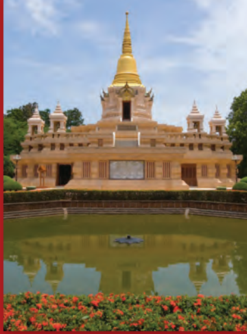
เมืองโบราณและพิพิธภัณฑ์จันเสน