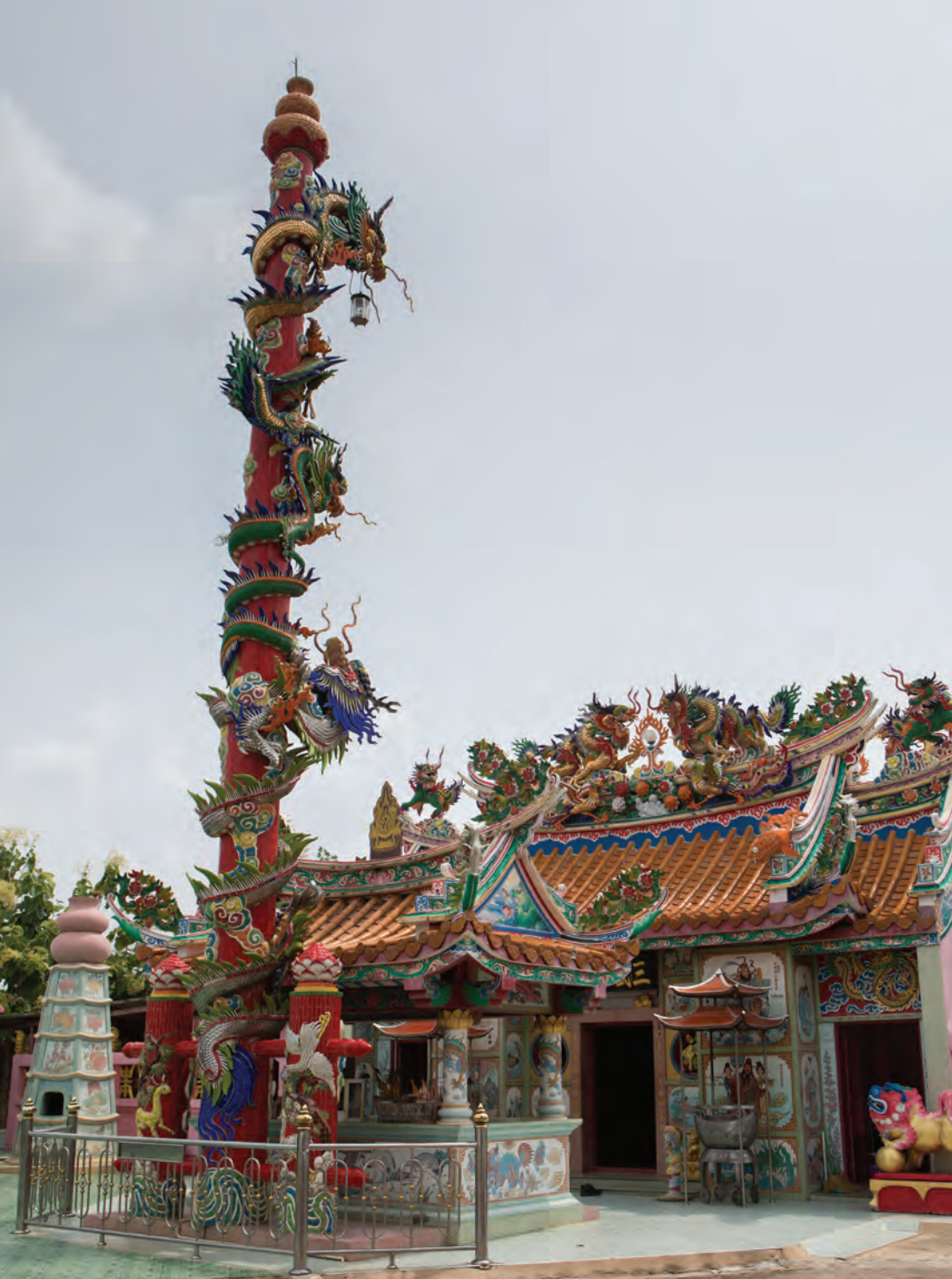
ศาลเจ้าพ่อเจ้าแม่ขุมแสง