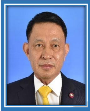
พลอากาศเอก ถาวร มณีพฤกษ์ ที่ปรึกษาคณะกรรมาธิการ