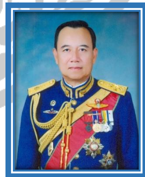
พลเอก เลิศฤทธิ เวชสวรรค์ ที่ปรึกษาคณะกรรมการ