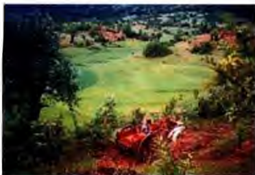
ทุ่งนาในรัฐชาน