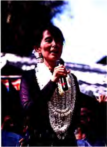
ออง ชาน ซูจี

พม่าตกเป็นอาณานิคมของอังกฤษในปี พ.ศ. 2429 และระยะก่อนการเกิด สงครามโลกครั้งที่ 2 เล็กน้อย ญี่ปุ่นได้เข้ามามีบทบาทในเอเชียตะวันออกเฉียงใต้ โดยได้ติดต่อกับพวกตะขิ่น ซึ่งเป็นกลุ่มนักศึกษาหนุ่มที่มีหัวรุนแรง มี ออง ชาน นักชาตินิยม และ เป็นผู้นำของนักศึกษาในมหาวิทยาลัยอย่างกึ่งเป็นหัวหน้า พวกตะขิ่นเข้าใจว่าญี่ปุ่นจะสนับสนุนการประกาศอิสรภาพของพม่าจากอังกฤษ แต่เมื่อญี่ปุ่นยึดครองพม่าได้แล้ว กลับพยายามหน่วงเหนี่ยวมิให้พม่าประกาศเอกราช และได้ส่งอองชานและพวกตะขิ่นประมาณ 30 คน เดินทางไปญี่ปุ่นเพื่อรับคำแนะนำในการดำเนินการเพื่อเรียกร้องอิสรภาพจากอังกฤษ