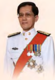
มีพระบรมราชโองการโปรดเกล้าฯ แต่งตั้ง นายปราโมทย์ โชติมงคล ดำรงตำแหน่งเป็น ประธานผู้ตรวจการแผ่นดิน