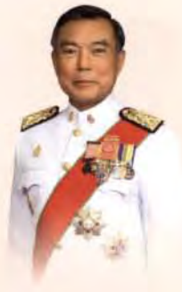
มีพระบรมราชโองการโปรดเกล้าฯ แต่งตั้ง พลเอกธีรเดช มีเพียร ดำรงตำแหน่งเป็น ผู้ตรวจการแผ่นดินของรัฐสภา