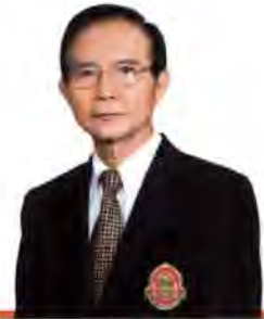
นายพลกฤษณ์ ปิยะอนันต์ พ.ศ. 2545 - พ.ศ. 2551