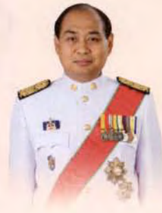
มีพระบรมราชโองการโปรดเกล้าฯ แต่งตั้ง นายประวิธ รัตนเพียร ดำรงตำแหน่งเป็น ผู้ตรวจการแผ่นดิน