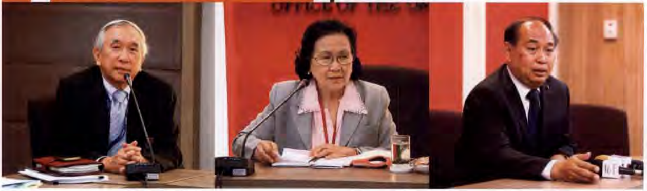
สำนักวิชาการและยุทธศาสตร์