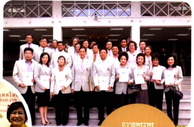
ถวายพระพร พระบาทสมเด็จพระเจ้าอยู่หัว ณ โรงพยาบาลศิริราช วันที่ 22 ธันวาคม 2552