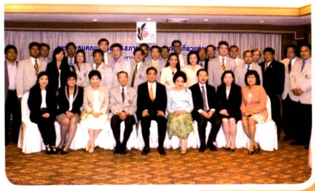
ประชุมคณะกรรมการ สทท. ณ โรงแรมโซฟิเทล เซ็นทารา แกรนด์ กรุงเทพฯ วันที่ 21 พฤษภาคม 2552

ร่วมงานส่งเสริมการขาย TTM +2009 Muang Thong