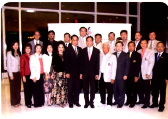
งานเลี้ยงปีใหม่ 2552 ณ โรงแรมเซ็นทารา แกรนด์ กรุงเทพฯ