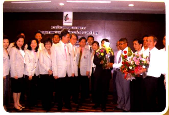
สหภาพแรงงานการท่องเที่ยวแห่งประเทศไทย อวยพรปีใหม่ สทท.