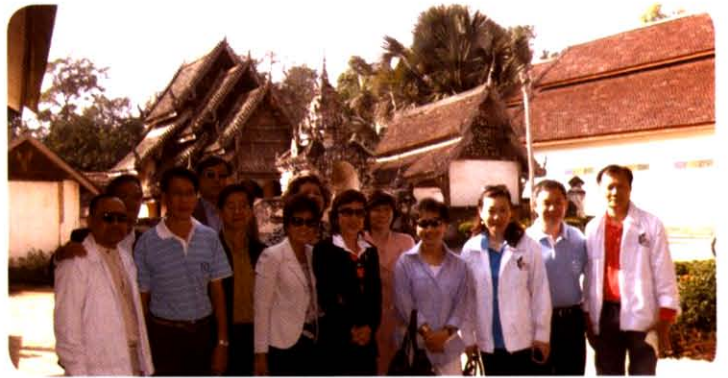
กรรมการ สทท. สํารวจแหล่งท่องเที่ยว วัดเสลารัตนบุรีพตาราม (วัดโล่ห์หินแก้วข้างยี่น) จังหวัดลําปาง