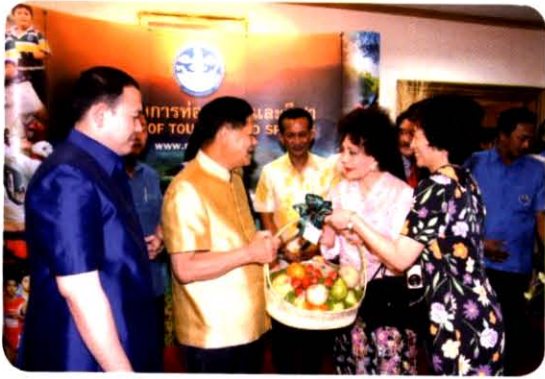
แสดงความยินดีเนื่องในโอกาส วันคล้ายวันสถาปนากระทรวงการท่องเที่ยวและกีฬา วันที่ 3 ตุลาคม 2552