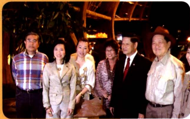
เปิดตัวโรงแรมเซ็นทรัล (Mirage ทัพยา)