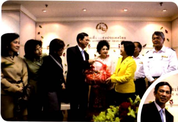
แสดงความยินดีเนื่องในโอกาส วันคล้ายวันสถาปนา ททท. ปี 2553