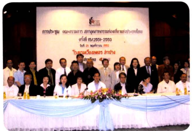
ประชุมคณะกรรมการ สทท. ณ โรงแรมเวียงลคอร ลำปาง วันที่ 23 พฤศจิกายน 2552