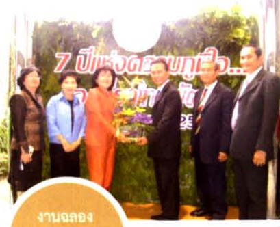
งานฉลองครบรอบ 7 ปี สทท.