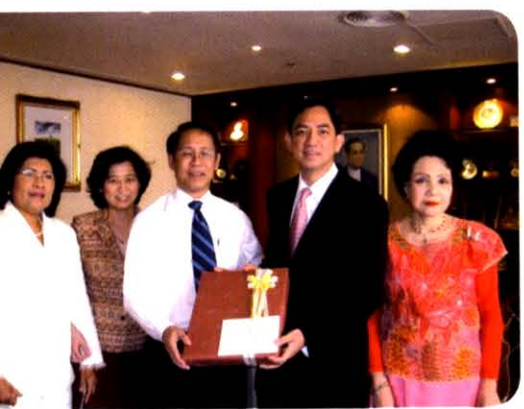
อายุพรปีใหม่ 2552 แด่การท่องเที่ยวแห่งประเทศไทย