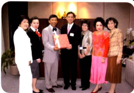
อวยพรปีใหม่ 2552 แด่บริษัท การบินไทย จำกัด (มหาชน)