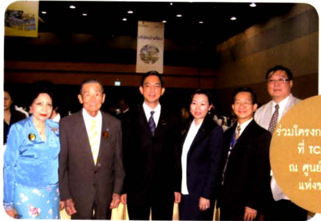
ร่วมโครงการรักเมืองไทย ที่ TCEB จัดขึ้น ณ ศูนย์การประชุม แห่งชาติสิริกิติ์