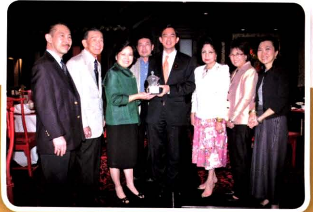
งานเลี้ยงอดีตผู้ว่าฯ ททท. คุณพรศิริ มโนหาญ ณ โรงแรมแลนด์มาร์ค วันที่ 21 กรกฎาคม 2552

แสดงความยินดีแก่ นายชุมพล ศิลปอาชา รมว.กระทรวงการท่องเที่ยว และกีฬา