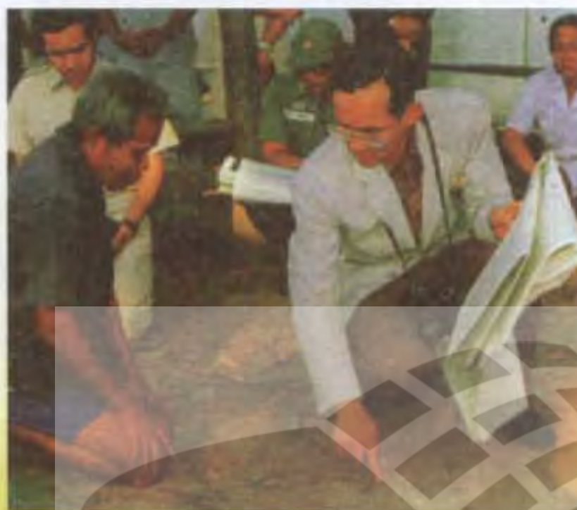
ความจงรักภักดี ธวัช อังคารกุล

พระบาทสมเด็จพระปรมินทรมหาภูมิพลอดุลยเดช ภายหลังจากพระราชพิธีบรมราชาภิเษกในปลายปฐมวัยแล้ว ได้เสด็จพระราชดำเนินไปในพื้นที่ท้องถื่นทั่วประเทศไทย ได้ทรงศึกษาความเป็นอยู่ของราษฎรและสภาพภูมิประเทศ ได้ทรงทำหน้าที่เสมือนเป็นนักวิจัยและพัฒนา เนื่องจากได้ทรงศึกษาหาความรู้จากสภาพความเป็นจริงทางภูมิศาสตร์ ทรงเก็บข้อมูลอันนำมาสู่กระบวนการวิเคราะห์และวินิจฉัยปัญหาตามความเป็นจริง จนสามารถวางรูปแบบเป็นโครงการทดลองจนเห็นผลแล้วจึงจะนำมาสู่ภาคปฏิบัติในรูปของโครงการต่าง ๆ ภายใต้อาณาจักรความเป็นจริงในเรื่องท้องฟ้า อากาศ น้ำ แผ่นดิน ภูเขา ป่าไม้ พืชผักผลไม้ เพื่อการบริโภค และพืชไม้ดอก ทุกสิ่งทีกล่าวถึงล้วนแล้วแต่เป็นทรัพยากรธรรมชาติอันกว้างใหญ่ไพศาลที่ทรงนำมาบริหารจัดการเป็นรูปโครงการเพื่อการพัฒนาทั้งด้านทรัพยากรมนุษย์และทรัพยากรธรรมชาติ ตลอดถึงสภาพแวดล้อมทางวัตถุ อันนำมาสู่ความเจริญทั้งที่เป็นรูปธรรมสามารถจับต้องได้ และที่เป็นนามธรรมที่ส่งผลถึงความสุขสงบของมวลมนุษย์