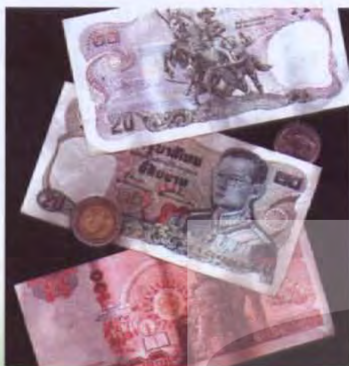
กฎหมายแชร์กับอาชญากรรมเศรษฐกิจการเงิน สองศาสตราจารย์ ดร. เกียรติโกส ใจรินธนาวัฒน์

การเล่นแชร์นั้นหากเล่นกันในกรอบของกฎหมายแล้วย่อมที่จะไม่ส่งผลเสียอะไรต่อระบบเศรษฐกิจมากนักหากแต่ถ้าเป็นการเล่นแชร์ลูกโซ่หรือพีระมิดเกมส์แล้วนั้นย่อมเป็นการฉ้อโกงประชาชนเพื่อทำการระดมทุนจำนวนมหาศาลจากประชาชนเพื่อนำเงินจำนวนนี้ไปฉ้อโกงประชาชนกลุ่มอื่นต่อไป การระดมทุนเช่นนี้หากประชาชนหลงเชื่อเป็นจำนวนมากย่อมก่อให้เกิดผลกระทบต่อระบบเศรษฐกิจในวงกว้างกล่าวคือประชาชนจะไม่นำเงินไปลงทุนหรือออมไว้ในสถาบันเงินฝากในระบบแต่จะนำเงินมาลงทุนในแชร์ลูกโซ่เหล่านี้เนื่องจากการเสนอประโยชน์ที่มากกว่าอาชญากรรมที่เกี่ยวกับเงินนอกระบบนี้ได้เคยปรากฏให้เห็นมาแล้ว คือ คดีแชร์น้ำมันของนางชม้อย ทิพย์โส แชร์น้ำมันของนางนงแก้ว ใจเย็น แชร์เสมาฟ้าคราม แชร์ลูกโซ่ แชร์ปิรามิด แชร์ชาร์เตอร์ รวมตลอดไปถึงการกระทำความผิดทางการเงินในรูปแบบต่าง ๆ ซึ่งส่วนใหญ่แล้วก็จะออกมาในรูปแบบของการฉ้อโกงประชาชน