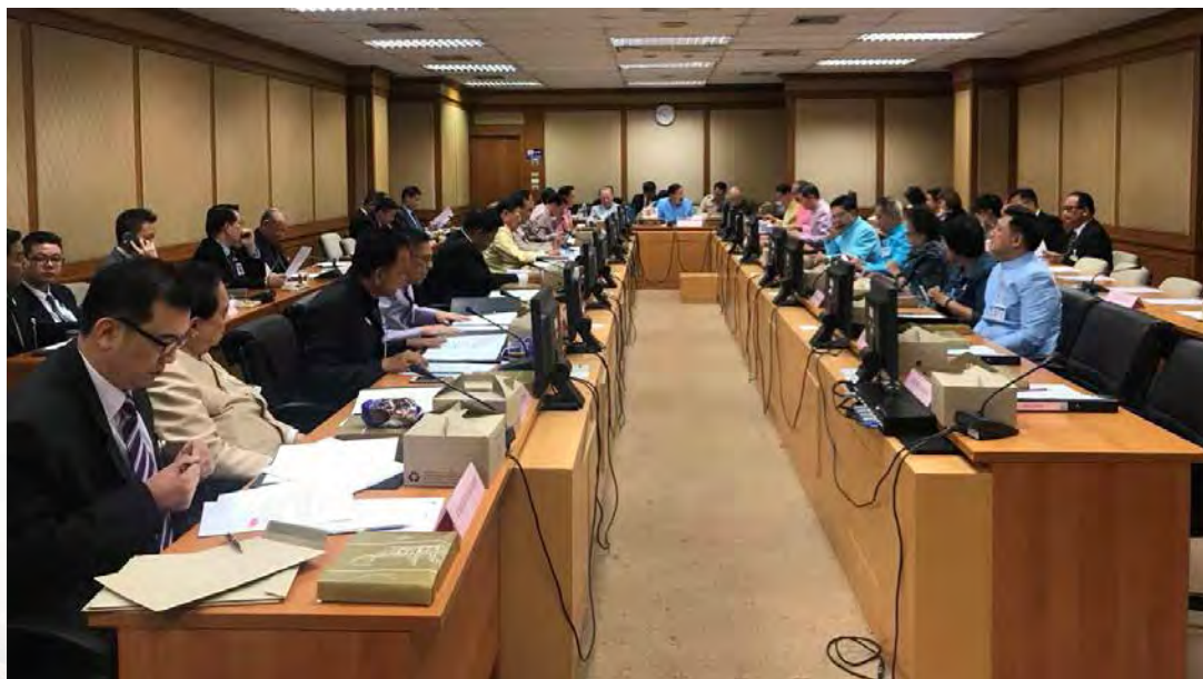
(การประชุมคณะกรรมการ)