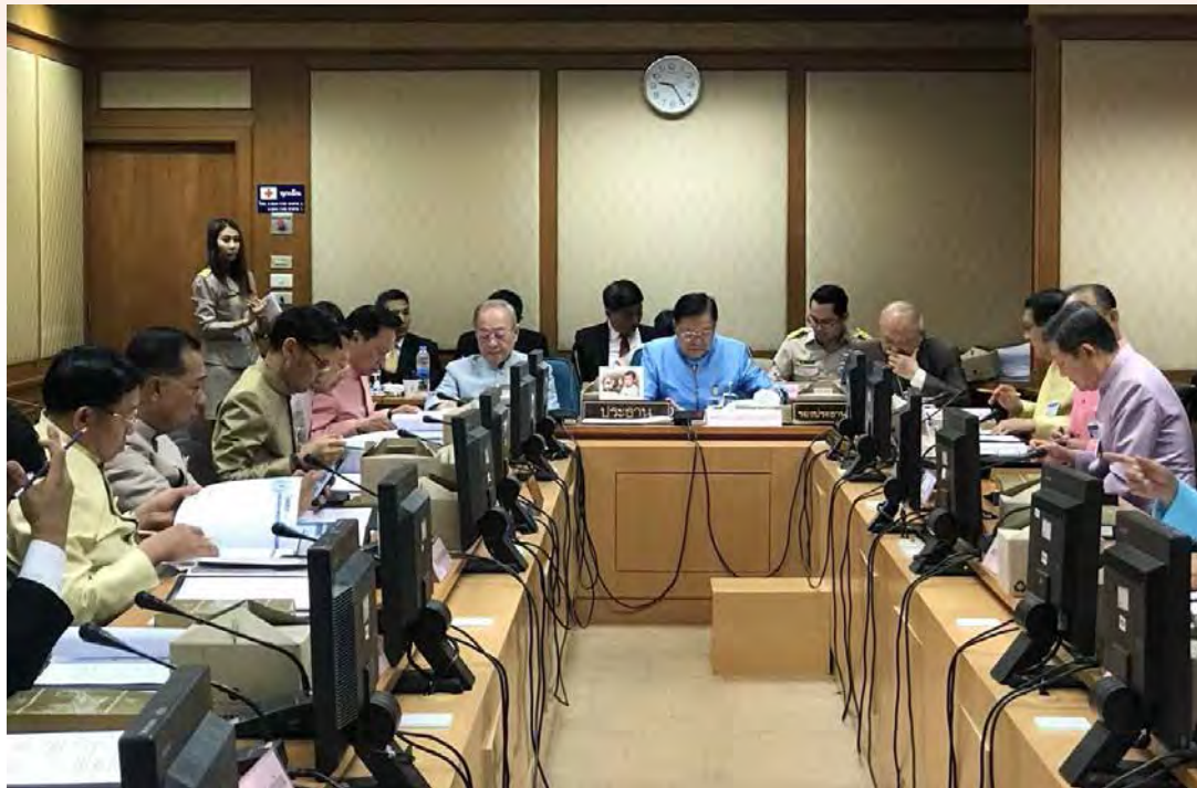
(การประชุมคณะกรรมการ)

ภาพกิจกรรมการดำเนินงานคณะกรรมการการกฎหมาย กระบวนการยุติธรรมและกิจการตำรวจ