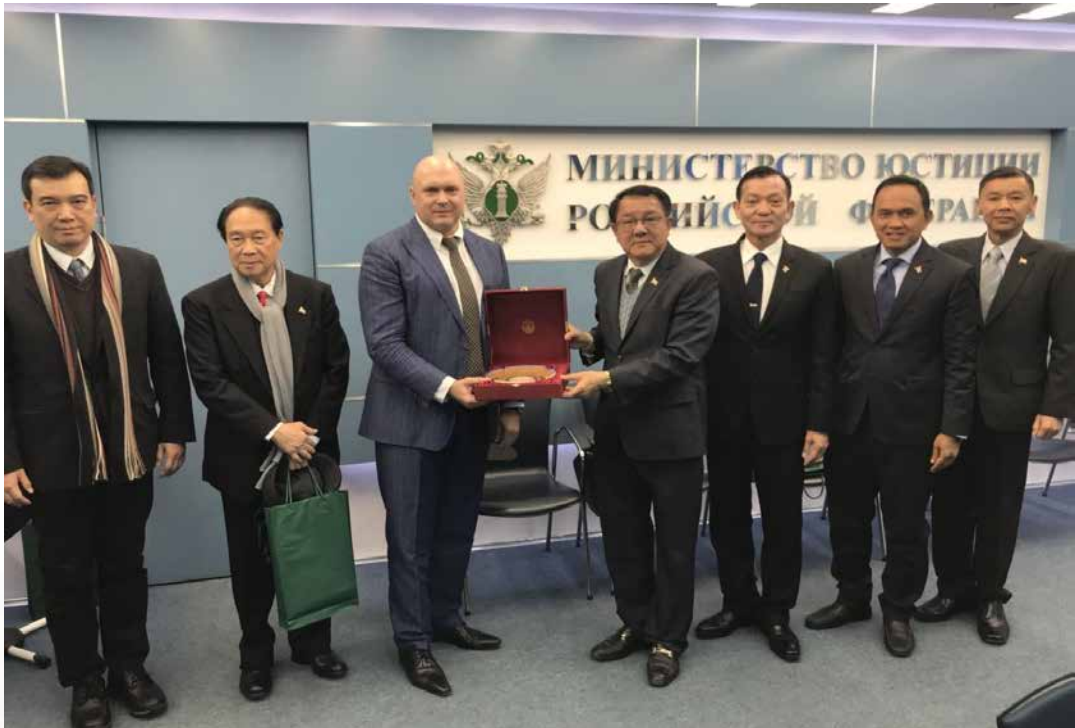
(การเดินทางไปเยือนและประชุมทวิภาคี ระหว่างวันที่ ๗ - ๑๖ เมษายน ๒๕๖๑ ณ สหพันธรัฐรัสเซีย)