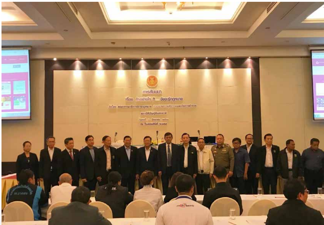
(การจัดสัมมนา เรื่อง “ทำอย่างไร?...จึงจะรู้กฎหมาย” ในวันพุธที่ ๖ มิถุนายน ๒๕๖๑ ณ จังหวัดระนอง)