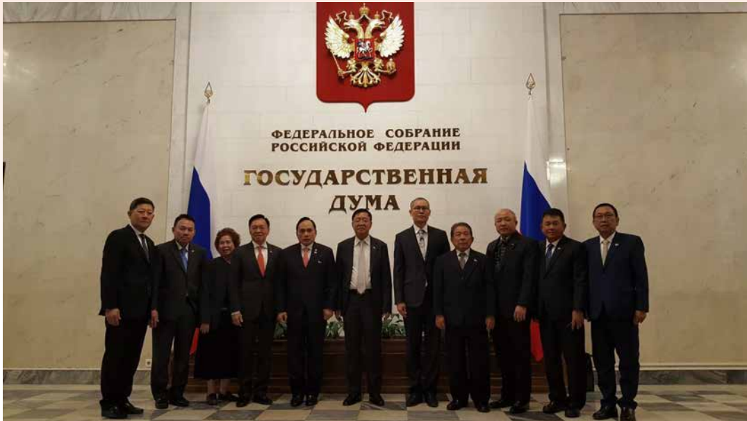
(การเดินทางไปเยือนและประชุมทวิภาคี ระหว่างวันที่ ๗ - ๑๖ เมษายน ๒๕๖๑ ณ สหพันธรัฐรัสเซีย)