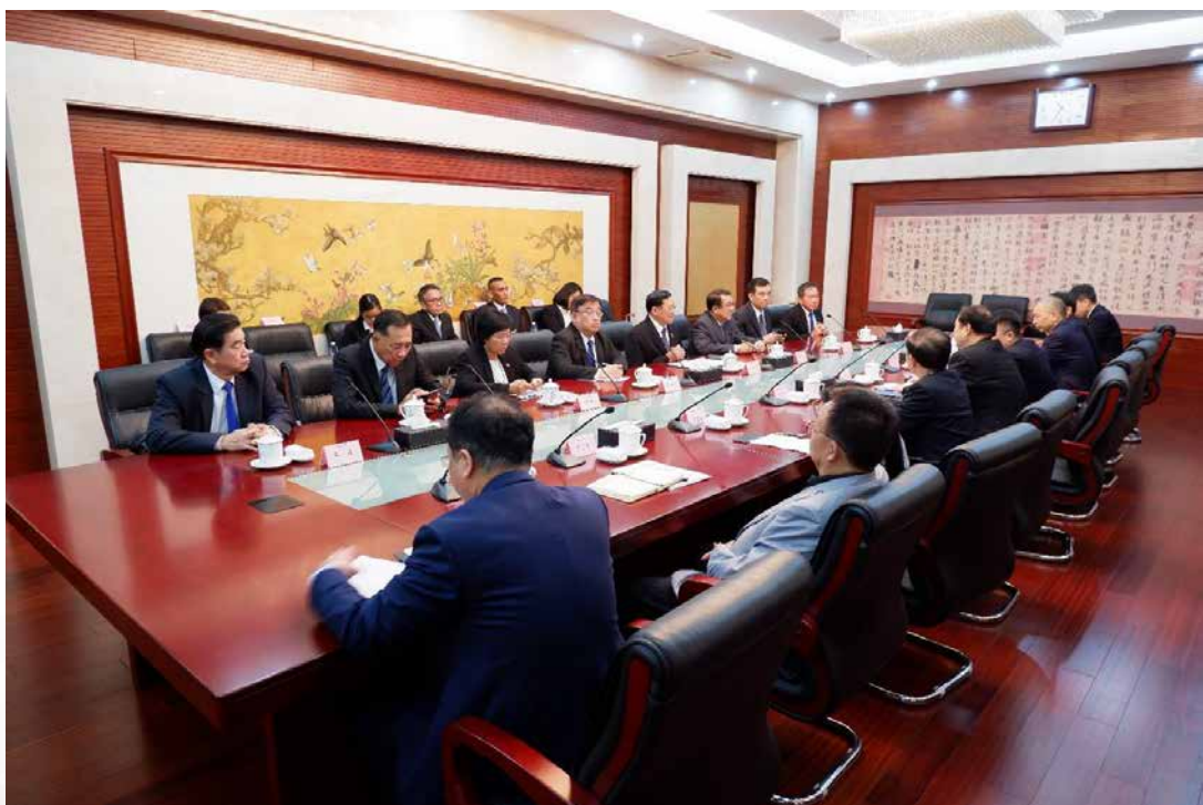
(การเดินทางไปเยือนและประชุมทวิภาคี ระหว่างวันที่ ๑๐ - ๑๕ มิถุนายน ๒๕๖๑ ณ สาธารณรัฐประชาชนจีน )