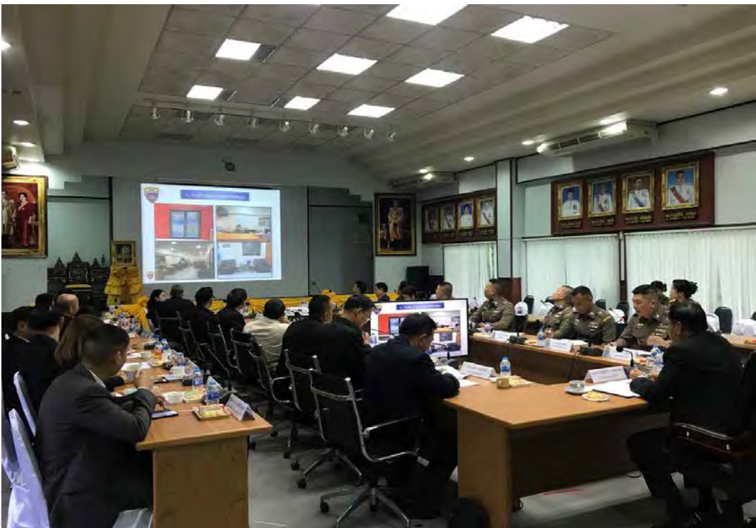
(การเดินทางศึกษาดูงาน ณ จังหวัดระนอง ระหว่างวันที่ ๔ - ๖ มิถุนายน ๒๕๖๑)