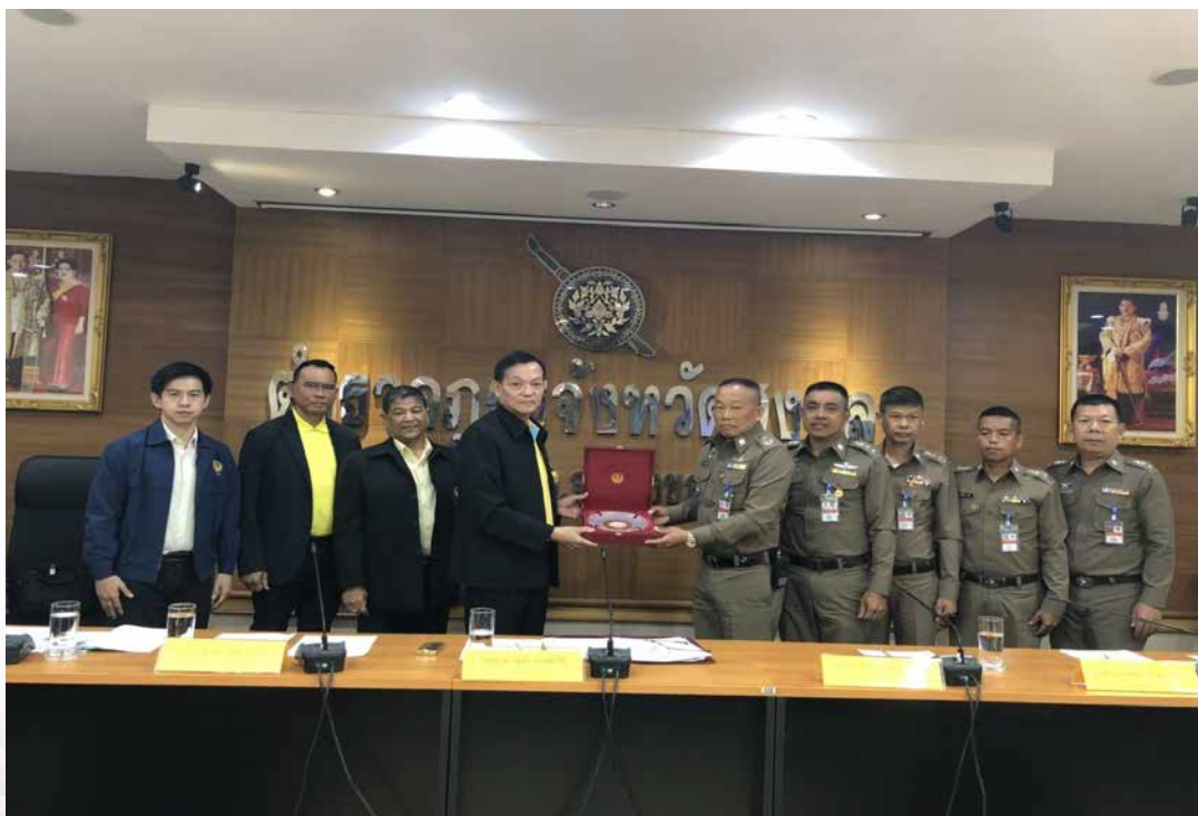
(การเดินทางไปศึกษาดูงาน ณ จังหวัดสงขลา ระหว่างวันที่ ๒ - ๓ กรกฎาคม ๒๕๖๑)