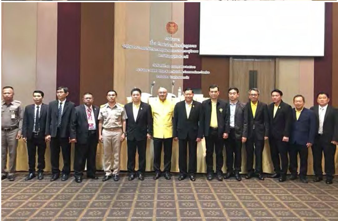
(การจัดสัมมนา เรื่อง “ทำอะไร?...จึงจะรู้กฎหมาย” ในวันจันทร์ที่ ๑๖ กรกฎาคม ๒๕๖๑ ณ จังหวัดขอนแก่น)