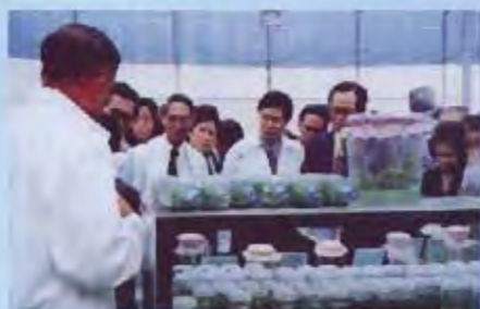
ดูงานด้านสิ่งแวดล้อม ในงานเกษตรและอุตสาหกรรมโลก ณ เทคโนโลยี มหาวิทยาลัยเทคโนโลยีสุรนารี จังหวัดนครราชสีมา