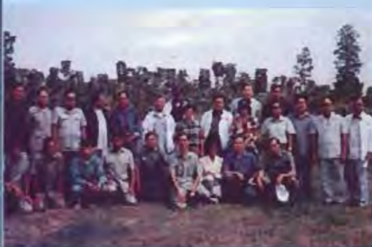
เยี่ยมชมกิจการปลูกป่าภาคเอกชน ที่บ้านนาเวียง จังหวัดขอนแก่น

5.3 เกี่ยวกับการที่เจ้ากระทรวงกำหนดกรอบนโยบายในหลักกว้าง ๆ ขึ้นมาและอนุมัติงบประมาณเพื่อการนั้นมาให้แต่ละจังหวัดดำเนินการ แต่ละจังหวัดมีความต้องการที่แตกต่างกัน ในส่วนนี้จังหวัดจะได้รับงบประมาณสมทบเพื่อโครงการ/แผนงานที่เหมาะสมกับพื้นที่ของตน จากงบประมาณจังหวัดตามข้อเสนอของสมาชิกสภาผู้แทนราษฎรอย่างไรก็ดีปัจจุบันสภาตำบลได้รับการยกฐานะเป็นนิติบุคคลโดยมี ลักษณะเป็นองค์การบริหารส่วนตำบลแล้ว ควรจะได้รับการกระจายอำนาจและผลักดันงบประมาณในส่วนนี้ไปให้ท้องถิ่นดังกล่าว ใช้สำหรับการพัฒนาโดยตรงต่อไป II