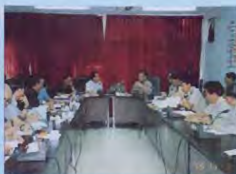
รับฟังการบรรยายสรุปเกี่ยวกับหน้าที่ความรับผิดชอบ และปัญหาอุปสรรคในการดำเนินงานจากผู้บริหารราชการจังหวัด และหัวหน้าส่วนต่าง ๆ จังหวัดหนองคาย