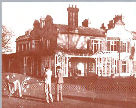
ทรงสละราชสมบัติ ณ บ้านโนล แครนลี อังกฤษ 2 มีนาคม 2477