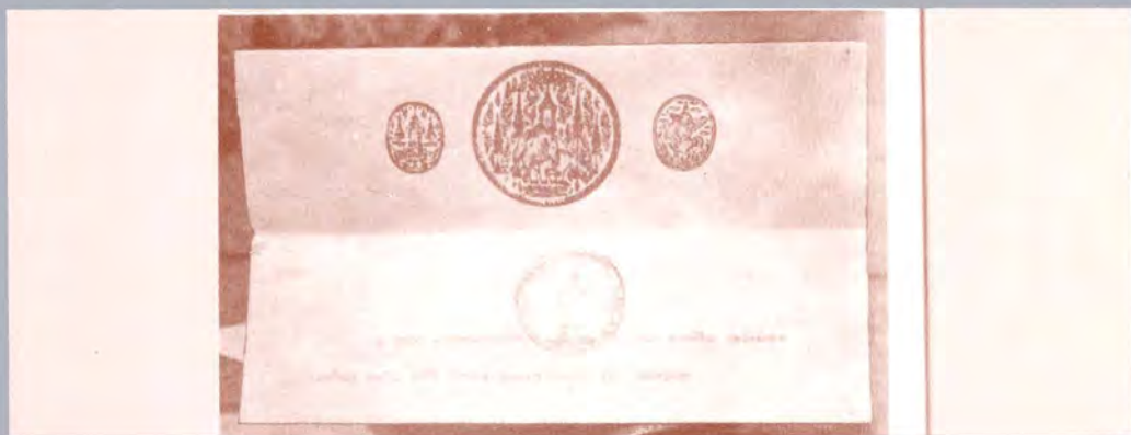
พระราชทานรัฐธรรมนุญ ฉบับถาวรฉบับแรก 10 ธันวาคม 2475