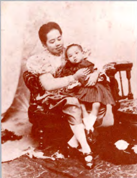
พระราชสมภพ 8 พฤศจิกายน 2436