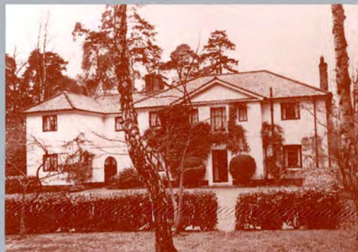
เสด็จสวรรคต ณ พระตำหนักดอมพัดัน เว็นเวิร์ธ อังกฤษ 30 พฤษภาคม 2484