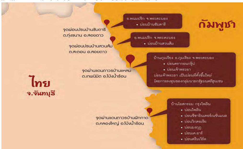
แผนภาพ 2 พื้นที่ซึ่งได้รับผลกระทบจากบ่อนชายแดนไทย

จากการวิจัยของทีมรัฐศาสตร์ ราชภัฏรำไพพรรณี (2556) เกี่ยวกับการขยายธุรกิจบ่อนกาสิโนในพื้นที่ชายแดนไทย-กัมพูชา จังหวัดจันทบุรี นั้น พบว่า มีกาสิโน หรือชื่อที่เรียกกันทั่วไปว่า “บ่อน” ใน 4 พื้นที่ โดยบ่อนตามแนวชายแดนเหล่านี้ ส่งผลกระทบต่อชุมชนชายแดน ชุมชนใกล้เคียง และชุมชนเมืองจันทบุรี ที่แม้จะอยู่ไกลจากชายแดน กว่า 60 กิโลเมตร ดังกรณีศึกษาถึงผลกระทบของบ่อนตรงจุดผ่านแดนถาวรบ้านผักกาด ตำบลคลองใหญ่ อำเภอโป่งน้ำร้อน จังหวัดจันทบุรี ซึ่งมีกาสิโนตั้งอยู่ในฝั่งกัมพูชามากถึง 10 แห่ง ดังรายละเอียดในแผนภาพดังต่อไปนี้