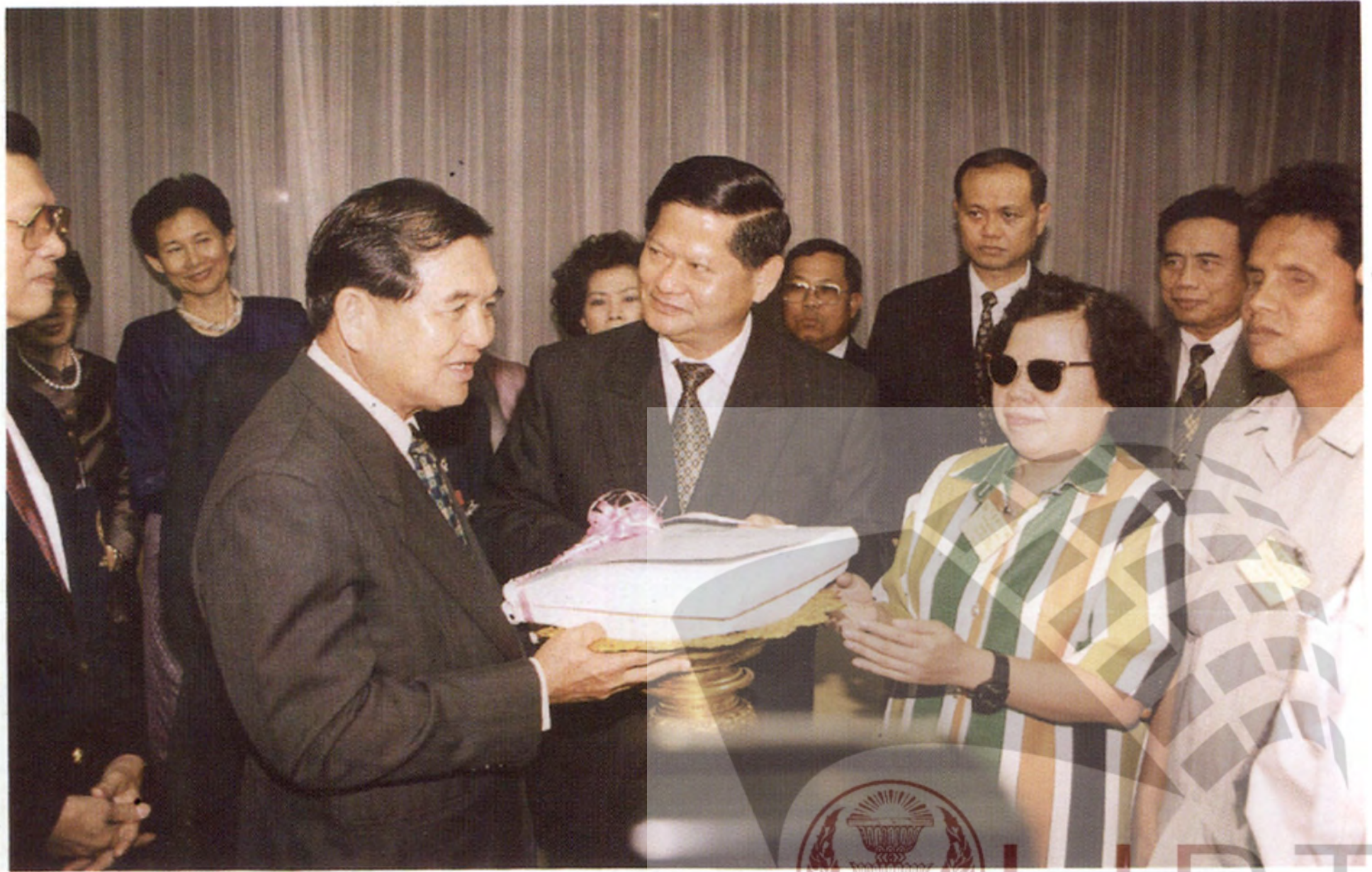
๒๖ มิ.ย. ๔๑ นายไกรฤกษ์ เพชรธำรง รองประธานสภาผู้แทนราษฎร คนที่ ๑ รับมอบรัฐธรรมนูญฉบับอักษรเบรลล์ สำหรับคนตาบอด จากนายชุมพล ศิลปอาชา รัฐมนตรีว่าการกระทรวงศึกษาธิการ เพื่อนำไปใช้ในเขตเลือกตั้ง