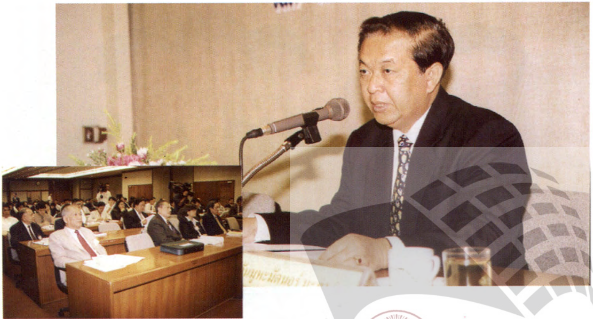
๑๕ มิ.ย. ๔๑ นายวันมูหะมัดนอร์ มะทา ประธานรัฐสภา และประธานสภาผู้แทนราษฎร เป็นประธานในพิธีเปิดสัมมนาเรื่อง 'การดำเนินงานของประเทศไทยกับอนุสัญญาว่าด้วยความหลากหลายทางชีวภาพ' ณ ห้องประชุมกรมการหมายเลข ๒๑๓ - ๒ อาคารรัฐสภา ๒