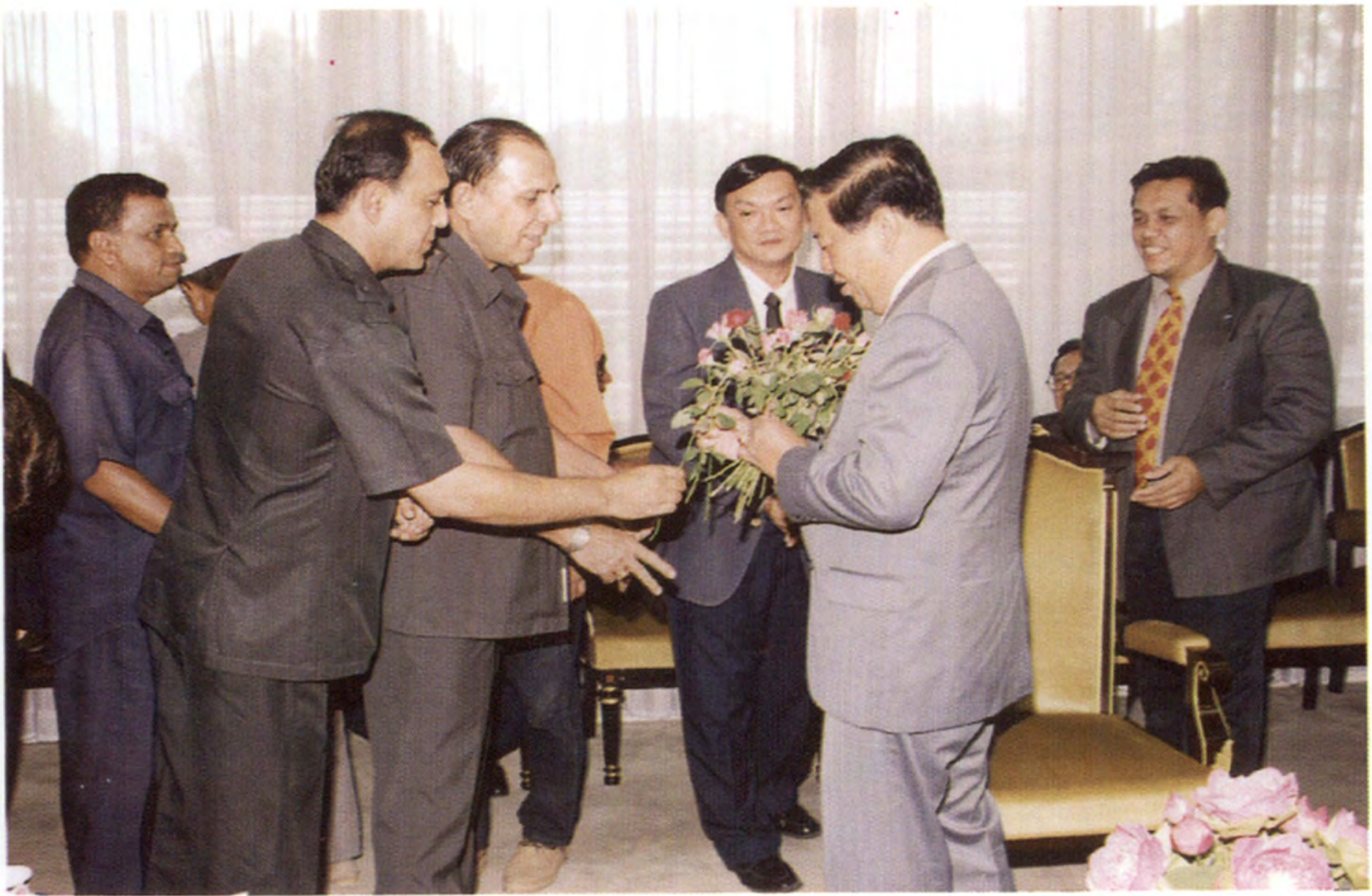
๑ มิ.ย. ๔๑ นายวันมูหะมัดนอร์ มะทา ประธานรัฐสภา และประธานสภาผู้แทนราษฎร ให้การต้อนรับนายกสมาคมชาวปาकिสถาน ในประเทศไทย และคณะ จำนวน ๔๐ คน เพื่อให้กำลังใจให้ปฏิบัติหน้าที่ประธานรัฐสภาต่อไป ณ ห้องรับรอง ๑ อาคารรัฐสภา ๑