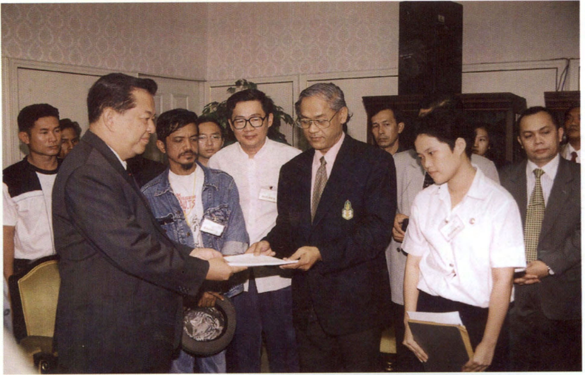
๒๔ มิ.ย. ๔๑ ตัวแทนกลุ่มเกษตรกร ยื่นหนังสือเสนอแนวทางการแก้ไขปัญหาเกษตรกรต่อ นายวันมูหะมัดนอร์ มะทา ประธานรัฐสภา และประธานสภาผู้แทนราษฎร ณ ห้องรับรอง ๑ อาคารรัฐสภา ๑