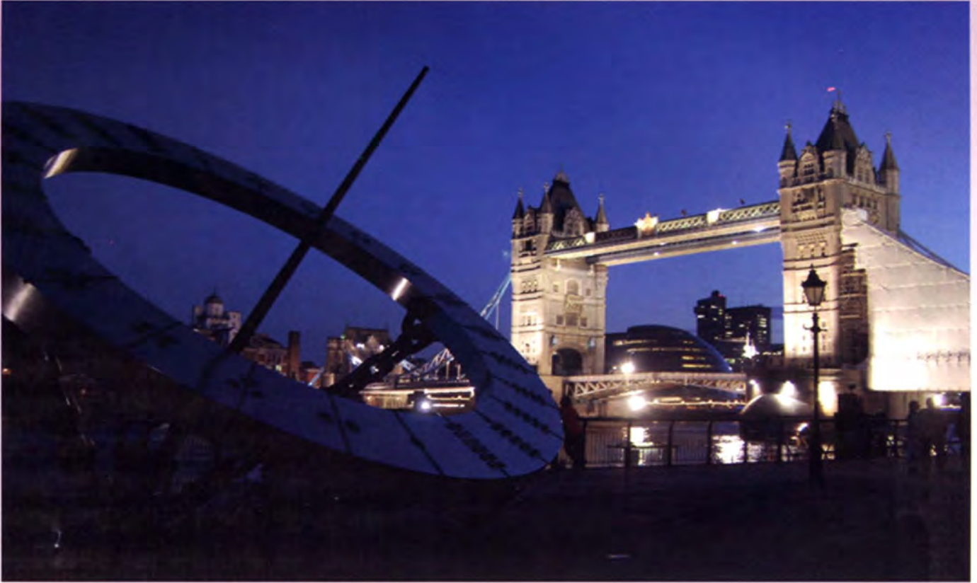
สะพานทาวเวอร์บริดจ์ยามค่ำคืน

ห้องพระคลัง สวนสัตว์ โรงกษาปณ์หลวง หอเก็บเอกสาร หอดูดาวด้วย และตั้งแต่ปี ค.ศ. 1303 ได้ใช้เป็นที่เก็บรักษามงกุฏและเครื่องราชกกุธภัณฑ์ของสหราชอาณาจักร โดยปัจจุบันได้มีการจัดงานนิทรรศการเกี่ยวกับประวัติศาสตร์ของราชวงศ์อังกฤษ รวมถึงงานแสดงอัญมณีและมงกุฏ (Crowns and Diamonds Exhibition) ของสหราชอาณาจักร อีกด้วย