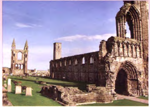
มหาวิทยาลัยเซนต์ แอนดรูส์

ในเวลา 13.30 นาฬิกา คณะฯ ได้ออกเดินทางไปยังกรุงเอดิเนบอร์ เมืองหลวง