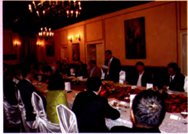
ประธานวุฒิสภาไทยกล่าวขอบคุณประธานวุฒิสภาโรมาเนียในงานเลี้ยงอาหารค่ำ

พลังงานเป็นอย่างยิ่ง ทั้งนี้ หลังจากการปฏิวัติเปลี่ยนแปลงการปกครองแล้ว พบว่ามีส่วนของอาคารเพียง ร้อยละ 45-50 ที่สร้างเสร็จแล้ว จนถึงปัจจุบันอาคารยังสร้างไม่เสร็จสมบูรณ์ การสร้างอาคารหลังดังกล่าวหากนำงบประมาณมาสร้างทางหลวงจะมีความยาวถึง 1,500 กิโลเมตร ซึ่งปัจจุบันทางหลวงทั่วประเทศโรมาเนียรวมความยาวยังไม่ถึง 1,500 กิโลเมตร