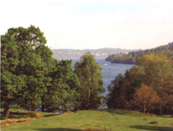
อุทยานแห่งชาติเลคดิสทริก (Lake District National Park)

73 คน และจากสัดส่วนของแต่ละภาค 56 คน (จำนวน 8 ภาคๆ ละ 7 คน) โดยมีวาระ 5 ปี ประธานสภา เรียกว่า Presiding Officer