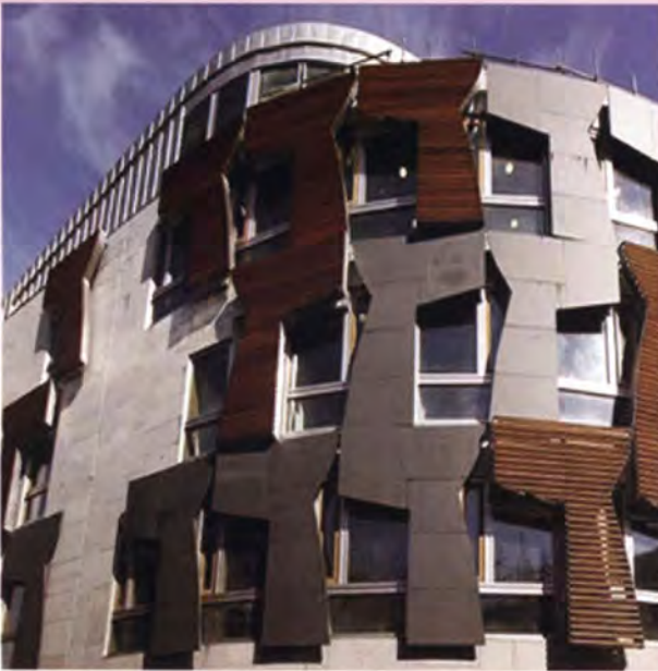
ด้านนอกอาคารสภา