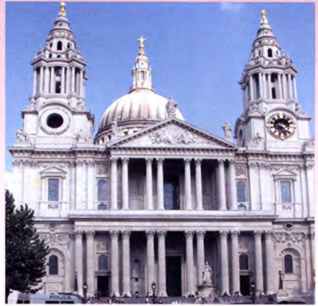
มหาวิหารเซนต์ พอล

เปิดโอกาสให้สมาชิกอภิปรายเกี่ยวกับปัญหาความเดือดร้อนของประชาชนโดยใช้เวลานั้นๆ ตรงประเด็น แต่สมาชิกจะต้องลงทะเบียนขออภิปรายก่อน