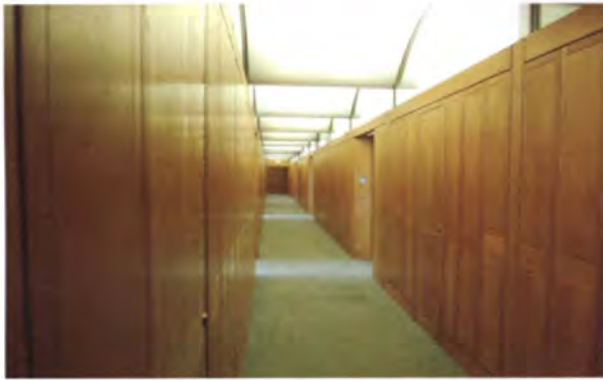
ห้องทำงานของสมาชิกสภาสามัญ