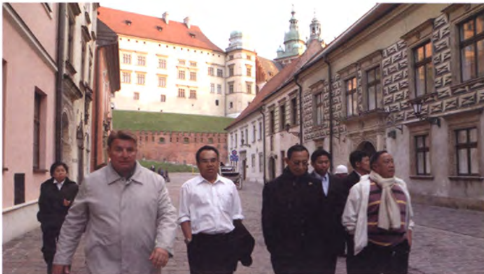
ศึกษาสภาพชีวิตความเป็นอยู่ย่านเมืองเก่ากรุงวอร์ซอ หนึ่งในมรดกโลก

ในเวลา 10.55 นาฬิกาโดยเครื่องบินโดยสารของสายการบินลุฟท์ฮันซา เที่ยวบินที่ LH3312 โดยใช้เวลาบิน 1 ชั่วโมง 30 นาที