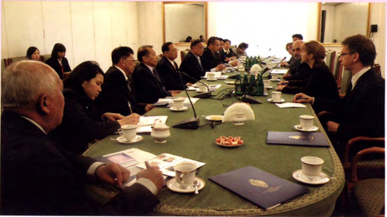
ระหว่างการสนทนาแลกเปลี่ยนกับสมาชิกวุฒิสภาโปแลนด์

ให้การอุดหนุนสำหรับการลงทุนด้านการเกษตรในการซื้อเครื่องมือ/เครื่องจักรทางการเกษตรอีกด้วย ตลอดจนการให้เงินทุนแก่ 'Young Farmer' ซึ่งเป็นผู้เริ่มประกอบอาชีพทางการเกษตร