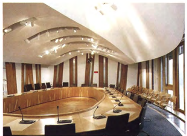
ภายในห้องประชุมกรรมาธิการ