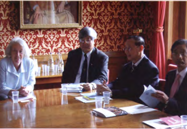
ระหว่างการเยี่ยมคารวะและแลกเปลี่ยน ความคิดเห็นกับประธานสภาขุนนาง