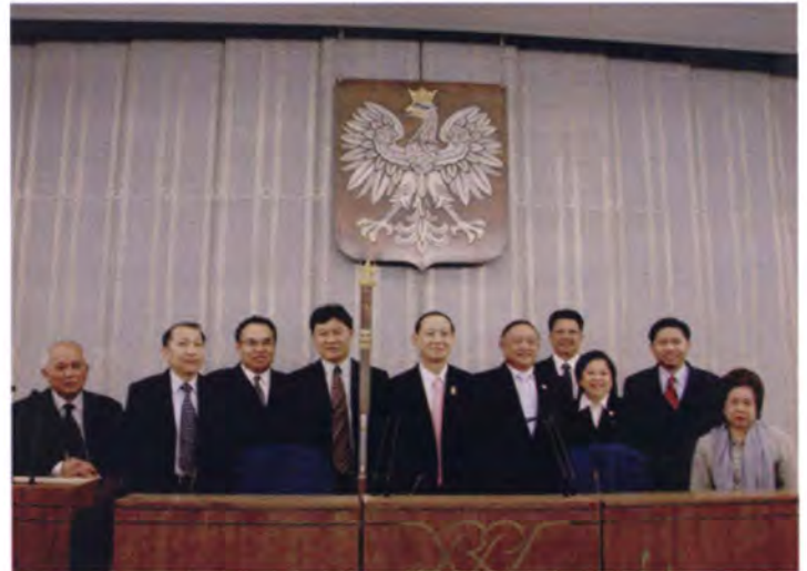
บนบัลลังก์ประธานวุฒิสภาโปแลนด์

บริเวณที่นั่งของสมาชิกวุฒิสภาจะมีป้ายชื่อบอกที่นั่งของแต่ละคน มีการติดตั้งไมโครโฟนช่องเสียบบัตรลงคะแนน และปุ่มกดลงคะแนน โดยระบบการลงคะแนนนั้นใช้อุปกรณ์ของบริษัทฟิลิปส์จากเนเธอร์แลนด์ ส่วนภายนอกห้องประชุมฯ จะมีห้องทำงานของประธานวุฒิสภา และเจ้าหน้าที่ของสำนักงานเลขานุการวุฒิสภา ส่วนอีกฝั่งหนึ่งของห้องประชุมจะมีโถงด้านหน้าจัดวางเก้าอี้ไว้รับรองสมาชิกวุฒิสภาในระหว่างพักการประชุม ทั้งนี้ จะประดับภาพบุคคลที่ดำรงตำแหน่งประธานวุฒิสภาตั้งแต่อดีตจนถึงปัจจุบันบนกำแพงของบริเวณดังกล่าวด้วย