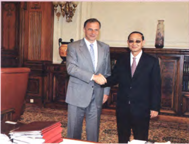
ประธานวุฒิสภาโรมาเนียนำชมห้องทำงาน