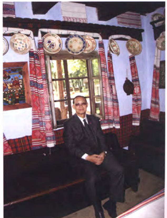
ภายในบ้านของชาวโรมาเนียในอดีต

จากนั้น คณะฯ ได้เยี่ยมชมพิพิธภัณฑ์หมู่บ้าน กลางแจ้ง (Village Museum) ซึ่งมีขนาดถึง