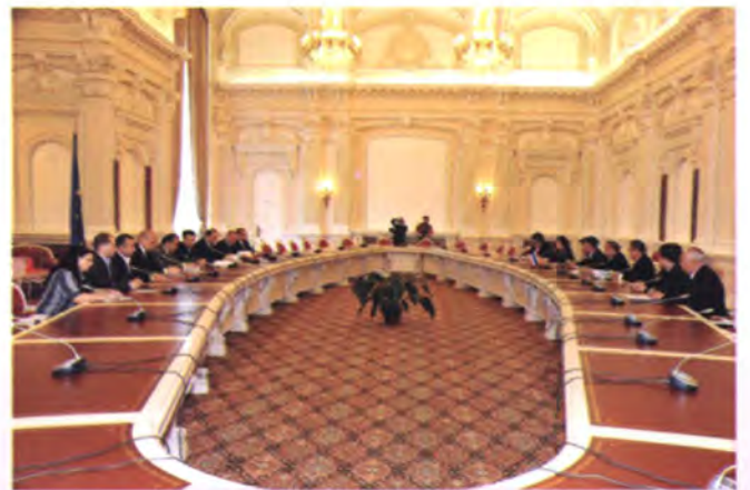
คณะพบปะกลุ่มมิตรภาพสมาชิกรัฐสภาโรมาเนีย-ไทย

อาหาร และบริการ ในฐานะประธานกลุ่มมิตรภาพสมาชิกรัฐสภาโรมาเนีย-ไทย ที่มีอายุเพียง 36 ปี และสมาชิกกลุ่มมิตรภาพโรมาเนีย-ไทยอีกจำนวน 7 คน โอกาสนั้นทั้งสองฝ่ายได้หารือร่วมกันถึงการเพิ่มพูนความสัมพันธ์ระหว่างรัฐสภาของทั้งสองประเทศให้แน่นแฟ้นยิ่งขึ้น อีกทั้งแสดงความประสงค์ที่จะให้รัฐสภาของทั้งสองประเทศทวีความสำคัญโดยผ่านกลไกทางกลุ่มมิตรภาพสมาชิกรัฐสภาของประเทศ ทั้งสองที่ได้จัดขึ้น เพื่อเสริมสร้างความสัมพันธ์และความร่วมมือระหว่างกันมากยิ่งขึ้น เพราะเชื่อมั่นว่าความสัมพันธ์ทางการทูตเชิงรัฐสภาเป็นส่วนหนึ่งของพัฒนาการความสัมพันธ์ระหว่างประเทศทั้งสองต่อไป ในอนาคต รัฐสภาไทยจัดตั้งกลุ่มมิตรภาพสมาชิกรัฐสภาไทย-โรมาเนียขึ้นในสมัยนายมารุต บุนนาค ประธานรัฐสภาในขณะนั้น ในรัฐสภาชุดปัจจุบันมีสมาชิกรัฐสภาสมัครสมาชิกกลุ่มมิตรภาพฯ รวมจำนวน 13 คน เป็นสมาชิกวุฒิสภา 3 คน และสมาชิกสภาผู้แทนราษฎร 10 คน ซึ่งได้มีการประชุมใหญ่เพื่อเลือกตั้งคณะกรรมการบริหารกลุ่มเมื่อวันที่ 27 มกราคม 2552 โดยมีพลเอกเกษมศักดิ์ ปลุกสวัสดิ์ ได้รับเลือกตั้งให้ดำรงตำแหน่ง