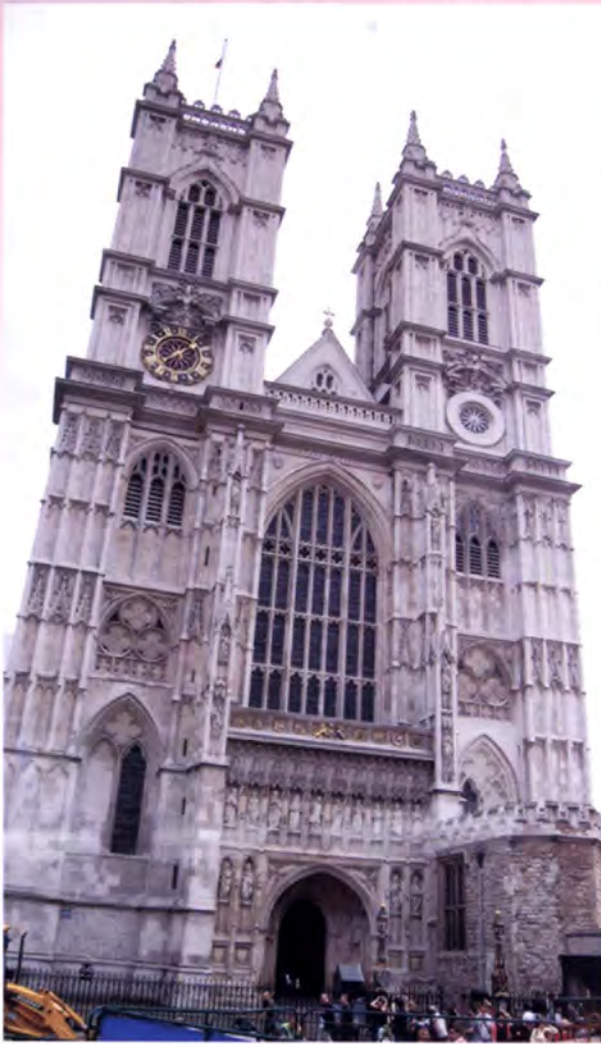
โบสถ์เวสต์มินสเตอร์

มีอำนาจเต็มในการพิจารณาข้อคำถามของสมาชิก ที่จะบรรจุในวาระการถาม (Question Time)