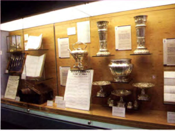
ภายในพิพิธภัณฑ์กีฬาอล์ฟ