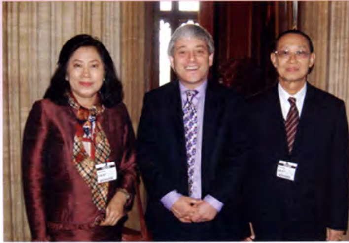
เยี่ยมคารวะประธานสภาสามัญ