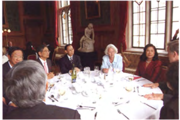
ประธานสภาขุนนางเป็นเจ้าภาพเลี้ยงอาหารกลางวัน