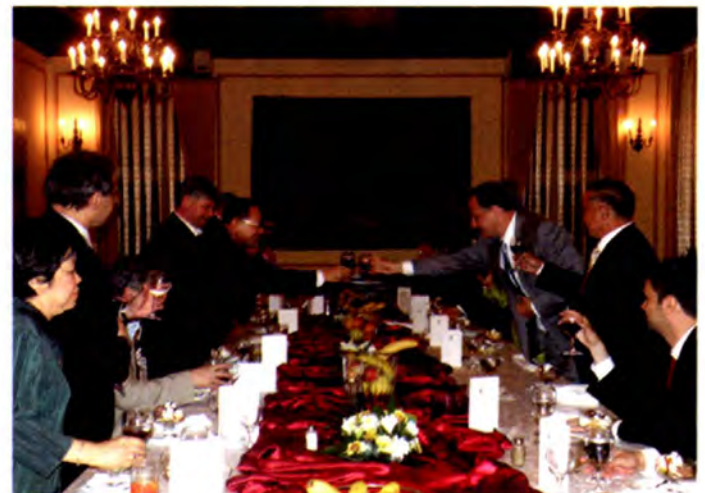
ทั้งสองฝ่ายร่วมดื่มอวยพรเพื่อกระชับความสัมพันธ์ระหว่างไทยและโรมาเนีย