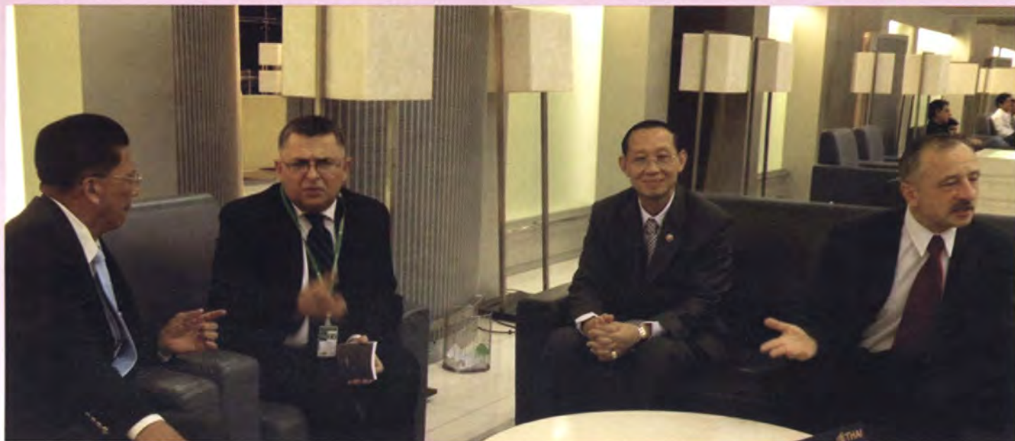
อุปทูตสาธารณรัฐโปแลนด์และอุปทูตโรมาเนียรอส่งคณะเดินทาง