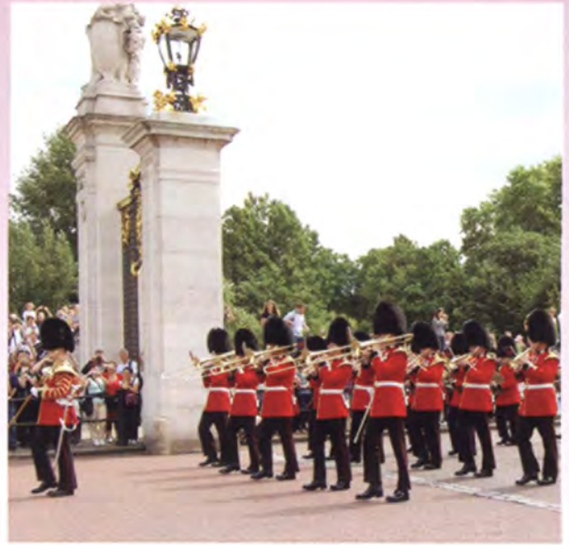
การเปลี่ยนเวรของทหารรักษาพระองค์