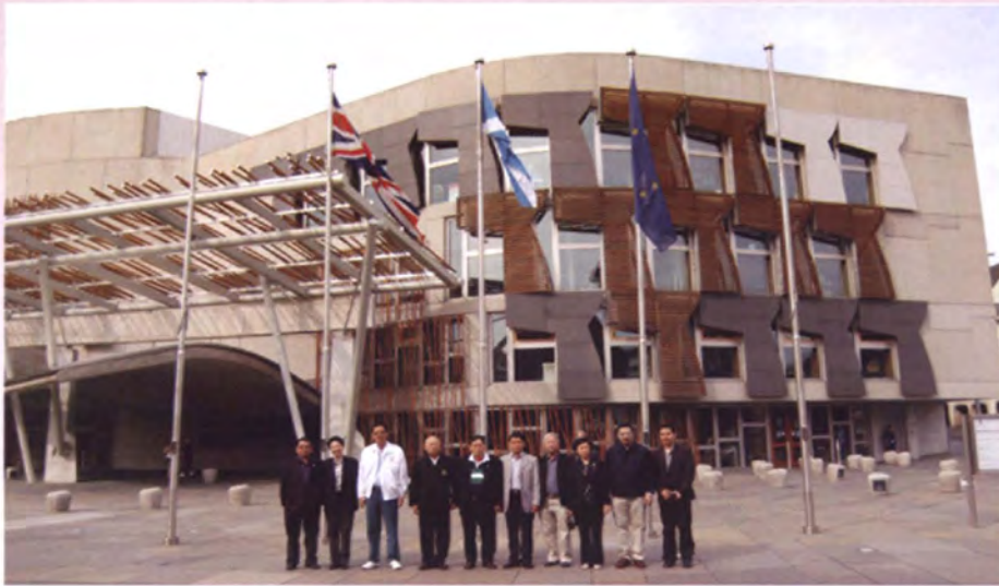
ถ่ายภาพร่วมกันหน้าอาคารสภาสกอตแลนด์