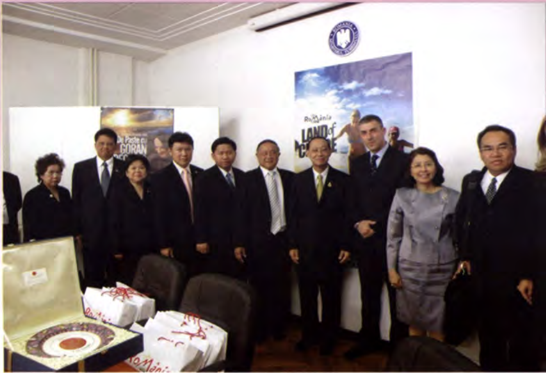
คณะถ่ายภาพร่วมกับรัฐมนตรีช่วยว่าการกระทรวงการท่องเที่ยว

30 เอเคอร์ซึ่งถือเป็นพิพิธภัณฑสถานกลางแจ้งที่ใหญ่และเก่าที่สุดในภูมิภาคยุโรป โดยนำบ้านของชาวโรมาเนียในเมืองต่าง ๆ ทั่วประเทศจำนวนกว่า 50 หลัง รวมทั้งโบสถ์ กังหันน้ำ และเฟิงเก็บฟางมารวบรวมไว้คณะผู้เข้าชมได้สัมผัสสภาพชีวิตความเป็นอยู่และสถาปัตยกรรมของชาวโรมาเนียตั้งแต่ในอดีตจนถึงปัจจุบัน โดยสามารถเข้าชมภายในบ้านแต่ละหลังได้อย่างใกล้ชิด ซึ่งภายในบ้านนั้นมีการจำลองข้าวของเครื่องใช้ เครื่องแต่งกาย และวิถีชีวิตของชาวโรมาเนียไว้อย่างดี อนึ่ง พิพิธภัณฑสถานี้ยังเป็นสถานที่ไว้จัดงานสำคัญต่าง ๆ อาทิ เทศกาลช่างฝีมือ ซึ่งโรมาเนียนิยมเครื่องปั้นดินเผาหลากหลายและพรมทอหลากสีสັນไว้ประดับฝาผนังของบ้าน