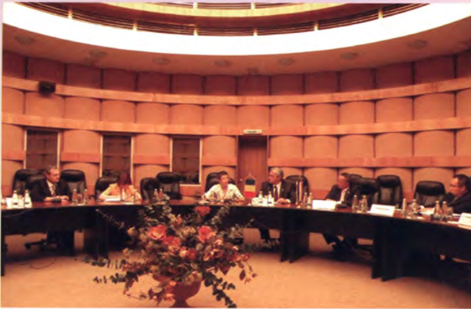
ระหว่างการหารือ แลกเปลี่ยนข้อคิดเห็น ร่วมกันกับหอการค้า โรมาเนีย

ร้อยละ 18.1 เป็นต้น อุตสาหกรรมยานยนต์ เป็นอีกหนึ่งอุตสาหกรรมที่สำคัญของโรมาเนีย เนื่องจากปัจจุบันมีผู้ผลิตชิ้นส่วนยานยนต์ กว่า 175 ราย แรงงานกว่า 120,000 คน มีมหาวิทยาลัยผลิตนักศึกษาสาขาเทคโนโลยี ยานยนต์กว่า 500 คนต่อปี และสาขา วิศวกรรมเครื่องกลกว่า 1,000 คนต่อปี และมีศูนย์การพัฒนาและวิจัยหลายแห่ง นอกจากนี้ อุตสาหกรรมเทคโนโลยีสารสนเทศ กำลังมีแนวโน้มที่จะมีความสำคัญโดดเด่น ขึ้นมา โรมาเนียมีรายได้จากอุตสาหกรรม IT ในปี 2550 ถึง 1.22 พันล้าน ยูโรหรือ คิดเป็นร้อยละ 8 ของรายได้ทั้งหมด มีแรงงาน ด้าน IT 134,000 คน และมีพนักงานด้าน ซอฟต์แวร์ 16,000 คน นักศึกษาสำเร็จ การศึกษาด้าน IT 8,000 คนต่อปี และคาดว่า จะเพิ่มขึ้นอีกในอนาคต นอกจากนี้ บริษัท IT ขนาดใหญ่ของโลกได้มาลงทุน และใช้ โรมาเนียเป็นสำนักงานระดับภูมิภาค อาทิ Microsoft, IBM, HP, Oracle, Cisco, Intel, Adobe, Amazon เป็นต้น