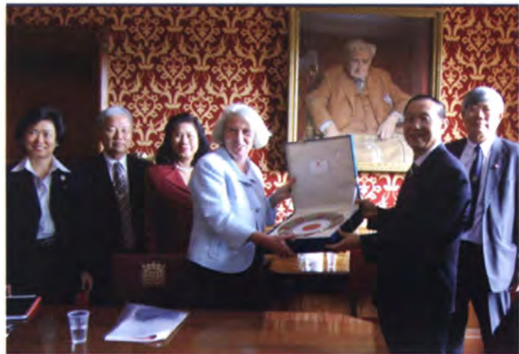
มอบของที่ระลึกให้แก่ประธานสภาขุนนาง

เวลา 12.30 นาฬิกา ประธานวุฒิสภาและคณะฯ ได้เข้าเยี่ยมคารวะและสนทนาแลกเปลี่ยนความคิดเห็นกับบารอนเนส เฮย์แมน (the Right Honorable Baroness Hayman) ประธานสภาขุนนาง (House of Lords)