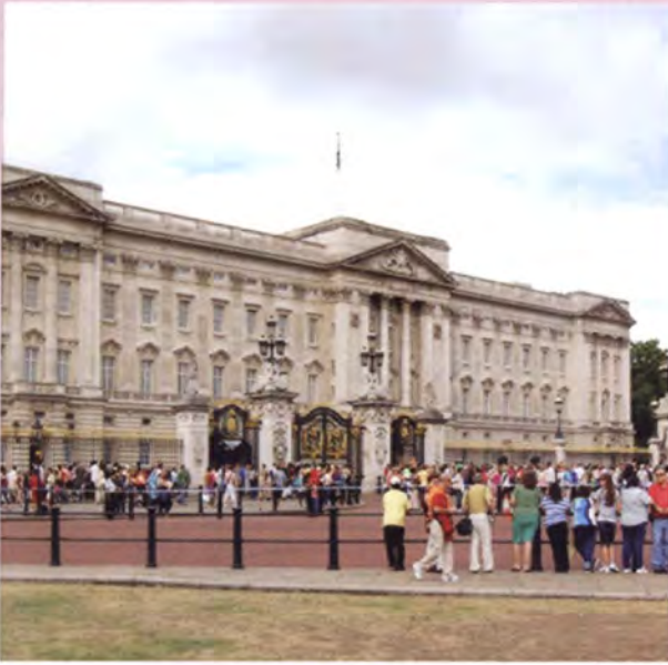
พระราชวังบักกิงแฮม