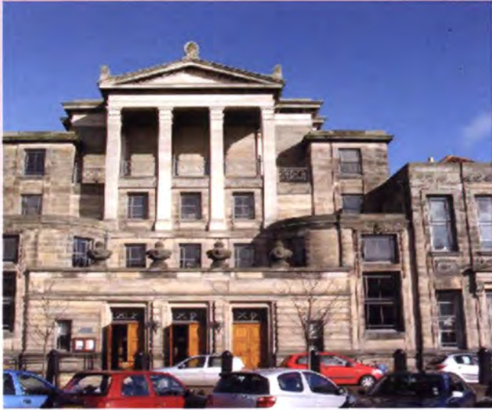
มหาวิทยาลัยเซนต์ แอนดรูส์