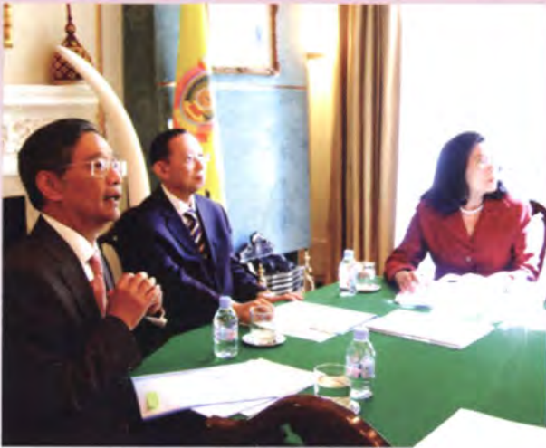
รับฟังบรรยายสรุปจากเอกอัครราชทูตฯ