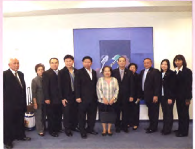
คณะถ่ายภาพร่วมกับเอกอัครราชทูต ณ กรุงเอเธนส์ ก่อนเดินทางกลับประเทศไทย

ทั่วโลกก็คือปราสาทแดร์ริคคูล่า ซึ่งแท้จริงแล้ว เคาท์แดร์ริคคูล่าหรือผีดูดเลือดเป็นเพียงผลงานทางจินตนาการของนักเขียนบราม สโตเกอร์ ชาวไอริชเท่านั้น นอกจากนี้ ปราสาทโบราณยังเป็นที่พักของพระราชินี มาเรีย พระมเหสีกษัตริย์เฟอร์ดินานด์แห่งโรมาเนีย อีกด้วย ภายในปราสาทที่สร้างด้วยศิลปะแบบโกธิค ประกอบไปด้วยห้องที่เรียงราย สลับซับซ้อนมากมายที่ตกแต่งด้วยสมบัติล้ำค่า จากสมัยพระราชินี มาเรีย อาทิ ห้องนอน ห้องทำงาน ห้องฟังดนตรี และคุกที่ขังนักโทษ เนื่องจากช่วงสมัยหนึ่งผู้ครองปราสาทโบราณคือท่านเคาท์ซึ่งมีนิสัยโหดเหี้ยมทารุณ ชอบทรมานนักโทษด้วยวิธีพิสดารต่าง ๆ แล้วก็นำที่ทิ้งด้วยการใช้ดาบแทงทะลุอกทุกคน ผู้คนจึงเรียกเจ้าชายองค์นี้ว่าเคาน์แดร์ริคคูล่า ซึ่งให้ความหมายในทำนองโหดเหี้ยม