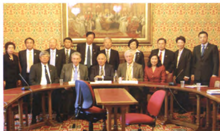
คณะพบหารือ และแลกเปลี่ยนความคิดเห็น กับสมาชิกสภาขุนนาง

ก็นั่งลง แล้วคนต่อไปก็ลุกขึ้นตั้งคำถามต่อไป มีการรักษาเวลาเป็นอย่างดี ทำให้ประธานในที่ประชุมปฏิบัติหน้าที่ได้โดยง่าย