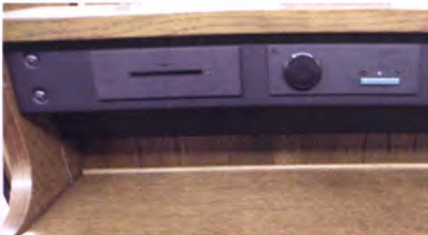
ช่องเสียบบัตรและปุ่มกดลงคะแนนที่นั่งของสมาชิกวุฒิสภา

สมาชิกวุฒิสภาผู้ซึ่งเสียชีวิตระหว่างสงครามโลกภายในห้องประชุมวุฒิสภามีพื้นที่ประมาณ 220 ตารางเมตร ที่มีพื้นที่จำกัดมากเนื่องจากในอดีตได้เคยมีการยกเลิกวุฒิสภาไป ดังนั้นเมื่อริเริ่มให้มีวุฒิสภาอีกครั้งจึงมีพื้นที่เพียงห้องประชุมเล็ก ๆ จำนวน 3 ห้องที่ขยายทะลุถึงกันเป็นห้องประชุมวุฒิสภาในปัจจุบัน อย่างไรก็ตามได้มีการปรับปรุงตกแต่งภายในห้องประชุมเสียใหม่เพื่อให้เกิดประโยชน์ใช้สอยได้อย่างเต็มที่ แต่กระนั้นก็ถือเป็นห้องประชุมสภาที่เล็กที่สุดในยุโรป บนบัลลังก์ของประธานวุฒิสภาจะประดับธงประจำชาติโปแลนด์ ซึ่งมีแถบสีแดงและขาว สีแดงหมายถึงโลหิตของชาวโปแลนด์ในการได้มาซึ่งอิสรภาพและสีขาวหมายถึงนกอินทรี สีขาวซึ่งเป็นสัตว์สัญลักษณ์ของโปแลนด์ มีคทาขนาดใหญ่สีทองทางฝั่งขวาของประธานวุฒิสภา และ