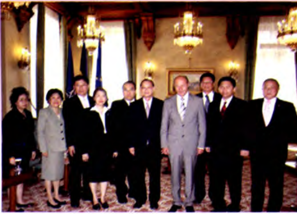
คณะถ่ายภาพร่วมกับประธานาธิบดีโรมาเนีย