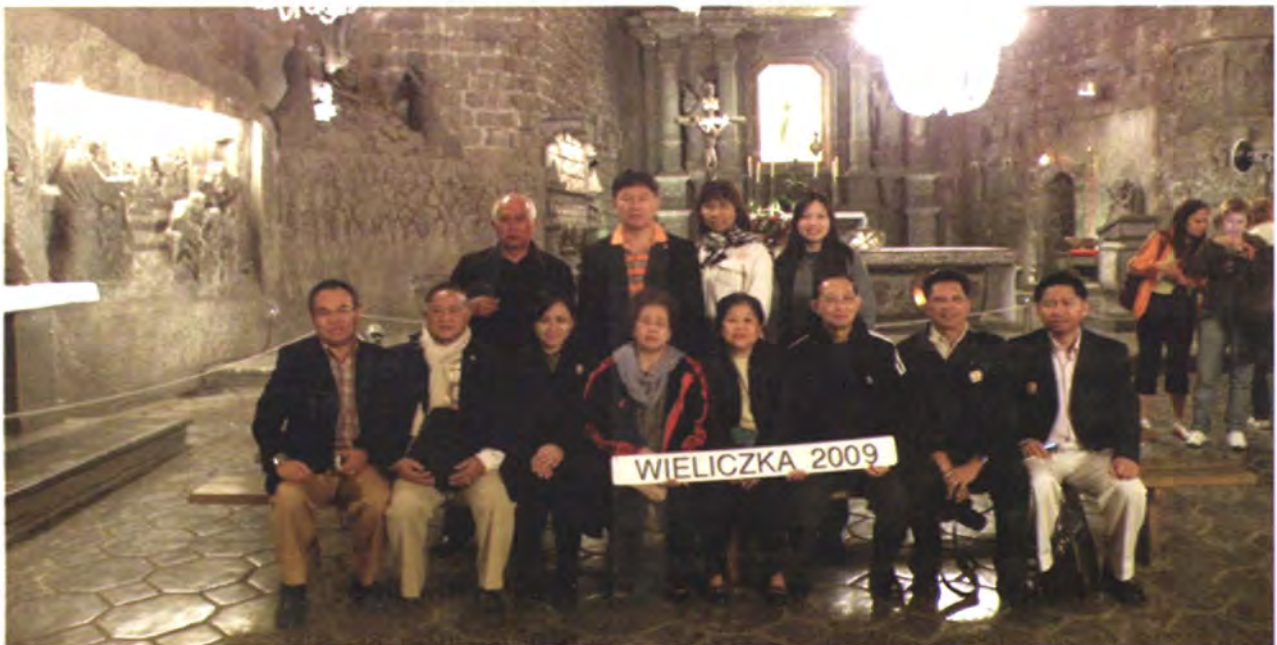
คณะถ่ายรูปร่วมกันภายในห้องโถงใหญ่ของเหมืองเกลือวิลิชกา

และในค่ำวันเดียวกันนี้ คณะฯ ได้เข้าร่วมงานเลี้ยงอาหารค่ำที่ นายรัฐกร พาณิช เอกอัครราชทูต ณ กรุงวอร์ซอ เป็นเจ้าภาพ ณ ทำเนียบเอกอัครราชทูต ซึ่งเอกอัครราชทูตฯ ได้สรุปสถานการณ์ปัจจุบันของสาธารณรัฐโปแลนด์และความสัมพันธ์ระหว่างไทย-สาธารณรัฐโปแลนด์ ดังนี้ สาธารณรัฐโปแลนด์ตั้งอยู่ใจกลางทวีปยุโรป มีพรมแดนติด 7 ประเทศ ได้แก่ รัสเซีย ลิทัวเนีย เบลารุส ยูเครน เช็ก สโลวัก และเยอรมนี ภูมิประเทศเป็นพื้นที่ราบเกือบทั้งประเทศ มีพื้นที่ประมาณ 312,685 ตารางกิโลเมตร มีขนาดใหญ่เป็นอันดับ 8 ของทวีป