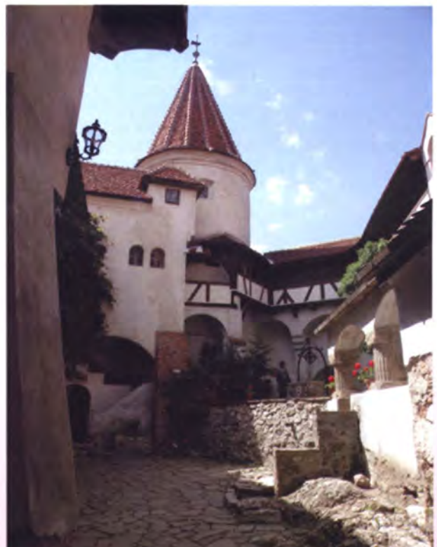
ปราสาทบรานหรือที่รู้จักกันในนามปราสาทแดรกคิว