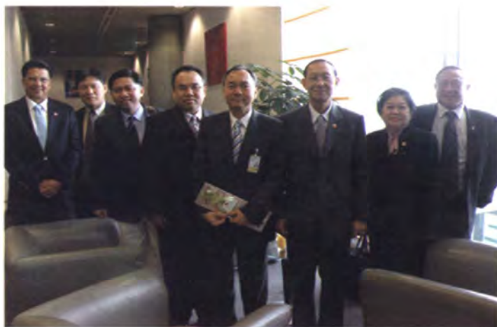
เอกอัครราชทูต ณ กรุงเบอร์ลิน รอต้อนรับคณะฯ ณ สนามบินนครมิวนิค

เยอรมนี เวลา 07.15 นาฬิกา ณ ที่นั้น นายจริยวัฒน์ สันตะบุตร เอกอัครราชทูต ณ กรุงเบอร์ลิน และเจ้าหน้าที่ของสถานเอกอัครราชทูตฯ ซึ่งอยู่ระหว่างการปฏิบัติราชการ ณ นครมิวนิค ได้มารอต้อนรับคณะฯ และพบปะสนทนากับคณะฯ ระหว่างรอเปลี่ยนเครื่องบิน