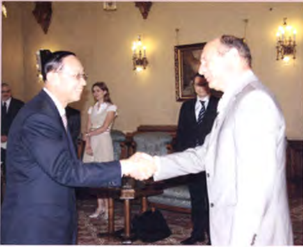
ประธานวุฒิสภานำคณะเข้าเยี่ยมคารวะประธานาธิบดี โรมาเนีย ณ ทำเนียบประธานาธิบดี