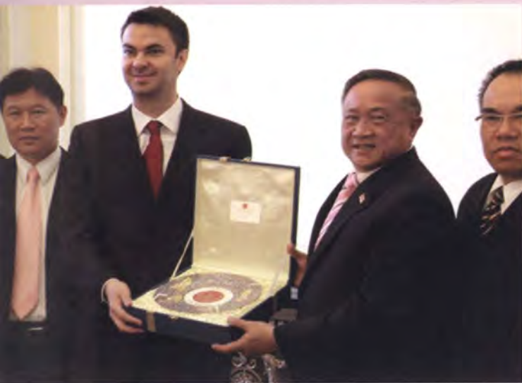
ประธานกลุ่มมิตรภาพสมาชิกรัฐสภาไทย-โรมาเนีย มอบของที่ระลึกประธานกลุ่มมิตรภาพสมาชิกรัฐสภา โรมาเนีย-ไทย