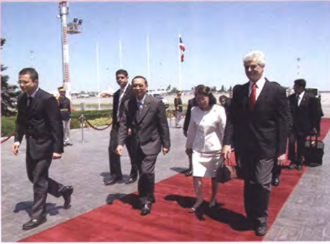
เอกอัครราชทูต ณ กรุงบูคาเรสต์และเจ้าหน้าที่ระดับสูงของวุฒิสภาโรมาเนียนำคณะจากเครื่องบินเข้าสู่ห้องรับรองฯ