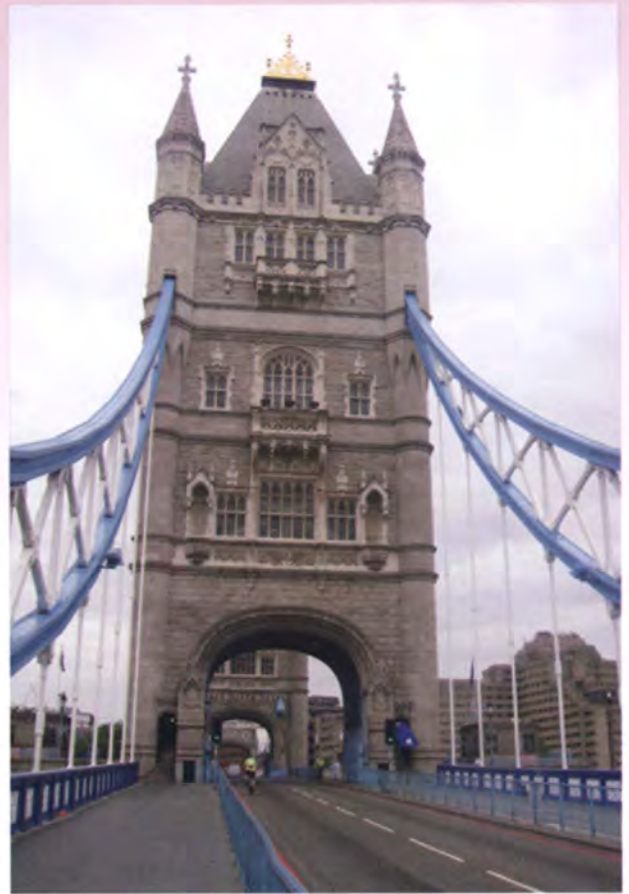
สะพานทาวเวอร์บริดจ์