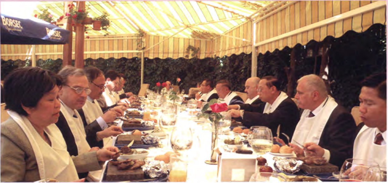
รองประธานวุฒิสภาโรมาเนียเป็นเจ้าภาพอาหารกลางวันเพื่อเป็นเกียรติแก่คณะฯ