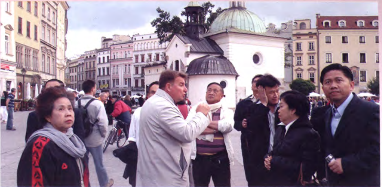
ศึกษาสภาพชีวิตความเป็นอยู่ของเมืองเก่าคราคูฟ

บรรยากาศเมืองเก่าของยุโรปที่สวยงามเป็นอย่างยิ่ง องค์การ UNESCO ได้ประกาศให้เมืองคราคูฟเป็นเมืองมรดกโลก สามารถดึงดูดนักท่องเที่ยวเดินทางมาปีละประมาณ 7 ล้านคน นอกจากนี้ ยังได้เยี่ยมชมบริเวณตัวเมืองเก่าและสภาพความเป็นอยู่ของชาวเมืองคราคูฟก่อนจะเข้าพัก ณ โรงแรม Pod Roza