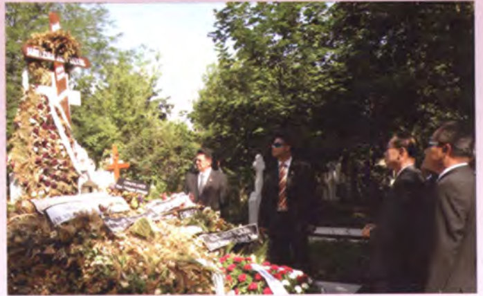
ประธานวุฒิสภาวางพวงหรีด ณ สุสานอดีตเอกอัครราชทูต โรมาเนียประจำประเทศไทย