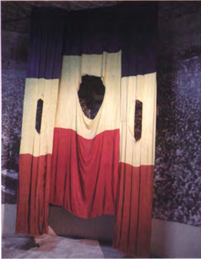
ธงชาติแห่งความทรงจำจากการล้มล้างระบบคอมมิวนิสต์ในโรมาเนีย