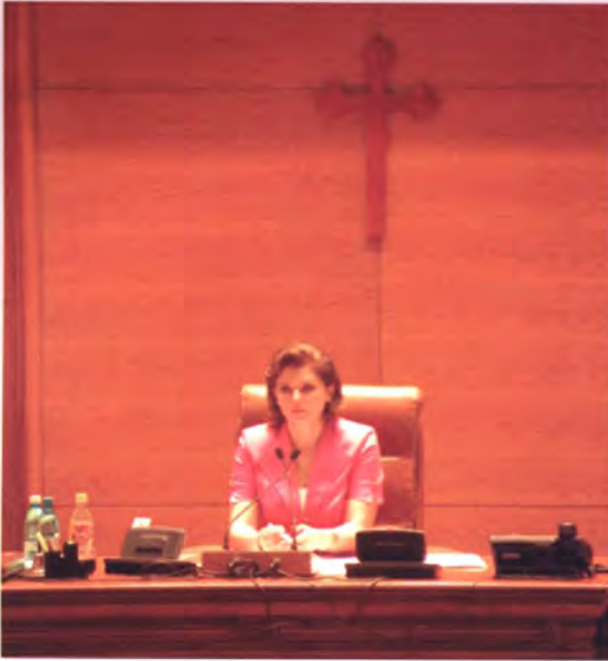
ประธานสภาผู้แทนราษฎรโรมาเนีย ขณะกำลังปฏิบัติหน้าที่

ที่มีความสวยงาม ตลอดจนมีเศรษฐกิจ สังคม และความมั่นคงสูง จึงรู้สึกยินดีที่ได้มีโอกาสต้อนรับคณะจากประเทศไทยเป็นอย่างยิ่ง ทั้งนี้ กล่าวเรียนเชิญประธานวุฒิสภาไทยและคณะฯ ร่วมงานเลี้ยงอาหารค่ำที่ประธานวุฒิสภาโรมาเนียจะเป็นเจ้าภาพเพื่อเป็นเกียรติแก่ประธานวุฒิสภาไทยและคณะฯ ด้วย จากนั้น ประธานวุฒิสภาของทั้งสองประเทศได้