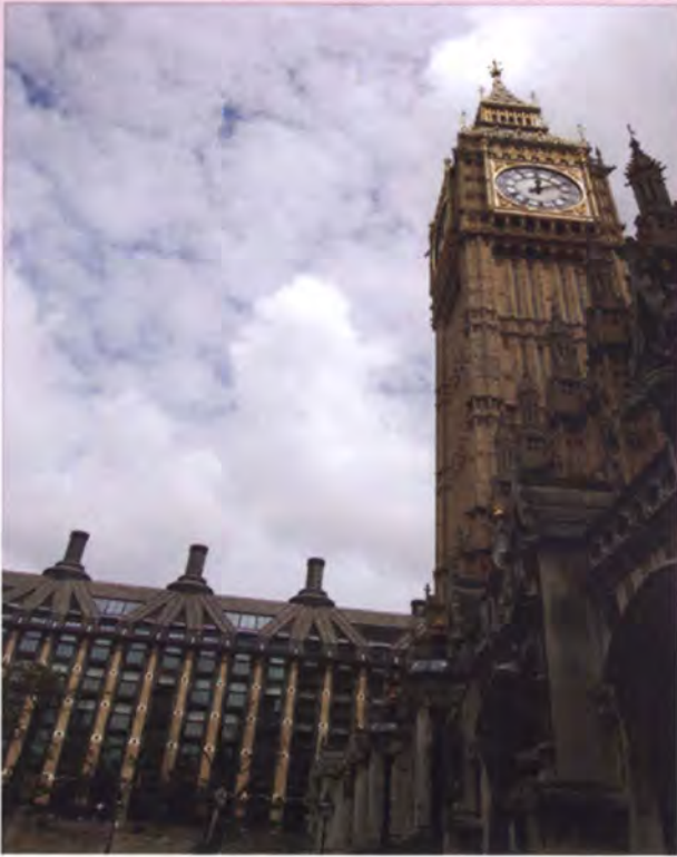
อาคาร Portcullis House