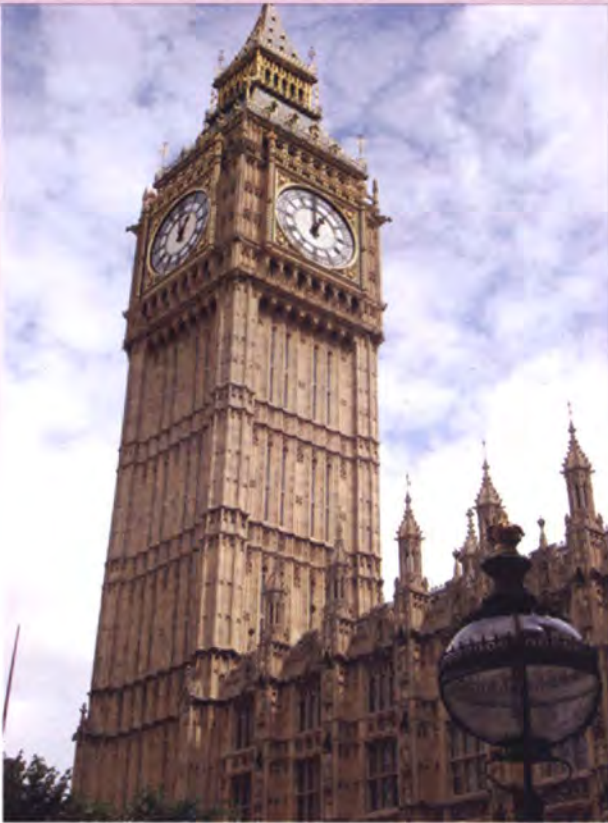
หอนาฬิกาบิ๊กเบน

ใน ส่วน ความ สัม พัน ธ์ ไทย และ สห รา ช อาณา จักร ราช นั้น มี ความ สัม พัน ธ์ กัน มา ช้านาน มีการ สถาปนา ความ สัม พัน ธ์ ทาง การ ทูต อย่าง เป็น ทาง การ เมื่อ วัน ที่ 18 เม ษา ยน พ.ศ. 2398 (ค.ศ. 1855) ความ สัม พัน ธ์ ของ ทั้ง สอง ประเทศ มี ขึ้น ทั้ง ใน กรอบ ความ ร่วม มือ ทวิ ภา คี และ พหุ ภา คี รวมทั้ง ขยาย ตัว ครอบ คลุม ทุก สาขา ของ ความ ร่วม มือ ถึง แม้ ว่า ไทย และ สห รา ช อาณา จักร ราช จะ มี ได้ จัด ตั้ง คณะ กรรมา ธิ การ ร่วม หรือ คณะ กรรมา การ กำกับ ดู แล ความ สัม พัน ธ์ ทวิ ภา คี ดัง เช่น ที่ ประเทศ ไทย มี กับ ประเทศ สำคัญ อื่น ๆ ใน ยุโรป แต่ ทั้ง สอง ฝ่าย ต่าง เห็น พ้อง ต้อง กัน ว่า ความ สัม พัน ธ์ ทวิ ภา คี ไทย สห รา ช อาณา จักร ราช นั้น ได้ หยั่ง ราก ลึก ครอบ คลุม ทุก สาขา แล้ว ทั้ง ใน ระดับ สถา บัน-สถา บัน เอก ชน-เอก ชน และ ประชา ชน-ประชา ชน ซึ่ง ใน ระดับ สถา บัน นั้น เป็น ที่ นำ ยิน ดี ว่า ปี พ.ศ. 2553 (ค.ศ. 2010)