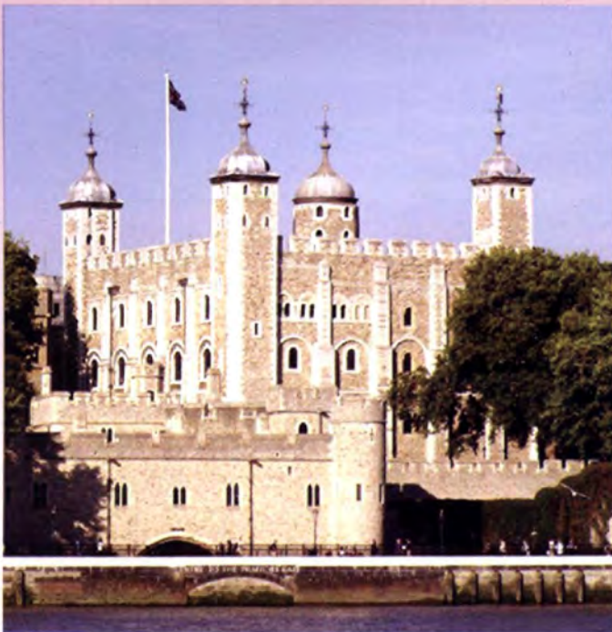
หอคอยแห่งลอนดอน