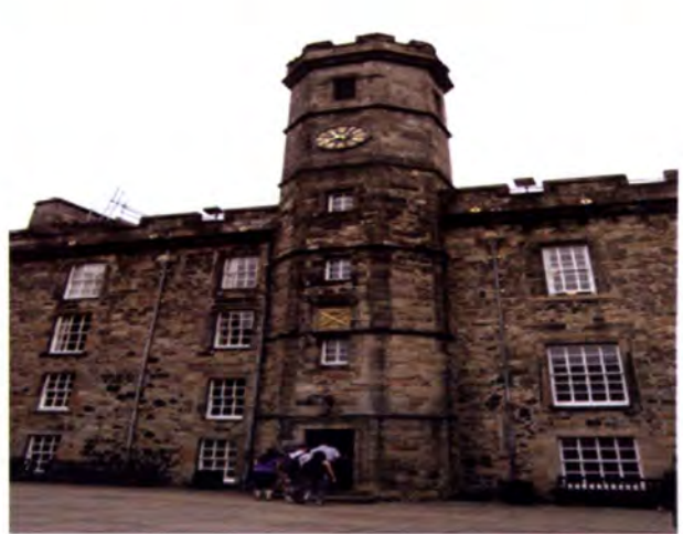
ปราสาทเอดินบะระ (Edinburgh Castle)

ภายในปราสาทมีห้องแสดงศาสตราวุธ ห้องแสดงเหตุการณ์นับตั้งแต่การขึ้นครองราชย์ของปฐมกษัตริย์ ตลอดไปจนถึงห้องแสดงเครื่องราชกกุธภัณฑ์ที่ล้ำค่าและเป็นที่ยกย่องของชาวสกอต อาทิ สกอตทิช คราวน์ จูเวลส์ (Scottish Crown Jewels) และสโตน ออฟ เดสทินี (Stone of Destiny) เป็นต้น