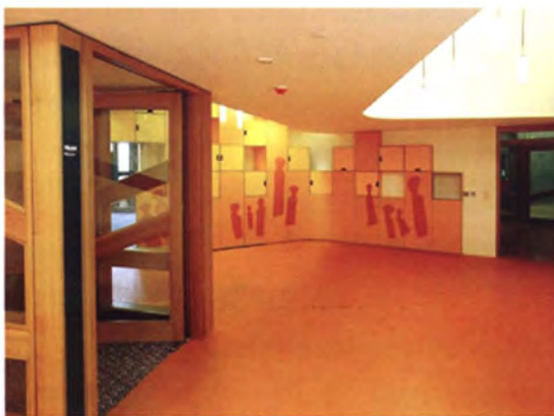
ภายในอาคารสภา