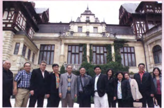
คณะถ่ายภาพร่วมกันหน้าปราสาทเปเลส

ในช่วงเช้าคณะฯได้ออกเดินทางออกจาก กรุงบูคาเรสต์ไปยังเมืองซินาย่า (Sinaia) ซึ่งอยู่ห่างออกไปประมาณ 120 กิโลเมตร หรือใช้เวลาเดินทางประมาณ 2 ชั่วโมง เพื่อเยี่ยมชมปราสาทเปเลส (Peles Castle) ซึ่งตั้งอยู่ในหุบเขาบูเซกิ ปราสาทแห่งนี้ได้รับการยกย่องว่าเป็นปราสาทอีกแห่งหนึ่งที่สวยที่สุดในโลก เนื่องจากอยู่กลางป่าสนบน เทือกเขาคาร์เปเทียน ถือเป็นอัญมณีแห่ง เทือกเขาคาร์ปาเทียนอันงดงาม และเป็นสุดยอด งานศิลปะไม้แกะสลักที่ไม่เหมือนที่ใดในโลก พระราชวังแห่งนี้สร้างบนเนื้อที่ 200 ไร่ แรกสร้างเพื่อเป็นที่ประทับในการพักผ่อน และล่าสัตว์ในฤดูร้อน ต่อมาใช้เป็นที่ประทับ ส่วนพระองค์ของกษัตริย์โรมาเนียหลาย พระองค์ และพระราชวังมีห้องต่าง ๆ อาทิ