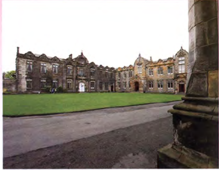
ภายในมหาวิทยาลัยเซนต์ แอนดรูส์