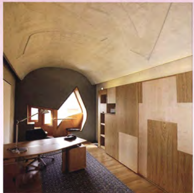
ห้องทำงานของสมาชิกสภา