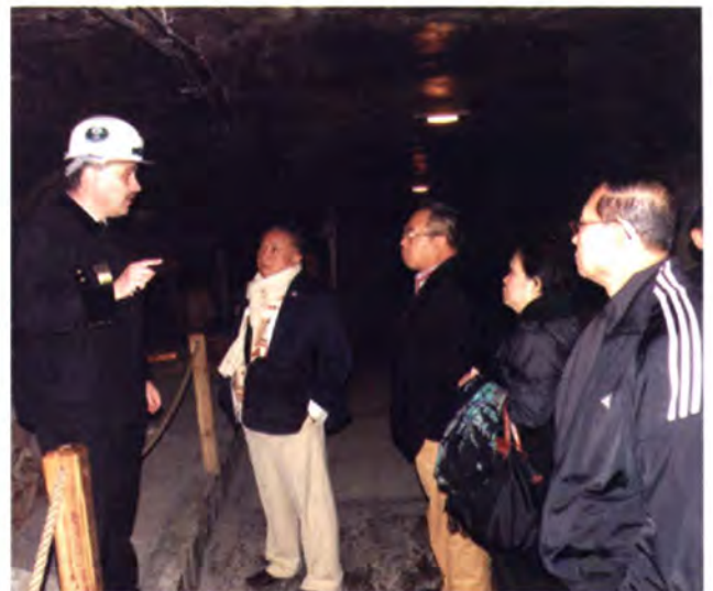
คณะรับฟังการบรรยายสรุปเกี่ยวกับประวัติความเป็นมาและโครงสร้างของเหมือง

เวลา 10.00 นาฬิกา คณะฯ ได้เข้าเยี่ยมชมเหมืองเกลือวีลิชสกา (Wieliczka Salt Mine) ซึ่งเป็นเหมืองเกลือที่ผลิตเกลือตั้งแต่สมัยศตวรรษที่ 13 เคยทำรายได้มหาศาลให้แก่ผู้ครองนคร Krakow มาแต่โบราณกาล แม้กระทั่งมหาวิทยาลัย Jagiellonian University ซึ่งเป็นมหาวิทยาลัยของเมืองคราคูฟก็จัดตั้งขึ้นได้เพราะเงินรายได้จากเกลือที่เหมืองนี้ เหมืองเกลือแห่งนี้นับเป็นจุดดึงดูดนักท่องเที่ยวที่สำคัญที่สุดของโปแลนด์และยูเนสโกประกาศให้เป็นมรดกโลกด้วย มีผู้มาเยี่ยมชมจากทั่วทุกมุมโลกปีละมากกว่าล้านคน ในช่วงต้นศตวรรษที่ 19 แพทย์โปแลนด์