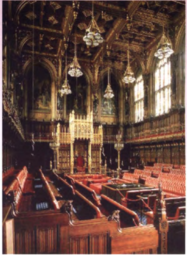
ห้องประชุมสภาขุนนาง