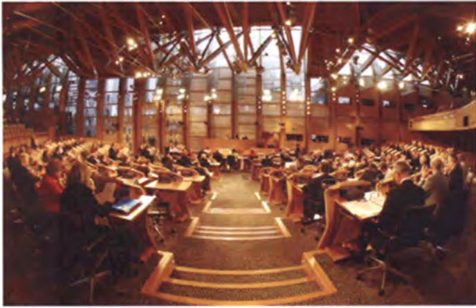
บรรยากาศระหว่างการประชุมสภาสกอตแลนด์

สกอตแลนด์หรือที่เรียกกันว่า“สภาสกอต (Scottish Parliament)” นั้น ได้เริ่มก่อตัวขึ้น นับตั้งแต่ปี ค.ศ. 1603 ต่อมาเมื่อปี ค.ศ.1979 ได้มีการลงมติในแคว้นสกอตแลนด์เพื่อจัดตั้ง สภาของตนเองแต่ไม่ประสบผลสำเร็จ อย่างไรก็ตาม ความพยายามในการผลักดันให้มีสภา เป็นของตนเองยังคงมีอยู่อย่างต่อเนื่องตลอด ระยะเวลาที่ผ่านมา ต่อมาเมื่อเดือนกันยายน ค.ศ. 1997 รัฐบาลของสหราชอาณาจักร ภายใต้การบริหารงานของนายโทนี่ แบลร์ นายกรัฐมนตรีแห่งสหราชอาณาจักร ในขณะ นั้น ได้จัดให้มีการลงมติในแคว้นสกอตแลนด์ อีกครั้งหนึ่ง เพื่อเป็นการกระจายอำนาจการ