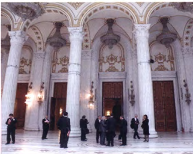
ภายในห้องโถงใหญ่ของอาคารรัฐสภาโรมาเนีย

ศิลปะแบบไบเซนไทน์ รอคโคโคและบารอค โดยใช้วัสดุภายในประเทศแทบทั้งสิ้น อาทิ หินอ่อนกว่า 1 ล้านคิวบิกเมตรจากทรานซิลวาเนีย คริสตัลกว่า 3,500 ตันจากรุสซิดา ทั้งนี้ ภายในอาคารประดับด้วยโคมไฟระย้าคริสตัล เกือบ 500 ชิ้น โดยแต่ละชิ้นก็มีขนาดใหญ่ และประกอบด้วยคริสตัลและดวงไฟหลายพันดวง พรหมขนสัตว์หลายพันตารางเมตรซึ่งได้นำ เครื่องทอมาทอพรหมดังกล่าวในอาคารนี้ด้วย