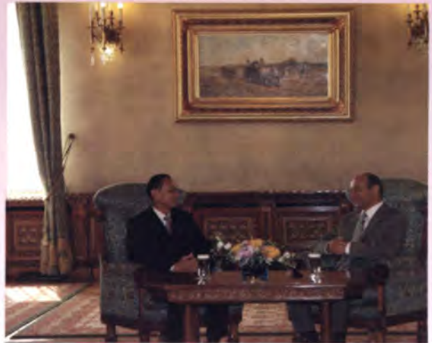
ระหว่างการหารือข้อราชการระหว่างประธานวุฒิสภาไทย และประธานาธิบดีโรมาเนีย

คณะวิชาการเดินเรือจากสถาบันการเดินเรือ และหลักสูตรการจัดการอุตสาหกรรมการ ขนส่งทางทะเลจากสถาบันนอร์เวย์ ได้รับ การเลือกตั้งเป็นสมาชิกสภาผู้แทนราษฎร สังกัดพรรค Democratic Party (PD) ในปี พ.ศ. 2535 และดำรงตำแหน่งรองประธาน คณะกรรมการการอุตสาหกรรมและบริการ และผู้ว่าการกรุงบูคาเรสต์ ก่อนที่จะเข้ารับ ตำแหน่งประธานาธิบดีเมื่อวันที่ 18 ธันวาคม 2547