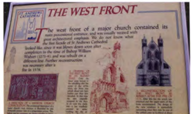
มหาวิหารเซนต์ แอนดรูส์

ของสกอตแลนด์ กรุงเอดิเนบอร์เป็นศูนย์กลางที่ทันสมัยและรุ่งเรืองทางศิลปะและวัฒนธรรม มีพิพิธภัณฑ์ หอศิลป์ และมหาวิทยาลัยที่สำคัญ โดยในช่วงเดือนสิงหาคมจะมีการจัดเทศกาลประจำปี และมีการสวนสนามของกองทัพที่เรียกว่า มิลิทารี แทตทู (Edinburgh Military Tattoo) ซึ่งในปี ค.ศ. 2009 นี้ จะเป็นการจัดงานที่ยิ่งใหญ่เป็นพิเศษเนื่องจากการครบรอบ 60 ปี ของการจัดงานประจำปีดังกล่าว