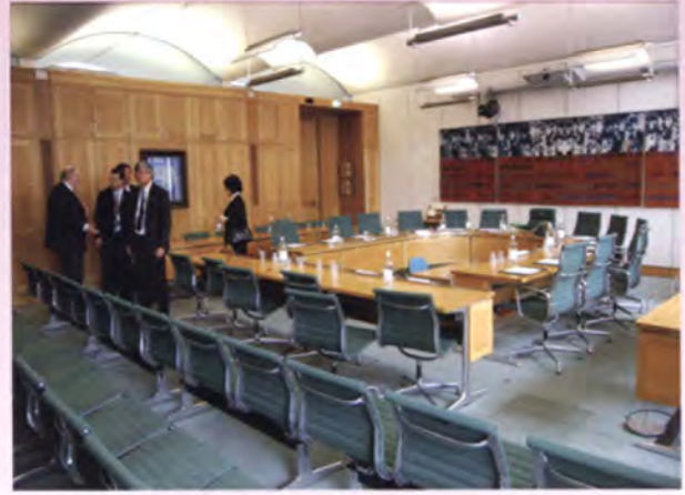
ห้องประชุมกรรมาธิการ