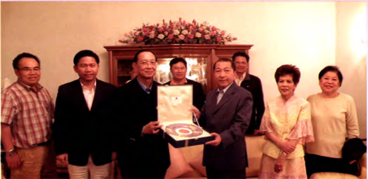
ประธานวุฒิสภามอบของที่ระลึกให้แก่เอกอัครราชทูต ณ กรุงวอร์ซอ หลังงานเลี้ยงอาหารค่ำ

(ในขณะนั้นโปแลนด์ถือว่าเป็นส่วนหนึ่งของรัสเซีย) และได้ประทับอยู่ที่กรุงวอร์ซอ 2 วัน ระหว่างการเสด็จฯ จากกรุงเวียนนาไปกรุงเซนต์ปีเตอส์เบิร์ก โดยเป็นพระราชอาคันตุกะของพระเจ้าซาร์นิโคลัสที่ 2 แห่งรัสเซีย และต่อมาได้มีการสถาปนาความสัมพันธ์ทางการทูตระหว่างกันเมื่อ 14 พฤศจิกายน 2515 หรือ 36 ปี โดยเฉพาะอย่างยิ่งในช่วง 5 ปีล่าสุด มีการแลกเปลี่ยนการเยือนในระดับสูง โดยฝ่ายไทยมีการเยือนในระดับพระราชวงศ์ถึง 4 ครั้ง โดยครั้งล่าสุดสมเด็จพระเจ้าลูกเธอเจ้าฟ้าจุฬาภรณวลัยลักษณ์ อัครราชกุมารี เสด็จเยือนโปแลนด์เพื่อทรงพระราชทานการบรรยายและร่วมการสัมมนา ด้านวิทยาศาสตร์ ระหว่างวันที่ 7-18 พฤษภาคม 2552 นอกจากนี้ ในช่วงที่ผ่านมา มูลค่าการค้ารวมไทย-โปแลนด์เพิ่มขึ้นสูงมาก ปัจจุบันโปแลนด์เป็นคู่ค้าอันดับสองของไทยในกลุ่มประเทศ EU ใหม่รองจากเช็ก โดยในปีพ.ศ. 2551 มีมูลค่าการค้าถึง 578.6 ล้านดอลลาร์สหรัฐฯ ขณะเดียวกันนักท่องเที่ยวชาวโปแลนด์มาท่องเที่ยวเมืองไทยเพิ่มขึ้นโดยมี