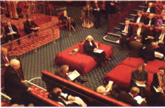
ประธานสภาขุนนางขณะปฏิบัติหน้าที่