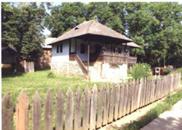
บ้านจากภูมิภาคต่าง ๆ ของโรมาเนียถูกนำมาแสดงไว้ให้ชม