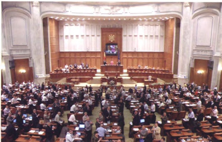
สมาชิกสภาผู้แทนราษฎรโรมาเนียลุกขึ้นปรบมือต้อนรับประธานวุฒิสภาและคณะ

ต่อมาประธานวุฒิสภาโรมาเนียได้นำชม ห้องทำงานประธานวุฒิสภาซึ่งมีขนาดใหญ่ กว้างขวางมากและมีระเบียงยื่นออกไปด้านนอก เพื่อชมทัศนียภาพเมืองของกรุงบูคาเรสต์ด้วย ซึ่งประธานวุฒิสภาของไทยได้กล่าวชื่นชม ความสวยงามตระการตาและความอลังการ ของอาคารรัฐสภาโรมาเนีย ซึ่งถือว่าเป็นอาคาร ที่มีขนาดใหญ่ที่สุดในยุโรป หรือใหญ่เป็น อันดับสองของโลก รองจากอาคารเพนตากอน ของสหรัฐอเมริกาเท่านั้น ทั้งนี้ รัฐสภาไทย เองก็กำลังอยู่ในระหว่างการพิจารณาสร้าง อาคารรัฐสภาแห่งใหม่เช่นกัน ซึ่งประธาน วุฒิสภาได้กล่าวขอบคุณและกล่าวเพิ่มเติมว่า อาคารแห่งนี้เป็นสถานที่แห่งความทรงจำ มากมายเชื่อมโยงอดีตกระทั่งปัจจุบันและ ถือเป็นสถานที่แห่งรากกำเนิดประชาธิปไตย ของโรมาเนียหลังการโค่นล้มระบบ คอมมิวนิสต์ อาคารนี้มีหลายพื้นที่และ หลายขนาด โดยมีห้องที่ใหญ่ที่สุดที่สามารถ จัดการประชุมระหว่างประเทศได้ อย่างไรก็ตาม อาคารหลังนี้ยังมีบางส่วนที่ยังสร้างไม่เสร็จ