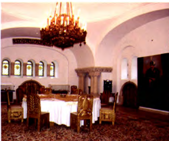
ห้องต่างๆ ภายในพิพิธภัณฑ์ในทำเนียบประธานาธิบดีโรมาเนีย

จากนั้น จึงได้เยี่ยมชมพิพิธภัณฑ์ Cotroceni National Museum ซึ่งอยู่ภายในทำเนียบประธานาธิบดี สร้างขึ้นตั้งแต่ปี พ.ศ. 2222 เพื่อเป็นพระราชวังโดยการออกแบบของสถาปนิกชาวฝรั่งเศส จบจนปี พ.ศ. 2534 ได้ใช้เป็นทำเนียบประธานาธิบดีและเปิดให้ประชาชนเข้าชมในส่วนพิพิธภัณฑ์ที่เป็นกระจกสะท้อนประวัติศาสตร์และศิลปะสถาปัตยกรรมยุคกลางและยุคใหม่และความเปลี่ยนแปลงตามกาลเวลา ทั้งรวบรวมสิ่งของต่าง ๆ มาจัดแสดง อาทิ โต๊ะเก้าอี้เตียงเครื่องดนตรี อาวุธล่าสัตว์ ข้าวของเครื่องใช้ของประดับ หนังสือ จดหมาย เป็นต้น