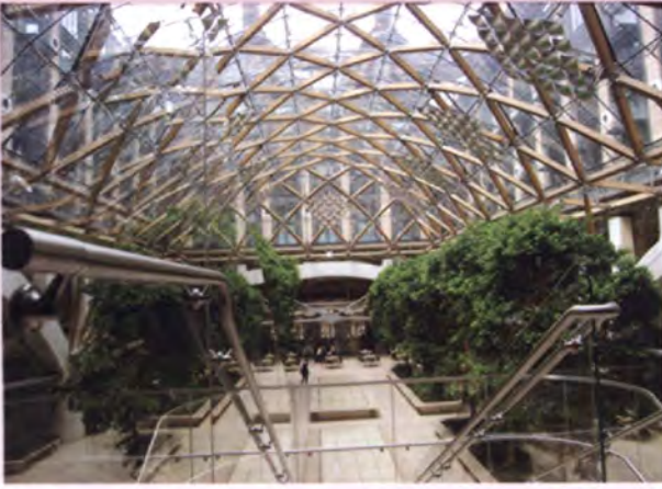
ภายในอาคาร Portcullis House