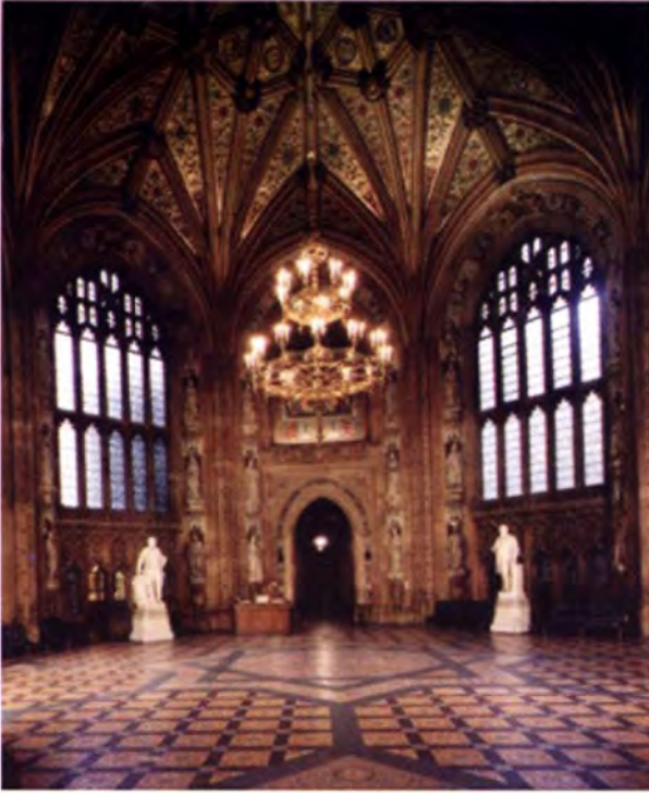
โถงกลางภายในรัฐสภา