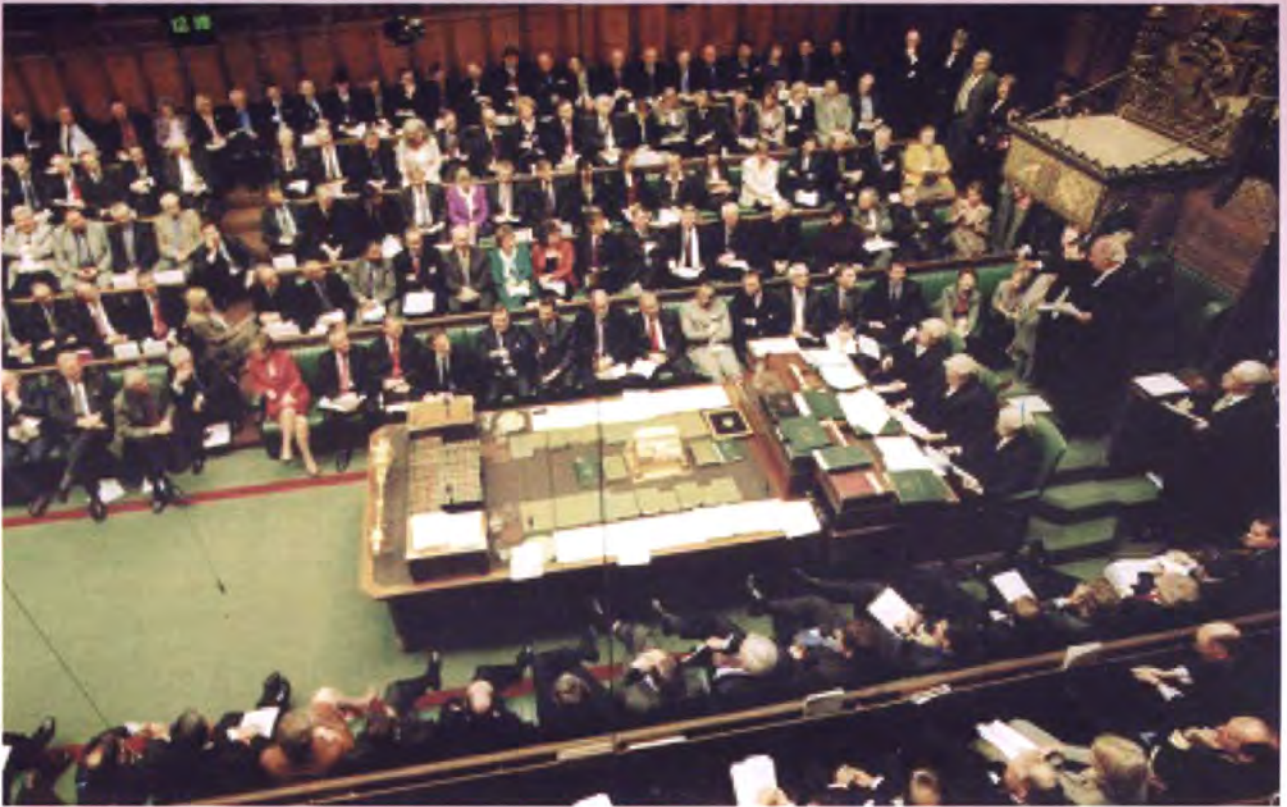
บรรยากาศระหว่างการอภิปราย ถาม-ตอบกระทู้ของสมาชิกสภาสามัญ

สภาสามัญรวมไปถึงการถาม-ตอบกระทู้ และการอภิปรายของสมาชิกสภาสามัญ โดย ประธานวุฒิสภาและรองประธานวุฒิสภา คนที่สอง ได้รับเชิญเข้าสังเกตการณ์ในการประชุมวาระสำคัญของสภาสามัญคือ วาระกระทู้ถามนายกรัฐมนตรี ซึ่งในวันดังกล่าว (วันพุธที่ 8 กรกฎาคม พ.ศ. 2552) เป็นกระทู้ที่ฝ่ายค้าน ซึ่งถูกกำหนดให้เป็น รัฐมนตรีเงา เป็นผู้ถามนายกรัฐมนตรี ในประเด็นเรื่องนโยบายของรัฐบาลเกี่ยวกับ กองทุนดูแลผู้สูงอายุระยะยาว ซึ่งโดยปกติ นายกรัฐมนตรีจะมาร่วมประชุมกับสภาสามัญ เพื่อตอบคำถามต่าง ๆ ทุกวันพุธใช้เวลา ประมาณ 1 ชั่วโมง แต่เนื่องจากนายกรัฐมนตรี เดินทางไปราชการต่างประเทศในวันดังกล่าว จึงได้มอบหมายให้รองนายกรัฐมนตรี เป็นผู้มา ตอบกระทู้แทน