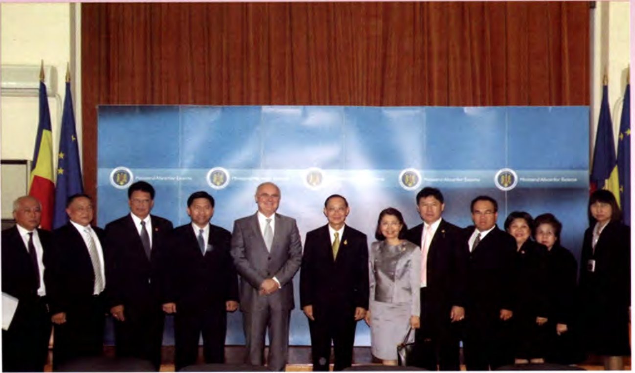
คณะถ่ายภาพร่วมกับรัฐมนตรีช่วยว่าการกระทรวงการต่างประเทศ

ปัจจุบันนาย โดรูอายุ 56 ปี สำเร็จการศึกษา ระดับปริญญาโทสาขากฎหมายระหว่างประเทศ และกำลังศึกษาระดับปริญญาเอก สาขาความสัมพันธ์ระหว่างประเทศ เคยดำรง ตำแหน่งเอกอัครราชทูตโรมาเนียประจำ ประเทศต่าง ๆ หลายประเทศ อีกทั้งเคยได้รับ รางวัลนักการทูตสร้างสรรค์ประจำปีของ กระทรวงการต่างประเทศ โรมาเนียเมื่อปี พ.ศ. 2545 และได้เข้าดำรงตำแหน่งรัฐมนตรี ช่วยว่าการกระทรวงการต่างประเทศ (Deputy Minister of Foreign Affairs) เมื่อวันที่ 10 มกราคม 2552 คณะได้หารือแลกเปลี่ยน ความคิดเห็นร่วมกัน โดยมีสาระสำคัญดังนี้ ประธานวุฒิสภากล่าวว่าการได้เข้าพบรัฐมนตรี ช่วยว่าการกระทรวงการต่างประเทศในวันนี้ ถือเป็นโอกาสอันดียิ่ง นอกจากนี้ ขอแสดงความเสียใจที่กระทรวงการต่างประเทศได้ สูดุเสียดบุคคลที่มีความสามารถอย่างนายราดู กาบรีเอล มาเตเอสกุ อดีตเอกอัครราชทูต