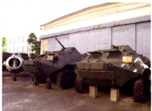
พิพิธภัณฑ์ทหารรวบรวมยานพาหนะหลายประเภทรวมถึงอากาศยานต่าง ๆ ที่ใช้ในกองทัพ