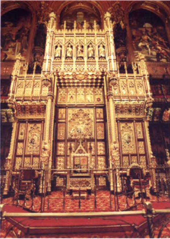
บัลลังก์ที่ประทับ