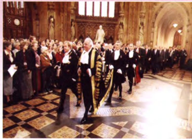
พิธีการก่อนเข้าประชุม

มีห้องมากกว่า 1,100 ห้อง และมีเฉลียงยาว 2 ไมล์ เชื่อมระหว่างสภาล่างและสภาสูง ห้องโถงของอาคารรัฐสภา (Westminster Hall) เป็นสถานที่ที่ยังคงรูปแบบดั้งเดิมของพระราชวังไว้นับจากปี ค.ศ. 1097 ในส่วนของหอนาฬิกาบิ๊ก เบน นั้น สร้างเสร็จสมบูรณ์ในปี ค.ศ. 1858 มีชื่ออย่างเป็นทางการว่า หอนาฬิกาพระราชวังเวสต์มินสเตอร์ (Clock Tower, Palace of Westminster) หอนาฬิกานี้ถูกสร้างขึ้นหลังจากเหตุเพลิงไหม้พระราชวังเวสต์มินสเตอร์เดิม มีความสูง 96.30 เมตร ตัวหอนาฬิกาสร้างด้วยสถาปัตยกรรม สมัยสมเด็จพระราชินีนาถวิกตอเรีย นอกจากนี้แท่นที่จริงแล้วชื่อ บิ๊ก เบน มิได้เป็นชื่อของหอนาฬิกา หากแต่เป็นชื่อเรียกอย่างไม่เป็นทางการของ ระฆังใบใหญ่ที่สุดที่หนักถึง 14 ตัน ซึ่งมีชื่อเป็นทางการว่า มหาระฆัง (The Great Bell)