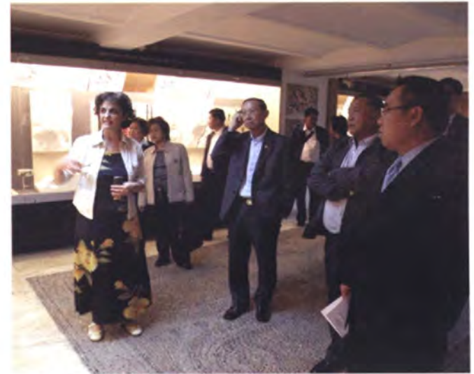
ภายในห้องจัดแสดงนิทรรศการประวัติศาสตร์ทางการทหารโรมาเนีย

ต่อมาคณะฯ ได้เดินทางไปเยี่ยมชมพิพิธภัณฑ์ทหาร (Military Museum) ซึ่งก่อตั้งตั้งแต่ปี พ.ศ. 2515 ภายในอาคารได้จัดแสดงนิทรรศการประวัติศาสตร์ทางภูมิรัฐศาสตร์และการทหาร ทั้งในรูปแบบภาพ ผัง แผนที่ และเอกสารต่าง ๆ และรวบรวมอาวุธยุทธโธปกรณ์ของโลกตะวันออกและตะวันตกในอดีต เครื่องมือเครื่องใช้ ชุดเครื่องแบบและเหรียญตราของทหาร/นักรบ และเครื่องแต่งกายของชาวโรมาเนียของยุคต่าง ๆ ภายใต้การปกครองของจักรวรรดิออตโตมัน จนได้ประกาศเอกราชสถาปนาเป็นประเทศในปี 2421 ทั้งนี้ ระหว่างสงครามโลกครั้งที่ 2 โรมาเนียถูกกองทัพเยอรมนีเข้ายึดครอง แต่กองทัพโซเวียตได้ปลดปล่อยและมีอำนาจ