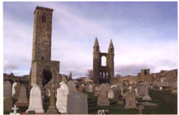
สุสานของชาวเมืองเซนต์ แอนดรูส์