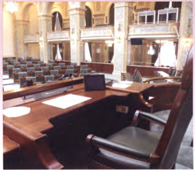
บัลลังก์ประธานวุฒิสภาภายในห้องประชุมวุฒิสภา

ภารกิจด่วนของสภาผู้แทนราษฎรในการเรียก ประชุมเพื่อพิจารณาเรื่องสำคัญ ทำให้ประธาน สภาผู้แทนราษฎรไม่สามารถให้การต้อนรับได้ อย่างไรก็ตาม ประธานสภาผู้แทนราษฎรขณะ ทำหน้าที่ประธานในที่ประชุมอยู่บนบัลลังก์ ได้กล่าวต้อนรับประธานวุฒิสภาและคณะฯ ด้วย ซึ่งบรรดาสมาชิกสภาผู้แทนราษฎรในห้องประชุม ต่างได้ลุกขึ้นปรบมือเสียงกึกก้องเพื่อต้อนรับ และเป็นการให้เกียรติแก่คณะฯ