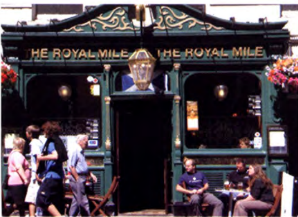
ร้านอาหารบนถนน Royal Mile

กรุงเอдинบอระ มีทัศนียภาพของเมืองที่สวยงาม แบ่งออกเป็น 2 ส่วน สำคัญ คือ เมืองเก่า (Old Town) และเมืองใหม่ (Georgian New Town) ที่มีความงามในแบบนีโอ-คลาสสิก มีสถานที่สำคัญทางประวัติศาสตร์ที่รวมถึง ถนนและทางเดินอันเก่าแก่ในยุคกลาง เช่น ถนนรอยัล ไมล์ (Royal Mile)