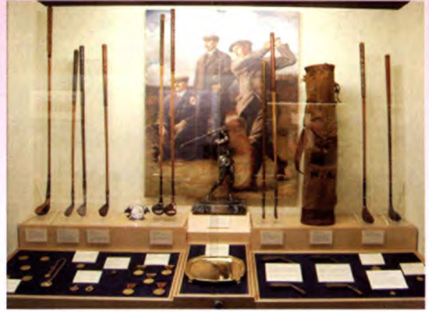
อุปกรณ์การเล่นในอดีต