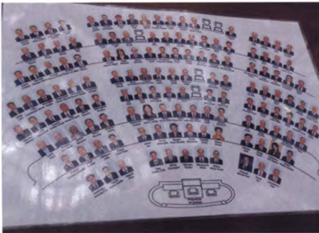
ผังรายนามและรูปสมาชิกวุฒิสภา ที่ติดบนบัลลังก์ประธานวุฒิสภา