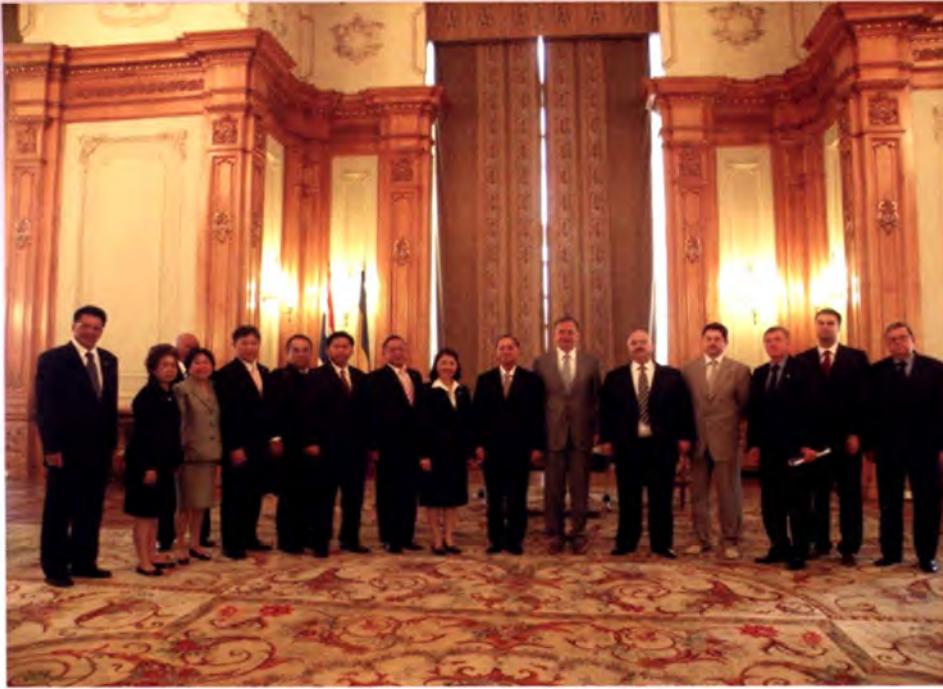
คณะถ่ายภาพร่วมกับประธานวุฒิสภาและสมาชิกรัฐสภาโรมาเนีย

กรรมาธิการร่วมระหว่างสองสภาว่าด้วยการ รวมยุโรปอีกด้วย ก่อนที่จะมาดำรงตำแหน่ง ประธานวุฒิสภาเมื่อวันที่ 19 ธันวาคม 2551 หลังจากมีการเลือกตั้งสมาชิกวุฒิสภา เมื่อเดือนพฤศจิกายน 2551