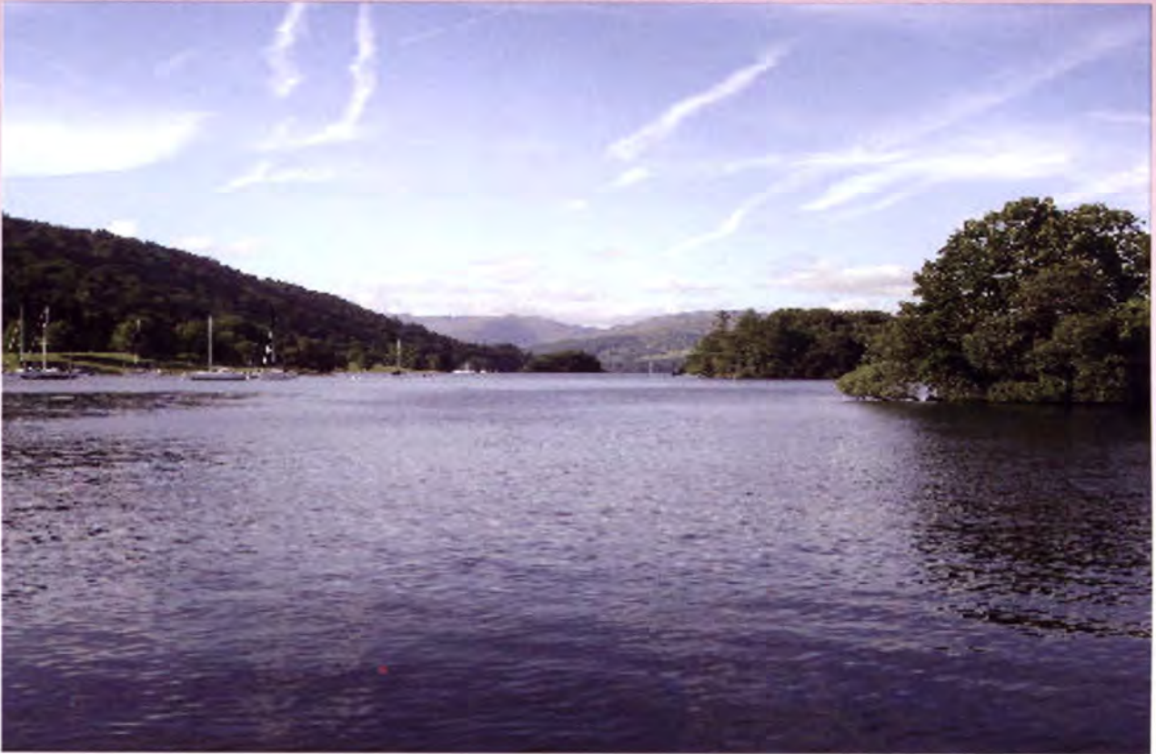
ทะเลสาบวินเดอร์เมียร์ (Lake Windermere)

การเปิดรับ การเข้าถึงและการมีส่วนร่วม การส่งเสริมความเท่าเทียมทางโอกาส รวมทั้ง มีบทบาทและทำหน้าที่ในการผ่านกฎหมาย ที่รัฐสภาสหราชอาณาจักร ให้อำนาจไว้ รวมทั้งตรวจสอบการทำงานของฝ่ายบริหาร แคว้นสกอตแลนด์มีรัฐบาลของตนเองเป็น รัฐบาลผสมระหว่างพรรคแรงงาน และพรรค เสรีประชาธิปไตยทำหน้าที่เป็นฝ่ายบริหาร การประชุมสภาสกอตแลนด์จะมีขึ้นทุกวันพุธ ตอนบ่ายและวันพฤหัสบดีเต็มวัน