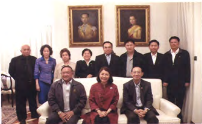
ถ่ายภาพร่วมกับเอกอัครราชทูต ณ กรุงบูคาเรสต์ หลังงานเลี้ยงอาหารค่ำ

มูลค่าการค้ารวมระหว่างไทยกับโรมาเนีย มีแนวโน้มเฉลี่ยเพิ่มขึ้นทุกปี โดยไทยได้ ดุลการค้ามาตลอด สินค้าที่ไทยส่งออก ได้แก่ รถยนต์ อุปกรณ์และส่วนประกอบ อาหารทะเลกระป๋องและแปรรูป เม็ดพลาสติก ยางพารา อาหารทะเลกระป๋องและแปรรูป วงจรพิมพ์ เม็ดพลาสติก เสื้อผ้าสำเร็จรูป เครื่องคอมพิวเตอร์ อุปกรณ์และส่วนประกอบ สินค้าที่ไทยนำเข้า ได้แก่ เครื่องจักรกล และส่วนประกอบ ผลิตภัณฑ์โลหะ เครื่องจักร ไฟฟ้าและส่วนประกอบ เครื่องใช้เบ็ดเตล็ด ไม้ซุง ไม้แปรรูปและผลิตภัณฑ์ เสื้อผ้าสำเร็จรูป เครื่องใช้ไฟฟ้า ยุทโธปกรณ์ กระดาษ ไทยและ โรมาเนียได้จัดตั้งกลไกส่งเสริมความร่วมมือ ทางด้านการค้าระหว่างกัน ซึ่งมีการลงนาม พิธีสารจัดตั้งคณะกรรมการร่วมทางการค้า (Joint Trade Committee - JTC) เมื่อวันที่ 4 กรกฎาคม 2521 อย่างไรก็ดี หลังจากที่ โรมาเนียเข้าเป็นสมาชิกสหภาพยุโรป โรมาเนีย ได้ขอยกเลิกความตกลงการค้าที่ทำกับไทย เพื่อใช้นโยบายการค้าร่วมของสหภาพยุโรปแทน ต่อมาทั้งสองฝ่ายได้เห็นชอบจัดทำความตกลง ว่าด้วยความร่วมมือทางเศรษฐกิจขึ้น