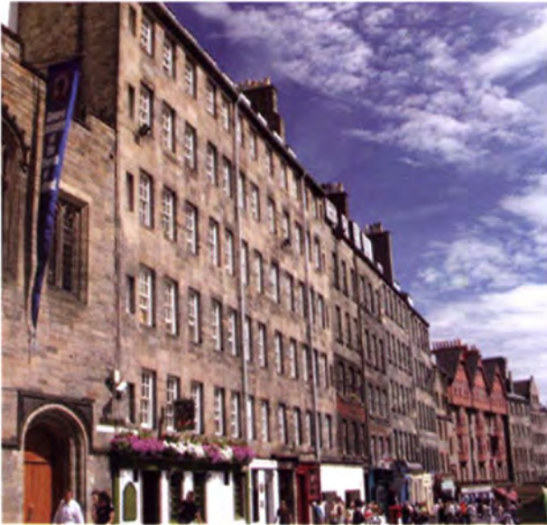
บรรยากาศสองฝั่งถนน Royal Mile