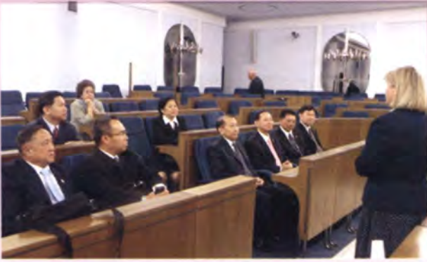
ภายในห้องประชุมวุฒิสภาโปแลนด์

สมาชิกวุฒิสภาผู้ซึ่งเสียชีวิตระหว่างสงครามโลกภายในห้องประชุมวุฒิสภามีพื้นที่ประมาณ 220 ตารางเมตร ที่มีพื้นที่จำกัดมากเนื่องจากในอดีตได้เคยมีการยกเลิกวุฒิสภาไป ดังนั้นเมื่อริเริ่มให้มีวุฒิสภาอีกครั้งจึงมีพื้นที่เพียงห้องประชุมเล็ก ๆ จำนวน 3 ห้องที่ขยายทะลุถึงกันเป็นห้องประชุมวุฒิสภาในปัจจุบัน อย่างไรก็ตามได้มีการปรับปรุงตกแต่งภายในห้องประชุมเสียใหม่เพื่อให้เกิดประโยชน์ใช้สอยได้อย่างเต็มที่ แต่กระนั้นก็ถือเป็นห้องประชุมสภาที่เล็กที่สุดในยุโรป บนบัลลังก์ของประธานวุฒิสภาจะประดับธงประจำชาติโปแลนด์ ซึ่งมีแถบสีแดงและขาว สีแดงหมายถึงโลหิตของชาวโปแลนด์ในการได้มาซึ่งอิสรภาพและสีขาวหมายถึงนกอินทรี สีขาวซึ่งเป็นสัตว์สัญลักษณ์ของโปแลนด์ มีคทาขนาดใหญ่สีทองทางฝั่งขวาของประธานวุฒิสภา และ