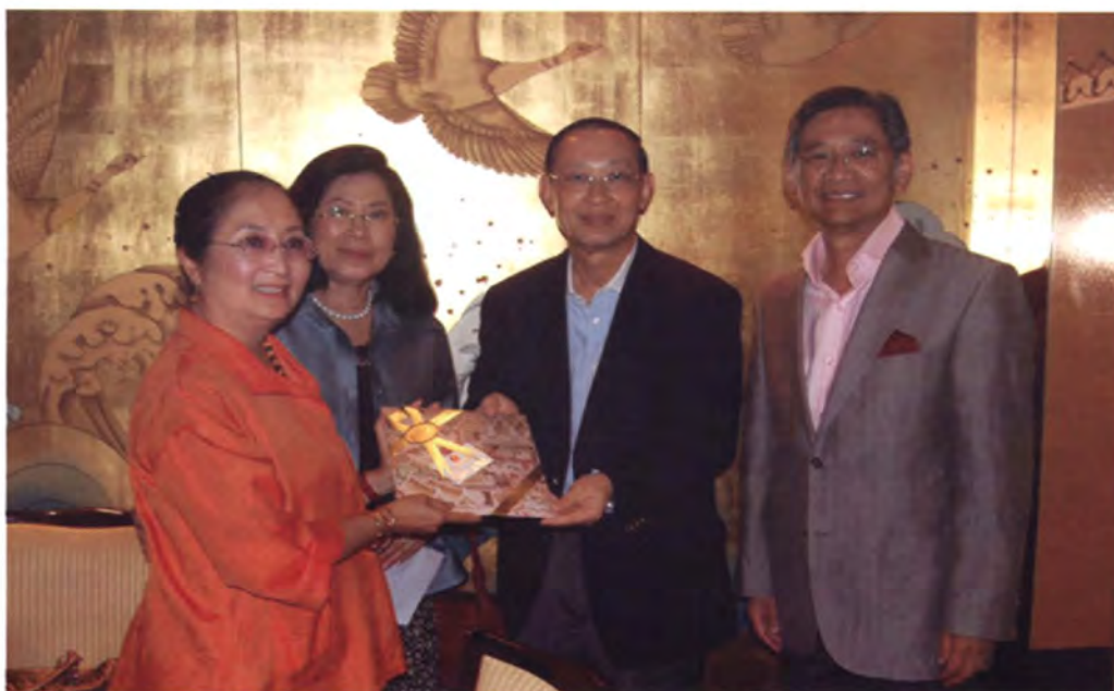
เอกอัครราชทูตเป็นเจ้าภาพเลี้ยงอาหารค่ำแก่คณะฯ