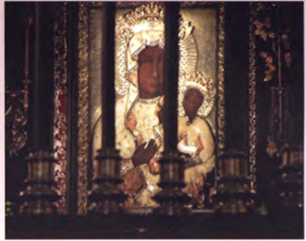
ผู้คนหลังโหลเข้ามาสักการะพระรูปแม่พระฉวีดำ (Black Madonna)

ยุโรป หรือมีพื้นที่ประมาณ 3 ใน 5 ของไทย มีประชากรประมาณ 39 ล้านคน ส่วนใหญ่นับถือศาสนาคริสต์นิกายโรมันแคทอลิก มีภาษาโปลิชเป็นภาษาราชการ เมืองหลวงคือกรุงวอร์ซอ (Warsaw) ซึ่งมีประชากรราว 1,635,000 คน เมื่อปี พ.ศ. 2551 โปแลนด์มี GDP 567.4 พันล้านเหรียญสหรัฐฯ (ขณะที่ไทยมี 270 พันล้านเหรียญสหรัฐฯ) GDP ต่อหัว 14,893 เหรียญสหรัฐฯ (ขณะที่ไทยมี 4,072 เหรียญสหรัฐฯ) และมีอัตราการเติบโตทางเศรษฐกิจร้อยละ 4.8 (ไทยร้อยละ 4.9) ใช้สกุลเงิน สว้อตตี้ (Zloty) มีทรัพยากรธรรมชาติที่สำคัญ ได้แก่ ถ่านหิน (มีแหล่งสำรองถ่านหินใหญ่เป็นอันดับ 5 ของโลก) กำมะถัน ทองแดง ก๊าซธรรมชาติ เงิน ตะกั่ว ดีบุก อำพัน ผลผลิตทางเกษตรคือ ธัญพืช สุกกร นม มันฝรั่ง น้ำตาล น้ำมันพืช พืชสวน (ผัก ผลไม้) อุตสาหกรรมที่สำคัญ คือ เครื่องจักรกล ในการก่อสร้าง แร่เหล็กและเหล็ก แปรรูป เหมืองแร่ เคมีภัณฑ์ การต่อเรือ อาหารสำเร็จรูป เครื่องแก้ว เครื่องดื่ม รถยนต์ อากาศ โดยมีประเทศคู่ค้าที่สำคัญ ได้แก่ เยอรมนี อิตาลี รัสเซีย ฝรั่งเศส จีน