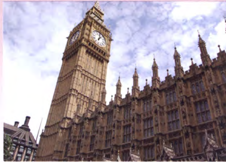
อาคารรัฐสภา

ใน ส่วน ความ สัม พัน ธ์ ไทย และ สห รา ช อาณา จักร ราช นั้น มี ความ สัม พัน ธ์ กัน มา ช้านาน มีการ สถาปนา ความ สัม พัน ธ์ ทาง การ ทูต อย่าง เป็น ทาง การ เมื่อ วัน ที่ 18 เม ษา ยน พ.ศ. 2398 (ค.ศ. 1855) ความ สัม พัน ธ์ ของ ทั้ง สอง ประเทศ มี ขึ้น ทั้ง ใน กรอบ ความ ร่วม มือ ทวิ ภา คี และ พหุ ภา คี รวมทั้ง ขยาย ตัว ครอบ คลุม ทุก สาขา ของ ความ ร่วม มือ ถึง แม้ ว่า ไทย และ สห รา ช อาณา จักร ราช จะ มี ได้ จัด ตั้ง คณะ กรรมา ธิ การ ร่วม หรือ คณะ กรรมา การ กำกับ ดู แล ความ สัม พัน ธ์ ทวิ ภา คี ดัง เช่น ที่ ประเทศ ไทย มี กับ ประเทศ สำคัญ อื่น ๆ ใน ยุโรป แต่ ทั้ง สอง ฝ่าย ต่าง เห็น พ้อง ต้อง กัน ว่า ความ สัม พัน ธ์ ทวิ ภา คี ไทย สห รา ช อาณา จักร ราช นั้น ได้ หยั่ง ราก ลึก ครอบ คลุม ทุก สาขา แล้ว ทั้ง ใน ระดับ สถา บัน-สถา บัน เอก ชน-เอก ชน และ ประชา ชน-ประชา ชน ซึ่ง ใน ระดับ สถา บัน นั้น เป็น ที่ นำ ยิน ดี ว่า ปี พ.ศ. 2553 (ค.ศ. 2010)