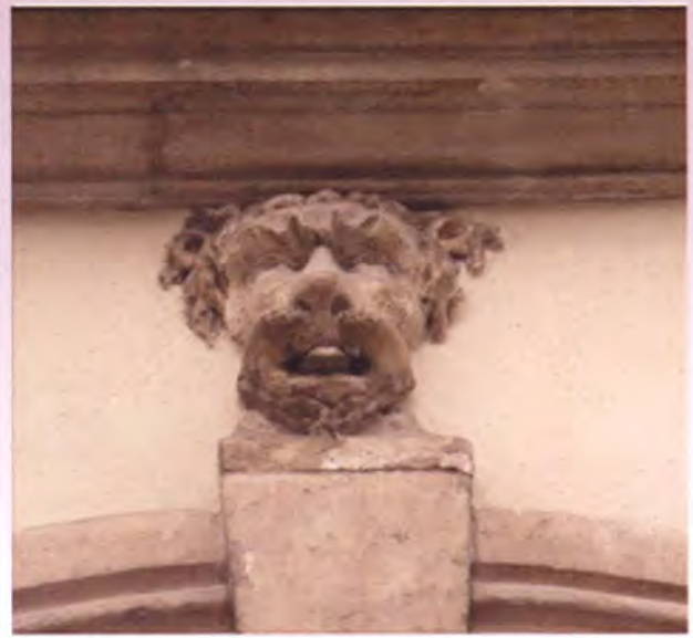
เหนือประตูทางเข้าบ้านแต่ละหลังจะประดับสัญลักษณ์ของบ้านนั้น ๆ เป็นรูปต่าง ๆ แทนเลขที่บ้าน