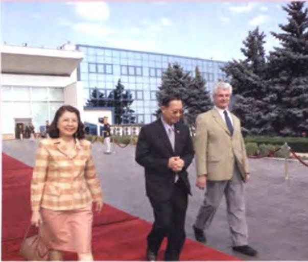
เอกอัครราชทูตฯ และเจ้าหน้าที่ระดับสูงของวุฒิสภา โรมาเนียร์อส่งประธานวุฒิสภาและคณะเดินทางกลับ