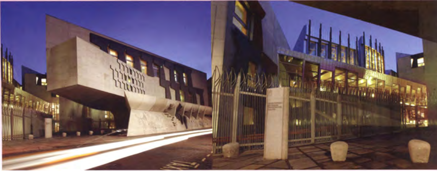
ด้านหน้าอาคารสภาสกอตแลนด์