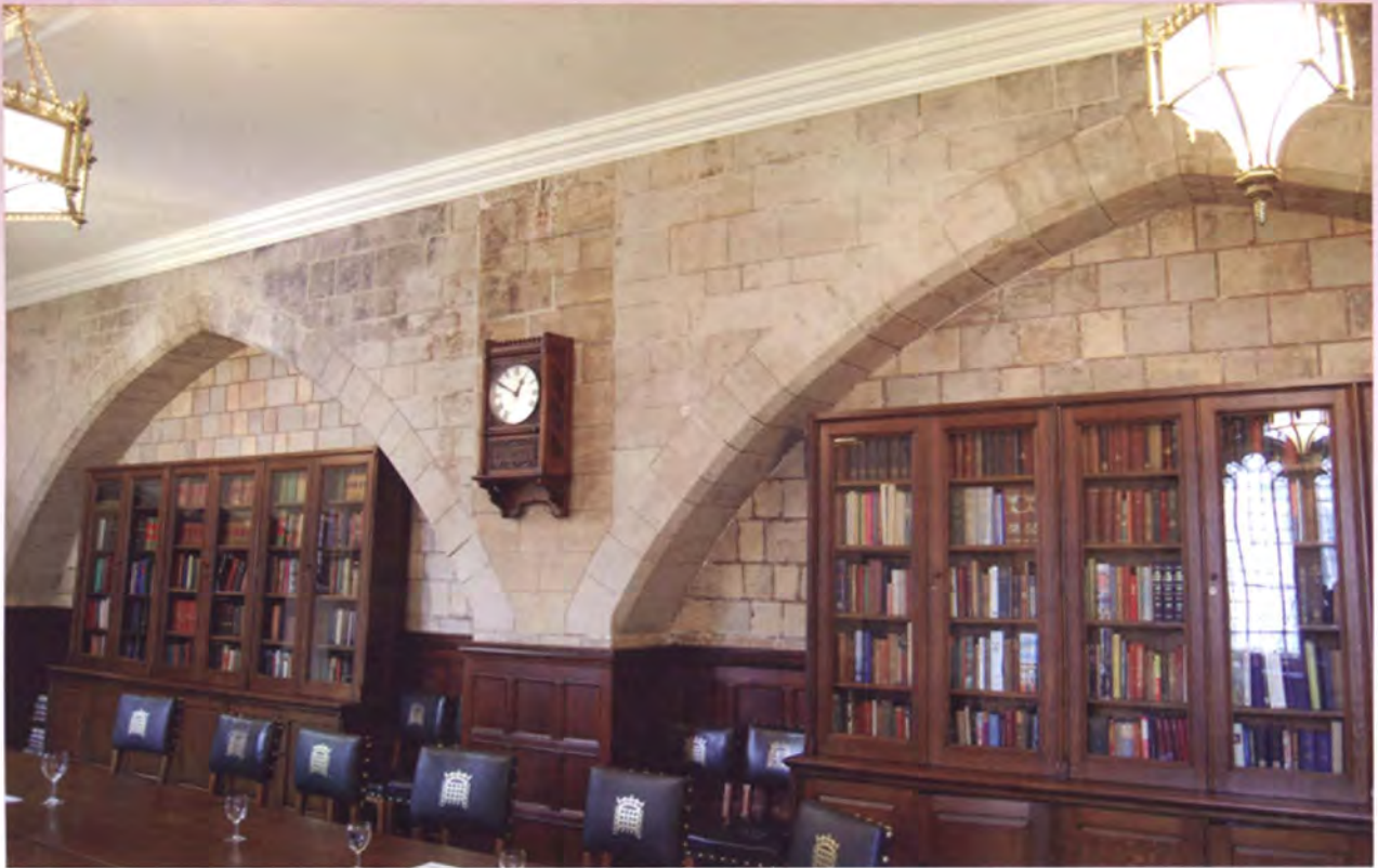
ห้องประชุมกรรมาธิการของสภาสามัญ (ใช้สีเขียวซึ่งเป็นสีสัญลักษณ์เป็นองค์ประกอบ)

เป็นศาลสูงสุดอีกด้วย ปัจจุบันสภาขุนนางประกอบด้วยสมาชิกจำนวน 740 คน ซึ่งเป็นขุนนางฝ่ายสงฆ์และขุนนางฝ่ายฆราวาส โดยเป็นสมาชิกตลอดชีพ และมีหน้าที่หลักที่สำคัญ คือ การตรากฎหมาย การตรวจสอบการทำงานของรัฐบาล การจัดประชุมกับผู้เชี่ยวชาญอิสระ และตุลาการ (เป็นศาลสูงสุดของประเทศ) สมาชิกสภาขุนนางประกอบด้วยสมาชิกที่มาจาก 4 องค์ประกอบหลัก ดังนี้