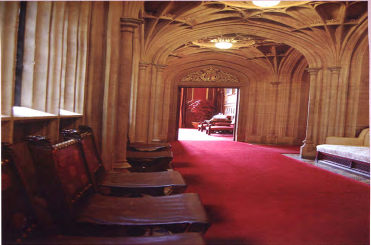
โถงทางเดินบริเวณสภาขุนนาง (มีสีแดงเลือดหมูเป็นองค์ประกอบ)

3. ขุนนางโดยตำแหน่งที่เป็นนักบวชสมณศักดิ์ (Archbishops and Bishops) จำนวน 26 คน ซึ่งเป็นจำนวนที่กำหนดไว้แน่นอน และสามารถดำรงตำแหน่งตราบเท่าที่ยังอยู่ในสมณศักดิ์เท่านั้น