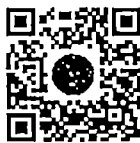
หนังสือนัดประชุม และระเบียบวาระการประชุม สภาผู้แทนราษฎร

สมาชิกสภาผู้แทนราษฎรสามารถอ่านและดาวน์โหลดเอกสารประกอบการพิจารณาได้ โดยการสแกน QR Code หรือทาง www.parliament.go.th