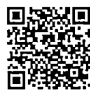
บันทึกการประชุมสภา สำนักrayงาน การประชุมและชวเลข