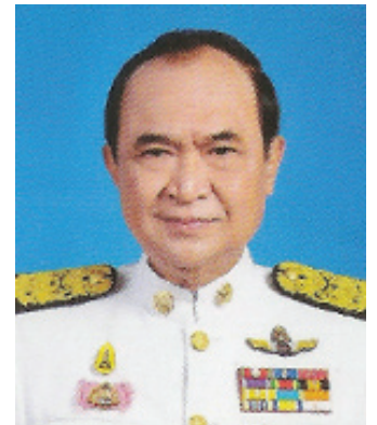
นายจากรพงศ์ เรืองสุวรรณ รัฐมนตรีว่าการกระทรวงมหาดไทย

ครั้งล่าสุด เมื่อปี ๒๕๕๖ ระหว่างวันที่ ๒๖ - ๒๗ พฤศจิกายน ๒๕๕๖ นายอภิสิทธิ์ เวชชาชีวะ ผู้นำฝ่ายค้านในสภาผู้แทนราษฎร และคณะ จำนวน ๑๔๖ คน ได้ยื่นญัตติขอเปิดอภิปรายทั่วไปเพื่อลงมติไม่ไว้วางใจนายกรัฐมนตรี และขอเปิดอภิปรายทั่วไปเพื่อลงมติไม่ไว้วางใจรัฐมนตรีเป็นรายบุคคล ในที่นี้ คือ นางสาวยิ่งลักษณ์ ชินวัตร นายกรัฐมนตรี และรัฐมนตรีว่าการกระทรวงกลาโหม และนายจากรพงศ์ เรืองสุวรรณ รัฐมนตรีว่าการกระทรวงมหาดไทย เนื่องจากรัฐบาลบริหารราชการแผ่นดินผิดพลาด รวมทั้งมีการทุจริตในโครงการต่าง ๆ ของรัฐบาล ซึ่งภายหลังเสร็จสิ้นการอภิปราย ที่ประชุมได้ดำเนินการลงมติไม่ไว้วางใจในวันที่ ๒๘ พฤศจิกายน ๒๕๕๖ ผลปรากฏว่า นางสาวยิ่งลักษณ์ ชินวัตร นายกรัฐมนตรี และรัฐมนตรีว่าการกระทรวงกลาโหม ได้คะแนนเสียงไว้วางใจ ๒๙๗ เสียง ต่อ ๑๓๔ เสียง งดออกเสียง ๒ เสียง และไม่ลงคะแนน ๕ เสียง ส่วนนายจากรพงศ์ เรืองสุวรรณ รัฐมนตรีว่าการกระทรวงมหาดไทย ได้คะแนนเสียงไว้วางใจ ๒๙๖ เสียง ต่อ ๑๓๕ เสียง งดออกเสียง ๔ เสียง และไม่ลงคะแนน ๕ เสียง สรุปได้ว่า นางสาวยิ่งลักษณ์ ชินวัตร นายกรัฐมนตรี และนายจากรพงศ์ เรืองสุวรรณ ได้รับความไว้วางใจจากสภาผู้แทนราษฎรให้ทำหน้าที่บริหารราชการแผ่นดินต่อไป ■