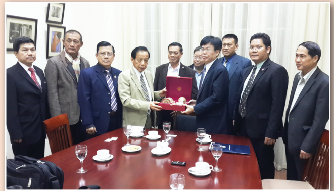
๓๐ มกราคม ๒๕๕๗ ณ อาคารรัฐสภา ๒ กรุงเทพฯ 30 January 2014, at Parliament Building 2, Bangkok