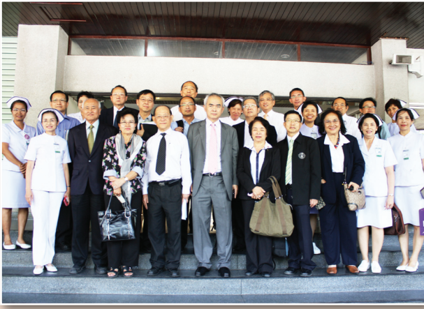
๒๘ - ๒๙ มกราคม ๒๕๕๗ ณ มหาวิทยาลัยสงขลานครินทร์ จังหวัดสงขลา 28 - 29 January 2014, at the Prince of Songkla University, Songkhla Province