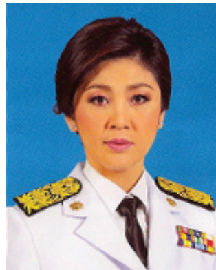
นางสาวยิ่งลักษณ์ ชินวัตร นายกรัฐมนตรี

นับตั้งแต่คณะรัฐบาลที่มี นางสาวยิ่งลักษณ์ ชินวัตร เป็นนายกรัฐมนตรี เข้ามาทำหน้าที่บริหารราชการแผ่นดินเป็นเวลาสองปีกว่าที่ประชุมสภาผู้แทนราษฎรได้มีการเปิดอภิปรายไม่ไว้วางใจนายกรัฐมนตรีและรัฐมนตรีเป็นรายบุคคลไปแล้วถึง ๓ ครั้ง คือ การอภิปรายครั้งแรก เมื่อปี ๒๕๕๔ วันที่ ๒๗ พฤศจิกายน ๒๕๕๔ ผู้ถูกขอเปิดอภิปรายไม่ไว้วางใจ คือ พล.ต.อ.ประชา พรหมนอก รัฐมนตรีว่าการกระทรวงยุติธรรม ครั้งที่ ๒ เมื่อปี ๒๕๕๕ เมื่อวันที่ ๒๕ - ๒๗ พฤศจิกายน ๒๕๕๕ ผู้ถูกขอเปิดอภิปรายไม่ไว้วางใจ ประกอบด้วย นางสาวยิ่งลักษณ์ ชินวัตร นายกรัฐมนตรี ร.ต.อ.เฉลิม อยู่บำรุง รองนายกรัฐมนตรี พล.อ.อ.สุกำพล สุวรรณทัต รัฐมนตรีว่าการกระทรวงกลาโหม และ พล.ต.ท.ชัจจ์ กุลดิลก รัฐมนตรีช่วยว่าการกระทรวงมหาดไทย