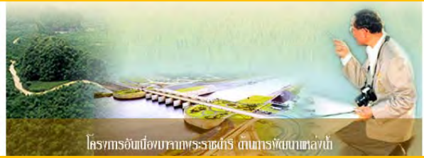
โครงการอันเนื่องมาจากพระราชดำริ แผนการพัฒนาแหล่งน้ำ

ปีที่ ๑๐ ฉบับที่ ๑๑๒ ประจำเดือนธันวาคม ๒๕๕๔