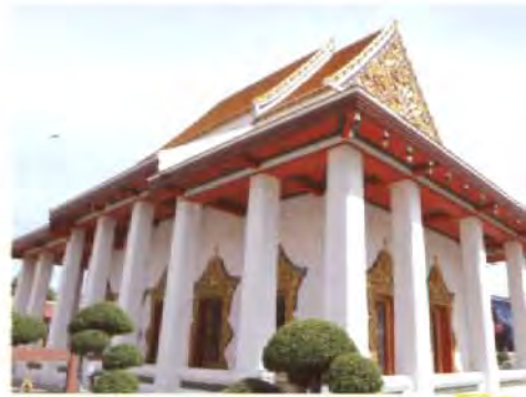
พระวิหาร

ขนาดกว้าง ๑๔ เมตร ยาว ๒๐.๐๕ เมตร ลักษณะต่าง ๆ เหมือนกับพระอุโบสถ หน้าบันยังคงประดับด้วยกระเบื้องของเดิม