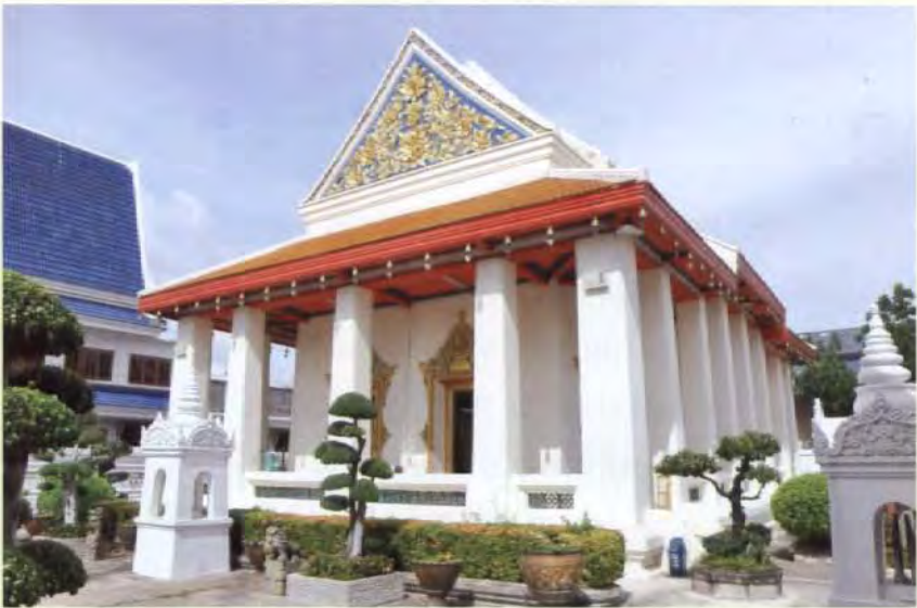
พระอุโบสถ

ขนาดกว้าง ๑๔ เมตร ยาว ๒๐.๐๕ เมตร ทรงจีน หลังคาลาด ๒ ชั้น ไม่มีช่อฟ้าใบระกา หน้าบันประดับด้วย กระเบื้องเคลือบและเครื่องถ้วยชาม ตอนหลังกระเบื้อง แตกหักเสียหาย จึงได้ปั้นลายเถาดอกไม้ปิดกระจง