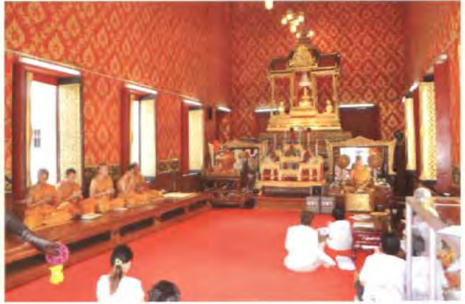
พระแชกคำ

พระคุณแห่งพระชนกชนนี ที่พระนางมิสามารถปรนนิบัติ ทดแทนคุณบุพการีทั้งสองเยี่ยงบุตรธิดาผู้มีกตัญญู กตเวทิตาทั้งหลาย พระนางจึงมีพระราชประสงค์จะสร้าง พระพุทธรูปขึ้น ๒ องค์ เพื่อบูชาพระคุณพระชนกชนนี และอีกองค์หนึ่งเพื่อเป็นการฉลองพระองค์