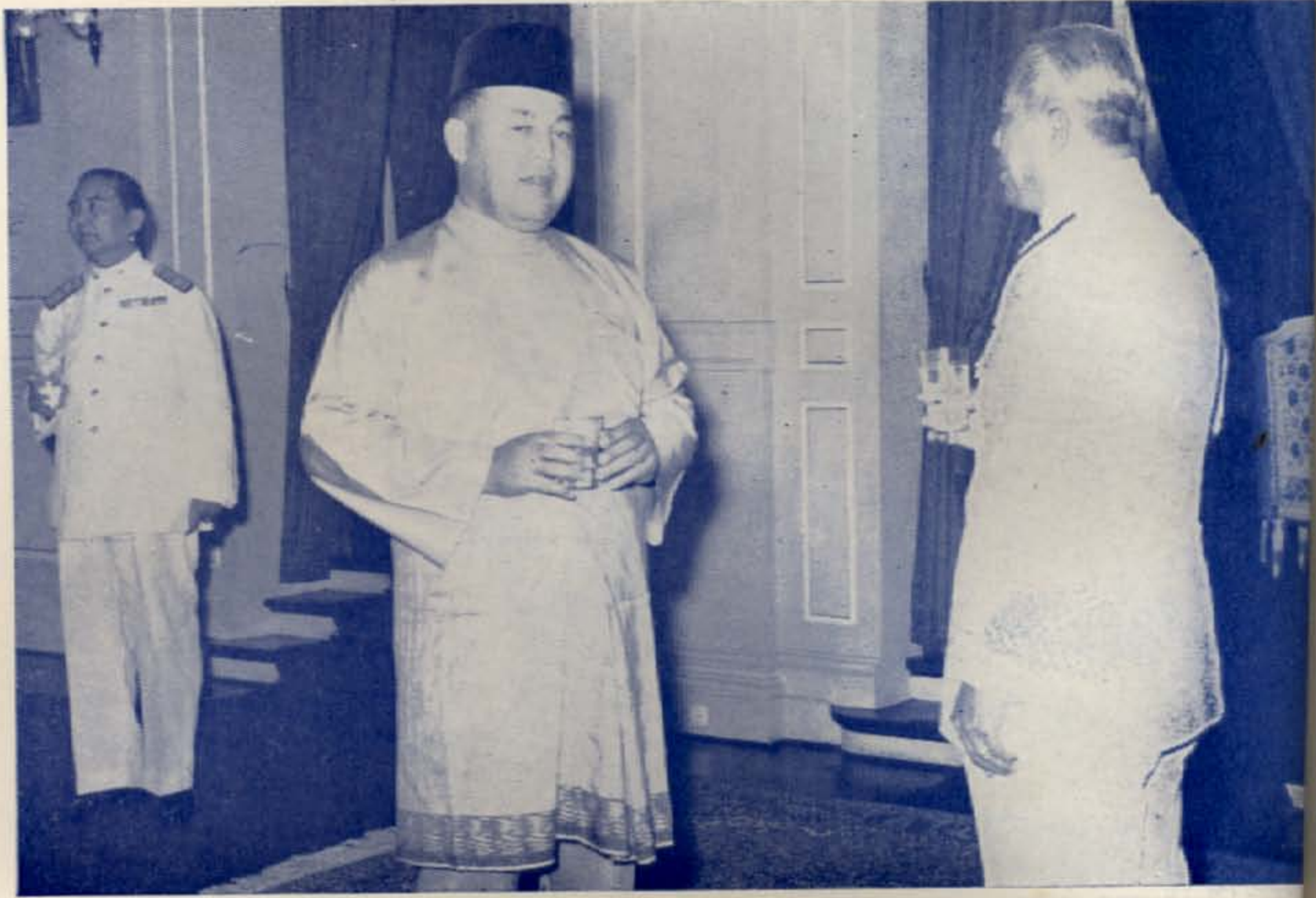
ฯพณฯ นายกรัฐมนตรี และคุณหญิงนำคณะรัฐมนตรีและภริยา เฝ้า ทูลละอองธุลีพระบาท สมเด็จพระราชาธิบดี และสมเด็จพระราชินี แห่งมาเลเซีย ณ พระที่นั่งบรมพิมาน