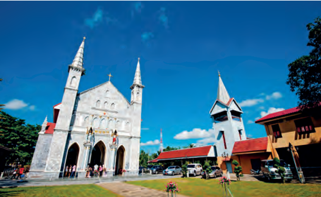
โบสถ์คริสต์วัดพระหฤทัย อายุ ๑๐๐ ปี

สอบถามข้อมูล โทร. ๐๘ ๒๗๒๓ ๗๒๕๙ โทรสาร ๐ ๓๒๓๙ ๙๒๗๗