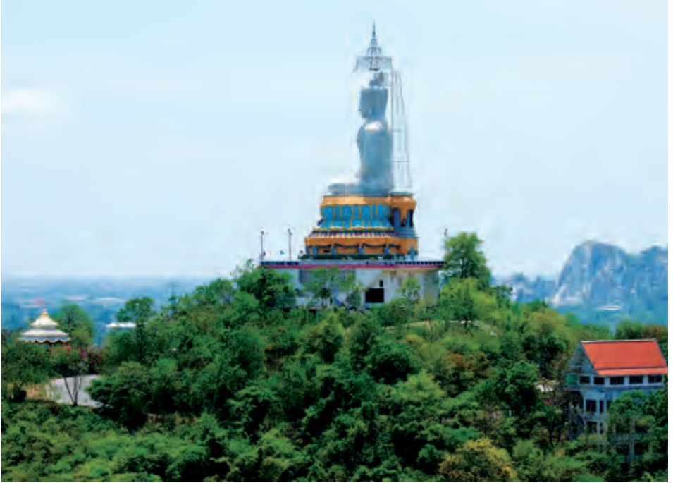
วัดหนองหอย

เขาน้อยเทียมจันทร์ อยู่ที่ตำบลอ่างทอง อยู่เลยเขาหลวงไปตามถนนเพชรเกษม ห่างจากตัวจังหวัดประมาณ ๑๐ กิโลเมตร พระอุโบสถหลังเก่าสร้างด้วยศิลาแลงทั้งหลัง ภายในอุโบสถเป็นที่ประดิษฐานพระพุทธรูป ๒ องค์ ทำด้วยศิลาแลง ชาวบ้านเรียกว่า หลวงพ่อเขาน้อย ด้านบนมีรอยพระพุทธรูปบาทจำลอง และสามารถชมทิวทัศน์ตัวเมืองราชบุรีได้