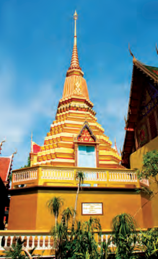
วัดเขาวัง

การเดินทาง ใช้เส้นทางเดียวกับทางไปพิพิธภัณฑสถานแห่งชาติ ราชบุรี เลี้ยวซ้ายตรงไปประมาณ ๒๐๐ เมตร