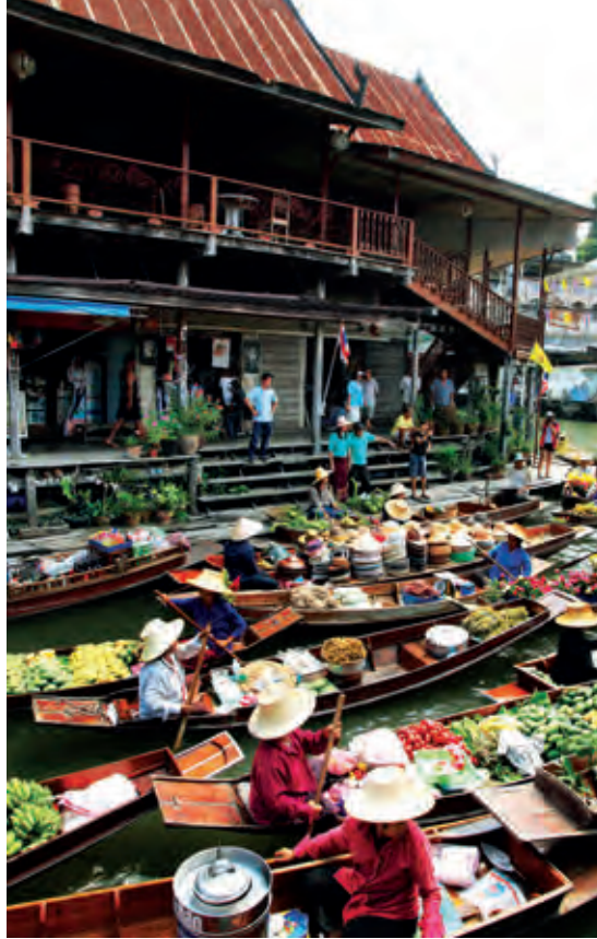
ตลาดน้ำดำเนินสะดวกเก่า (คลองลัดพลี)

๑. ไปตามถนนเพชรเกษม เส้นทางหลวง หมายเลข ๔ ผ่านบางแค สวนสามพราน นครชัยศรี