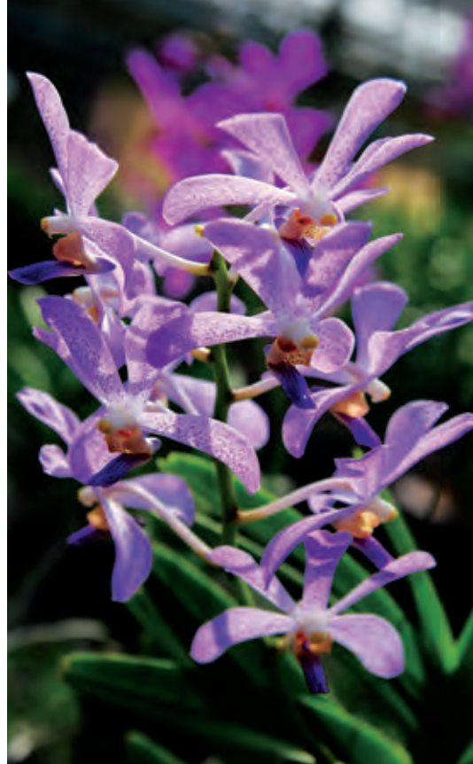
กล้วยไม้ สวนผึ้ง

กล้วยม้วน รสชาติอร่อยไม่แพ้ที่อื่น มีจำหน่ายที่ โรงงานแม่ทิมกล้วยม้วน อำเภอสวนผึ้ง นอกจากนี้ ผลิตกันที่จากกล้วย ยังมีฝือกและมันฉาบน้ำผึ้ง