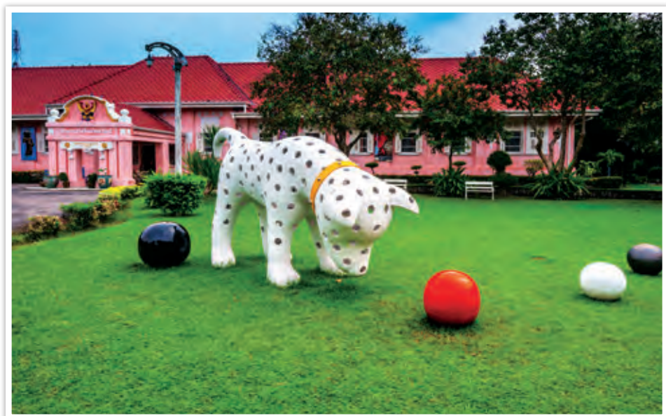
พิพิธภัณฑ์สถานแห่งชาติ ราชบุรี

เข้าชมทุกวันจันทร์-ศุกร์ เวลา ๐๘.๓๐-๑๖.๓๐ น. สอบถามข้อมูล โทร. ๐ ๓๒๓๓ ๗๔๐๖