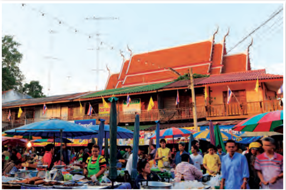
ตลาดนัดชุมชนเจ็ดเสมียน

ใช้ในสมัยก่อน ซึ่งนับเป็นสิ่งที่หาได้ยากในปัจจุบัน ภาพวาดของบรรดาศิลปินจากโพธาราม และมี ตลาดนัดชุมชนเจ็ดเสมียน ทุกวันศุกร์ เสาร์ อาทิตย์ ตั้งแต่เวลาประมาณ ๑๕.๐๐-๑๙.๐๐ น. มีสินค้านานาชนิดของชุมชนมาจำหน่าย ในทุกวันเสาร์-อาทิตย์ สัปดาห์สุดท้ายของเดือน มีกิจกรรมงานศิลปะประเภทงานภาพถ่าย และภาพวาด งานศิลปะหัตถกรรม การแสดงของศิลปินไทยและต่างชาติ การแสดงพื้นบ้าน และจำหน่ายอาหาร สอบถามข้อมูลได้ที่ เทศบาลตำบลเจ็ดเสมียน โทร. ๐ ๓๒๓๙ ๐๐๓๒