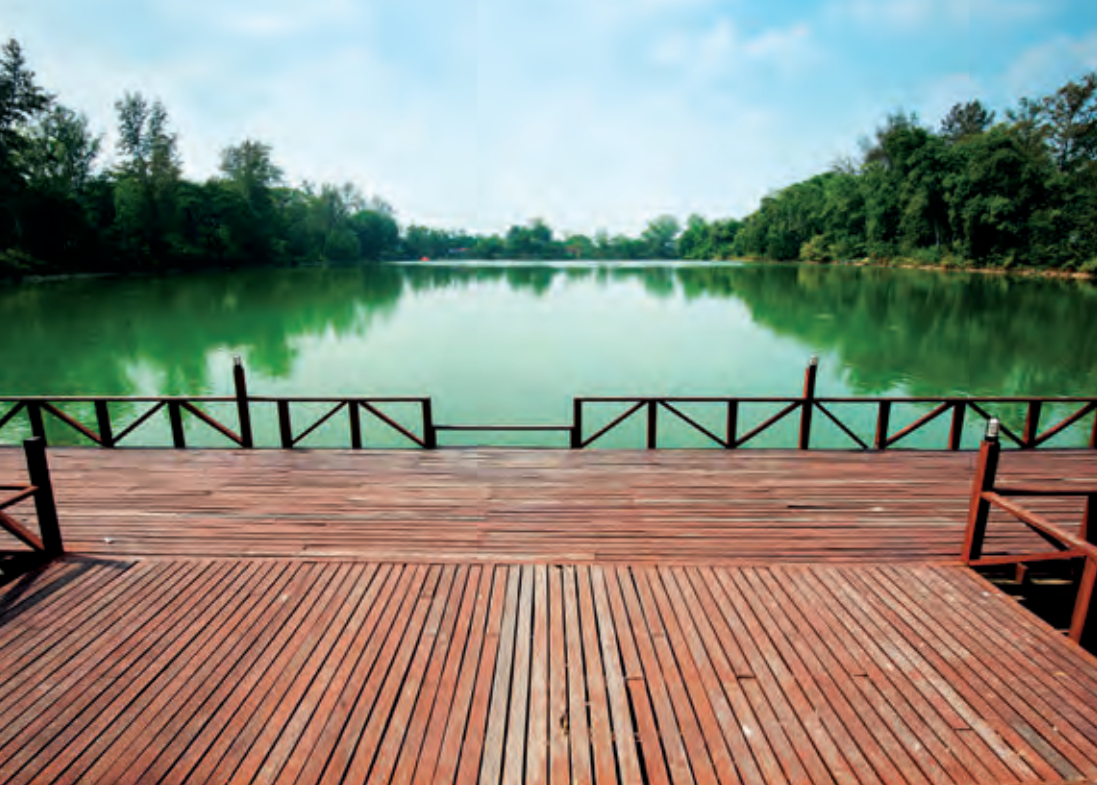
สระโกสินารายณ์

๓ กิโลเมตร วัดบึงกระบัวอยู่ทางขวามือ เข้าไป ๑ กิโลเมตร