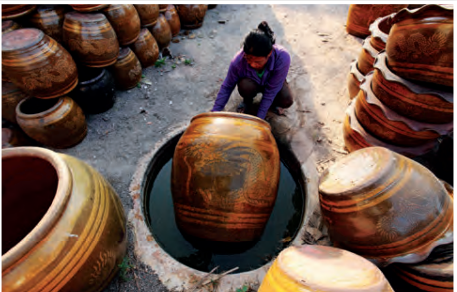
รัตนโกสินทร์ ๑

ถ้าเขาบิน ตำบลหินกอง ใบริเวณภูเขาบิน ซึ่งอยู่ในเขตป่าสงวนแห่งชาติ ถ้ามีเนื้อที่ประมาณ ๕ ไร่เศษ มีความลึกจากปากถ้ำถึงบริเวณลึกสุดประมาณ ๓๐๐ เมตร สภาพของถ้ำเหมือนแบ่งเป็นคูหาตามลักษณะหินงอกหินย้อยวิจิตรตระการตา มี ๘ คูหา คือ ศิวสถาน โถงอาคันตุกะ ธารอนาคาต สกุนชาติคูหา เทวสภาสโมสร กิณรทศนา พฤษชาหิมพานต์ และอุทยานทวยเทพ ภายในถ้ำมีการจัดระเบียบทางเดินอย่างดี และจัดแสงไฟตามกลุ่มหินย้อยต่าง ๆ เพื่อเสริมจินตนาการให้แก่ผู้มาเที่ยวชม จัดเป็นถ้ำแรกในประเทศไทยที่มีการจัดแสงสีภายในถ้ำ ชื่อ ถ้ำเขาบิน เชื่อว่ามาจากหินงอกหินย้อยรูปพญาอินทรียกางปีกดูสง่างาม และภายในถ้ำมีบ่อน้ำแร่เล็ก ๆ ที่ชาวบ้านเชื่อว่าเป็นบ่อน้ำศักดิ์สิทธิ์ เปิดให้เข้าชมทุกวัน เวลา