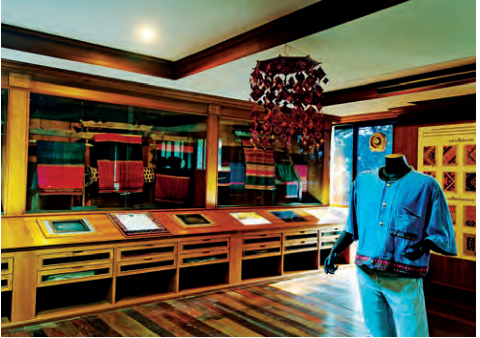
จิพถะภัณฑ์สถานบ้านคูบัว

กะเหรี่ยง จีน ไทยพื้นถิ่น เป็นต้น พิพิธภัณฑ์แห่งนี้ ได้รับรางวัล OTOP ปี ๒๕๔๙ และได้รับรางวัล ชุมชนด้านการท่องเที่ยว ในโครงการประกวดรางวัล อุตสาหกรรมท่องเที่ยวไทย เฉลิมพระเกียรติพระบาท สมเด็จพระปรมินทรมหาภูมิพลอดุลยเดช เนื่องในวโรกาสมหามงคลเฉลิมพระชนมพรรษา ๘๐ พรรษา ของการท่องเที่ยวแห่งประเทศไทย พิพิธภัณฑ์ เปิดทุกวัน เวลา ๐๙.๐๐-๑๖.๐๐ น. (ควรติดต่อล่วงหน้าก่อนเข้าชม) สอบถามข้อมูลได้ที่ ดร.อุดม สมพร โทร. ๐๘ ๑๗๑๓ ๑๙๘๘๙ www.jipathaphan.com การเดินทาง จากตัวอำเภอเมืองราชบุรีใช้ถนน เพชรเกษม เข้าทางหลวงหมายเลข ๓๓๓๘ ประมาณ ๕๐๐ เมตร