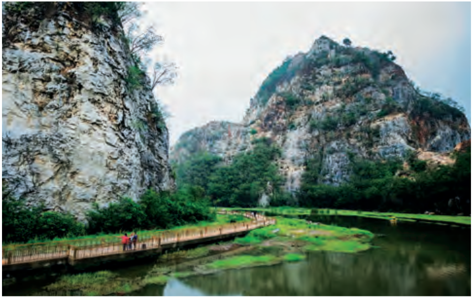
อุทยานหินเขางู

อุทยานหินเขางู หรือพระพุทธรูปถ้ำถ้ำเขางู อยู่ในบริเวณเชิงเขาตำบลเกาะพลับพลา ห่างจากตัวจังหวัดประมาณ ๘ กิโลเมตร ลักษณะเป็นถ้ำหรือศาสนสถานที่เกี่ยวข้องกับพุทธศาสนา ภายในถ้ำพบพระพุทธรูปจำหลักติดผนังถ้ำ พระพุทธรูปถ้ำถ้ำเขางู เป็นพระพุทธรูปนั่งห้อยพระบาท ปางแสดงธรรมเทศนา ตามแบบพุทธศิลป์สมัยทวารวดี (พุทธศตวรรษที่ ๑๑-๑๓) ลักษณะพระพักตร์แบน พระขนงเป็นเส้นนูนโค้งต่อกันเป็นรูปปีกกา ขมวดพระเกศาใหญ่ มีรัศมีเป็นรูปดอกบัวตูม ระหว่างข้อพระบาทมีจารึกอักษรปัลลวะภาษาสันสกฤต อ่านว่า ปญฺจกรมขระศรีสมาธิคุปะเต แปลว่า พระศรีสมาธิคุปะเตเป็นผู้บริสุทธิ์ ด้วยการทำบุญ นับเป็นร่องรอยศิลปะสมัยทวารวดีที่สำคัญอีกแห่งหนึ่ง ภายในถ้ำยังมีพระพุทธรูปหินทรายศิลปะสมัยอยุธยาหลายองค์ บริเวณอุทยานหินเขางู มีสถานที่ที่น่าสนใจ ได้แก่