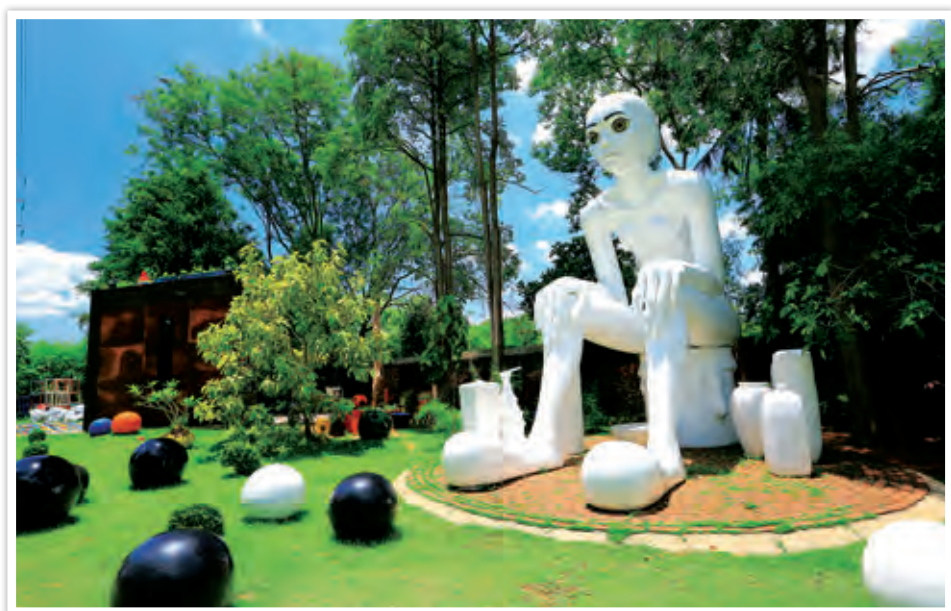
หอศิลป์ร่วมสมัยเจ้า ฮง ไถ่ ดีคูน

หอศิลป์ร่วมสมัยเจ้า ฮง ไถ่ ดีคูน อยู่เลขที่ ๓๒๓ ถนน วรเดช ตำบลหน้าเมือง ไกล่พิพิธภัณฑสถานแห่งชาติ ราชบุรี ริมแม่น้ำแม่กลอง ตัวอาคารสันนิษฐานว่า สร้างปลายรัชสมัยพระบาทสมเด็จพระจุลจอมเกล้า เจ้าอยู่หัว รัชกาลที่ ๕ เป็นเรือนไม้ทรงมะนิลา ใต้ถุนสูง และได้ปรับปรุงเมื่อ ปี พ.ศ. ๒๕๔๘ เป็นอาคาร ๓ ชั้น ได้รับรางวัลอนุรักษ์ศิลปะ สถาปัตยกรรมดีเด่น ประจำปี ๒๕๕๔ สำหรับชื่อ ดีคูน (D Kunt) มาจากภาษาเยอรมัน หมายถึง ศิลปะ โดยเปิดเป็นแกลลอรีงานศิลปะ ตกแต่งสถานที่ด้วย งานเซรามิกจากโรงงานเจ้า ฮง ไถ่ และมีกิจกรรม จัดแสดงงานศิลปะร่วมสมัยหมุนเวียนทุก ๓ เดือน พร้อมจำหน่ายของที่ระลึก เครื่องดื่มและเบเกอรี่ เปิดทุกวัน เวลา ๑๑.๐๐-๒๐.๐๐ น. โทร. ๐ ๓๒๓๒ ๓๖๓๐, ๐ ๓๒๓๓ ๗๕๗๔