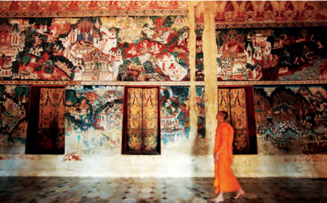
จิตรกรรมฝาผนัง วัดคงคาราม

ที่วัด ท่านจึงมีความคิดที่จะสร้างตัวหนังสือใหญ่ให้มีขนาดใหญ่กว่าเดิม จึงได้ชักชวนครูอึ้งผู้เคยเป็นโขนคณะเจ้าเมืองราชบุรี ช่างจาดและช่างจ๊ะชาวราชบุรี และช่างฟ่งชาวบ้านโป่งมาช่วยกันสร้างตัวหนังสือชุดแรก คือ ชุดหนุมานถวายแหวน ต่อมาได้สร้างเพิ่มอีกรวมเก้าชุด อันเป็นสมบัติของวัดที่ได้รับการรักษาสืบทอดกันมา จึงได้จัดสร้างพิพิธภัณฑสถาน นับเป็นวัดเดียว ที่มีมหรสพของวัด ตัวหนังสือและคณะหนังใหญ่ที่สมบูรณ์อยู่ในความอุปถัมภ์ของวัด และยังคงมีการจัดการแสดงหนังใหญ่สืบทอดต่อมาจนถึงทุกวันนี้ พิพิธภัณฑสถานเปิดให้เข้าชมทุกวัน เวลา ๐๘.๐๐-๑๗.๐๐ น. จัดแสดงเชิดหนังใหญ่ โดยนักเรียนจากโรงเรียนวัดขนอน ทุกวันเสาร์ เวลา ๑๐.๐๐ น. และทุกวันอาทิตย์ เวลา ๑๑.๐๐ น. เพียงรอบเดียว ไม่มี