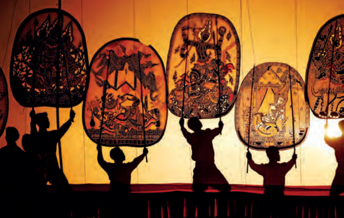
พิพิธภัณฑ์หนังใหญ่วัดขนอน

สร้างด้วยหยกขาวทั้งองค์ อัญเชิญ มาจากสภาพ เมียนมา นอกจากนี้ มีพระพุทธรูปคูวัด คือ พระศรี อารีย์ เป็นพระพุทธรูปเก่าแก่พิมพ์พระศรีอารีย์ซึ่งมี ลักษณะเด่น คือ มีตาลปัตรอยู่ด้านหลังองค์พระพุท ธรูป จีวรจับจีบคล้ายพระพุทธรูป สมัยคันธาระ ภายใน วัดมีต้นสาละที่นำมาจากประเทศอินเดีย และมีการ จัดกิจกรรมเกี่ยวกับพระพุทธศาสนาสำหรับเยาวชน คือ การเข้าค่ายพุทธบุตร และค่ายยุวาทะศิลป์ สอบถามข้อมูล โทร. ๐ ๓๒๒๓ ๒๕๙๕, ๐ ๓๒๒๓ ๑๓๕๑