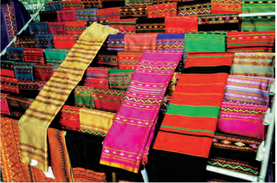
ผ้าซิ่นตีนจก จังหวัดราชบุรี

ผ้าซิ่นตีนจก หัตถกรรมประณีตของชาวไทย-ยวน สามารถชมและซื้อหาได้ที่