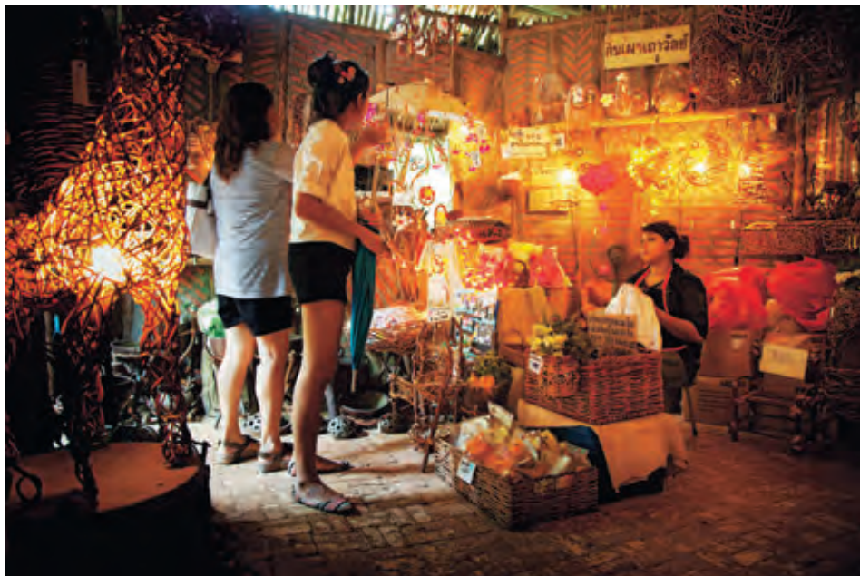
บ้านหอมเทียน

ชายแดน ๑๓๗ ในการ ฝ้าตรวจและควบคุม ภูมิประเทศที่สำคัญปัจจุบัน องค์การบริหารส่วนตำบล ตะนาวศรี ร่วมกับกองร้อยตำรวจตระเวนชายแดน ๑๓๗ ได้พัฒนาภูมิทัศน์ให้เป็นแหล่งท่องเที่ยวเชิงนิเวศและอนุรักษ์ธรรมชาติ ซึ่งสามารถ ชมทัศนียภาพสวยงามของอาณาเขตประเทศไทย และสภาพเมียนมา สภาพพื้นที่เหมาะสำหรับ นักท่องเที่ยว ที่ชื่นชอบการท่องเที่ยวแบบผจญภัย และการเดินทางด้วยรถขับเคลื่อนสี่ล้อ สอบถาม ข้อมูลได้ที่ องค์การบริหารส่วนตำบลตะนาวศรี โทร. ๐ ๓๒๓๙ ๕๔๒๖