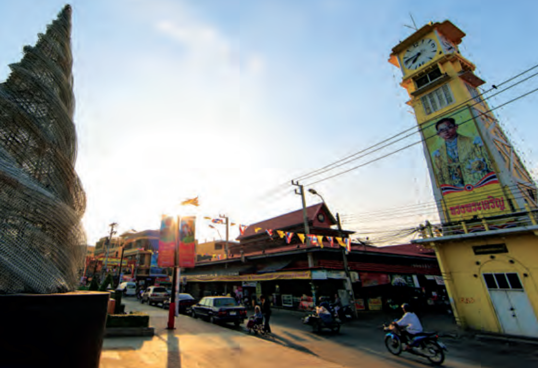
หอนาฬิกาเฉลิมพระเกียรติ

เนื่องในวโรกาสทรงมีพระชนมพรรษา ๘๐ พรรษา วันที่ ๕ ธันวาคม ๒๕๕๐