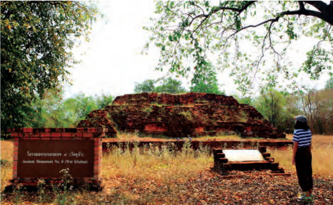
โบราณสถานหมายเลข ๘

โบราณสถานหมายเลข ๘ อยู่ด้านหลังโรงเรียนวัดคูบัว มีลักษณะเป็นฐานเจดีย์ มีแผนผัง รูปสี่เหลี่ยมจัตุรัส ขนาดกว้างยาวด้านละ ๒๐.๘๐ เมตร ความสูง ๕.๔๐ เมตร ฐานชั้นล่างเป็นฐานสี่เหลี่ยมขนาดใหญ่ ก่ออิฐสอปูน ถัดขึ้นไปเป็นฐานบัวโค้งรองรับหน้ากระดานมีช่องซุ้มสี่เหลี่ยมโดยรอบ ด้านบนเป็นลานประทักษิณ ชั้นที่สองเป็นฐานขององค์เจดีย์ มีฐานบัวโค้งรองรับหน้ากระดานซึ่งมีซุ้มสี่เหลี่ยมผืนผ้าขนาดเล็กขององค์เจดีย์ มีร่องรอยของปูนฉาบที่ฐานบัวโค้ง การเดินทาง จากตัวเมืองราชบุรี ไปทางทิศใต้ เข้าทางหลวงหมายเลข ๓๓๓๘ (ราชบุรี-คูบัว) ประมาณ ๕ กิโลเมตร