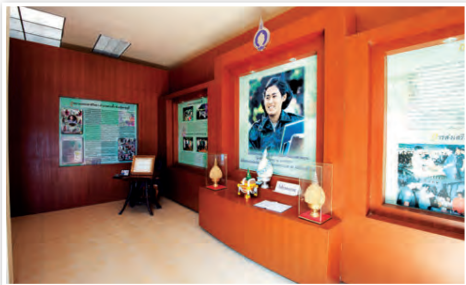
อุทยานธรรมชาติวิทยา

๒๐ บาท เด็ก ๑๐ บาท มีร้านอาหาร ครั้วกไวทย์ อาหารไทยต้นตำรับไทยแท้ และบ้านพักไว้บริการ นักท่องเที่ยว สอบถามข้อมูล โทร. ๐๘ ๑๒๕๕ ๔๕๔๗, ๐๘ ๖๑๗๑ ๘๔๐๐, ๐ ๓๒๒๒ ๑๑๓๙, ๐ ๓๒๓๙ ๕๑๙๒-๔ โทรสาร ๐ ๓๒๓๔ ๒๐๕๓