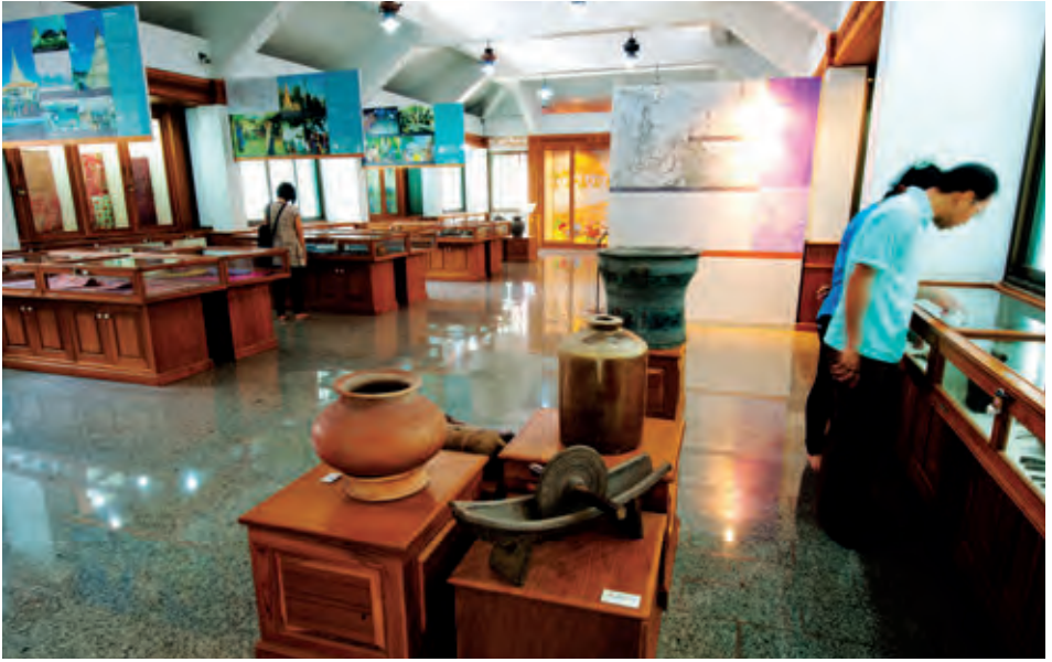
พิพิธภัณฑ์พื้นบ้านวัดม่วง

กับกลุ่มชนอื่น อาทิ ไทย จีน ลาว เวียดนาม และ กะเหรี่ยง มีการผสมผสานแลกเปลี่ยนวัฒนธรรมระหว่างกัน เกิดเป็นเอกลักษณ์ของคนในท้องถิ่น และ ความที่ชุมชนบ้านม่วงมีวิถีชีวิตผูกพันกับประเพณี และความเชื่อดั้งเดิม ทำให้ชุมชนแห่งนี้เป็นชุมชนที่ร่ำรวยทางความรู้ด้านมรดกศึกษามากมาย พิพิธภัณฑ์แห่งนี้ เป็นแหล่งรวบรวมประวัติความเป็นมา วิถีชีวิต และวัฒนธรรมชุมชนท้องถิ่นชาวมอญตั้งแต่อดีต ถึงปัจจุบัน แบ่งการจัดแสดงเป็นห้องเพื่อร้อยเรียง เรื่องราวให้เข้าใจได้ง่ายเริ่มจาก ห้องโถง มอญใน ตำนาน มอญในทางประวัติศาสตร์ ภาษามอญและ จารึกภาษามอญ ประเพณีวัฒนธรรมมอญ มอญ อพยพ มอญในไทย และผู้นำทางวัฒนธรรม มีการ จัดแสดงโบราณวัตถุ คัมภีร์ใบลานที่เขียนด้วยอักษร มอญมีอายุกว่า ๓๐๐ ปี เสื้อผ้าข้าวของเครื่องใช้ต่าง ๆ ที่บ่งบอกถึงมรดกทางภูมิปัญญาท้องถิ่นที่น่าสนใจ