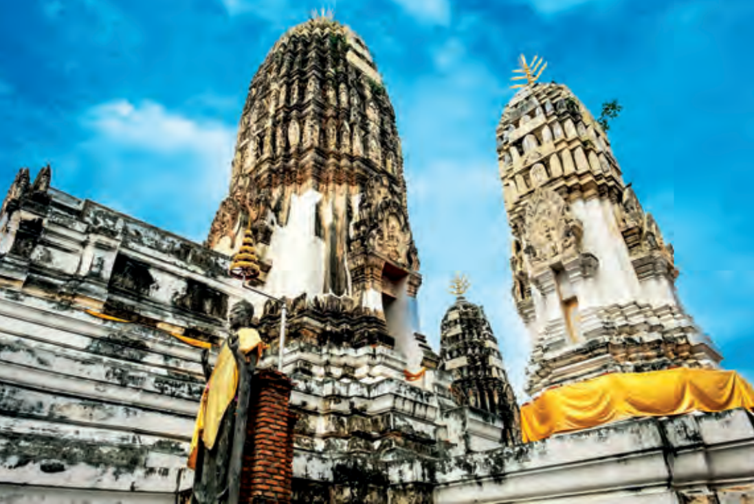
วัดมหาธาตุวรวิหาร

อยุธยา ราวพุทธศตวรรษที่ ๒๐-๒๑ ดังปรากฏรูปแบบสถาปัตยกรรมปัจจุบันซ้อนทับ ภายในวัดมีสิ่งที่น่าสนใจ ได้แก่