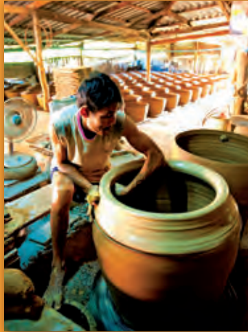
การปั้นโอ่งมังกร