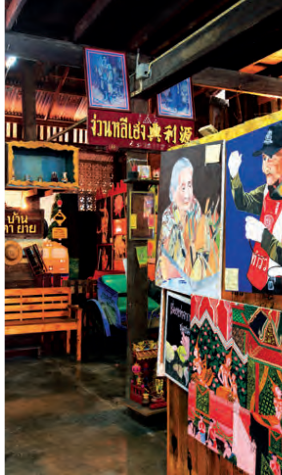
ตลาดเก่าเจ็ดเสมียน

การเดินทาง จากตัวเมืองราชบุรีมาตามถนนเพชรเกษม ระยะทางประมาณ ๒๐ กิโลเมตร เลี้ยวขวาไปตามทางหลวงหมายเลข ๓๒๐๖ กิโลเมตรที่ ๓๘ (บ้านท่ายาง-บ้านหินสี) ระยะทางประมาณ ๔๕ กิโลเมตร เลี้ยวซ้ายเข้าบ้านไทยประจัน ระยะทาง ๕ กิโลเมตร ถึงที่ทำการอุทยานแห่งชาติเฉลิมพระเกียรติไทยประจัน