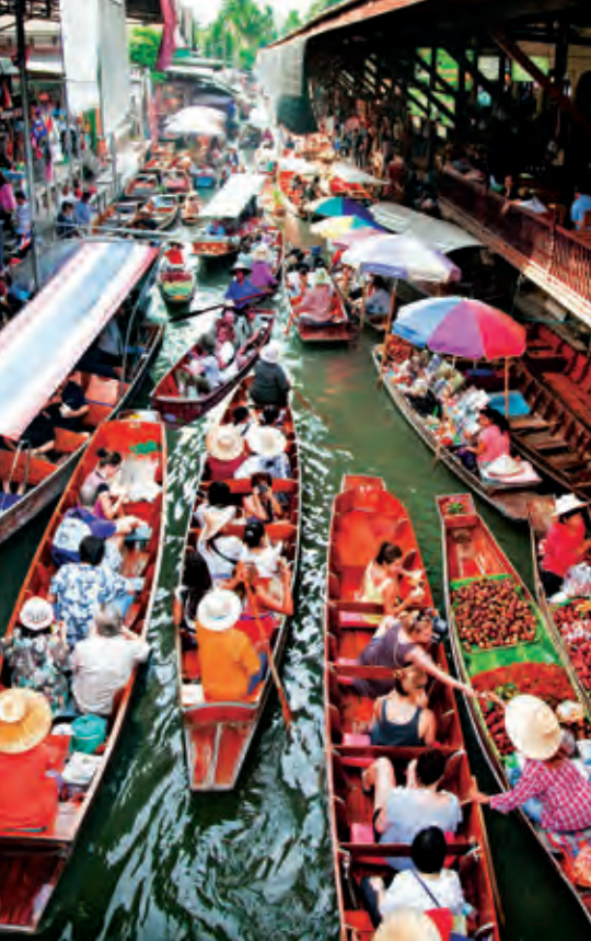
ตลาดน้ำดำเนินสะดวก

วัดหลวงพ่อดธรรมกายาราม อยู่ที่ตำบลแพงพวย ภายใต้วัดมีพระอุโบสถสร้างในสมัยอยุธยาตอนปลาย และเป็นທີ່เก็บรักษาพระพุทธรูปหยกปางต่าง ๆ ภายในวัดมีอุทยานการศึกษา และสวนป่าถาวรเฉลิมพระเกียรติฯ พื้นที่กว่า ๒๐๐ ไร่ วัดนี้ได้รับรางวัลสวนป่าดีเด่นจากกรมป่าไม้ ประจำปี ๒๕๓๙ นอกจากนี้ เป็นสำนักเรียนภาษาบาลีประจำจังหวัด มีนิตยสารเกี่ยวกับพระบรมสารีริกธาตุ และการสอนปฏิบัติธรรมสำหรับชาวไทยและชาวต่างชาติ ทุกวันอาทิตย์ เวลา ๐๙.๓๐-๑๔.๓๐ น. และมีการอบรมธรรมะปฏิบัติและกิจกรรมเกี่ยวกับธรรมะตลอดทั้งปี สอบถามข้อมูล โทร. ๐๙ ๐๕๙๕ ๕๑๖๒, ๐๙ ๐๕๙๕ ๕๑๖๔ www.dhammadakya.org