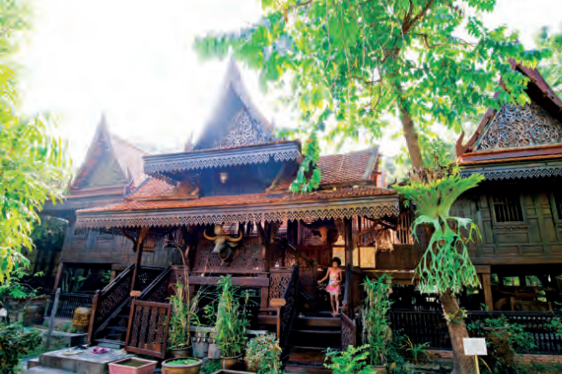
พิพิธภัณฑ์ทอไทย

บ้าน และสินค้าท้องถิ่นคุณภาพ พร้อมทั้งอาหารไทย อาหารนานาชาติ และบริการบ้านพักแบบวิลล่า เปิด วันจันทร์-ศุกร์ เวลา ๑๐.๐๐-๑๘.๐๐ น. วันเสาร์-อาทิตย์ เวลา ๐๘.๓๐-๘.๓๐ น. ค่าเข้าชม ผู้ใหญ่ ๕๐ บาท เด็กสูงไม่เกิน ๑๒๐ เซนติเมตร ๓๐ บาท สอบถามข้อมูล โทร. ๐๘ ๑๐๐๐ ๖๖๗๗