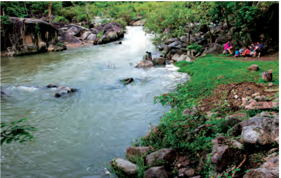
แก่งส้มแมว

เขากะโจม อยู่ที่ตำบลสวนผึ้ง บริเวณฐานปฏิบัติการตำรวจตระเวนชายแดน สุดชายแดนประเทศไทยทางภาคตะวันตก สูงจากระดับน้ำทะเล ๑,๐๐๐ เมตร สามารถขึ้นไปชมบรรยากาศทะเลหมอกที่สวยงามยามเช้าซึ่งคล้ายกับบรรยากาศบนดอยทางภาคเหนือ ควรเดินทางไปถึงในช่วงเช้ามีเวลาประมาณ ๐๕.๐๐-๐๖.๐๐ น. เพื่อรอชมทะเลหมอก และพระอาทิตย์ขึ้น ระหว่างเส้นทางจะผ่านพื้นที่ป่าอุดมสมบูรณ์ และข้างจากเขาสามารถจอดรถแวะเดิน