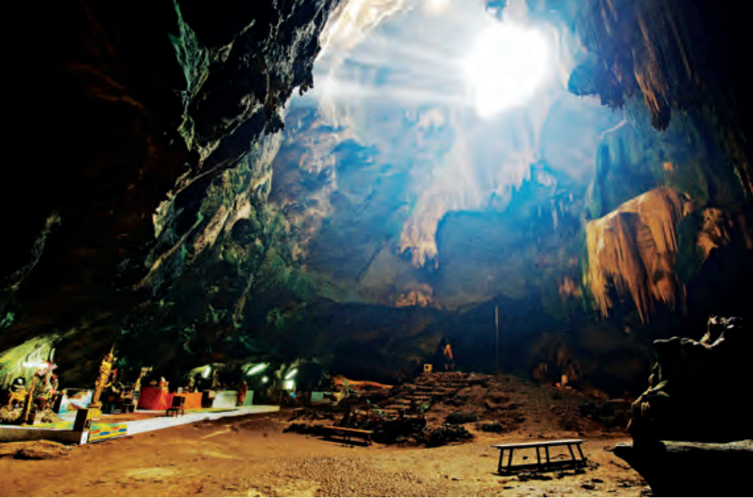
ถ้ำจอมพล

สอบถามข้อมูล โทร. ๐๘ ๑๐๑๓ ๓๓๑๐, ๐๘ ๑๔๐๐ ๔๐๔๔