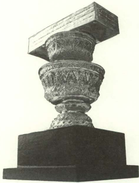
สี่บาน สลักสลัก วรรณกรรมการเพื่อ