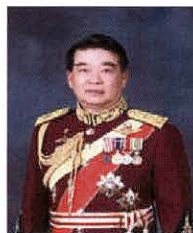
พลเอก อุดมเดช อินทะพงษ์ กรรมการ