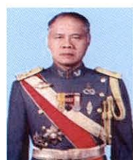
พลเอก อู๊ด เบื้องบน ที่ปรึกษาคณะกรรมการ