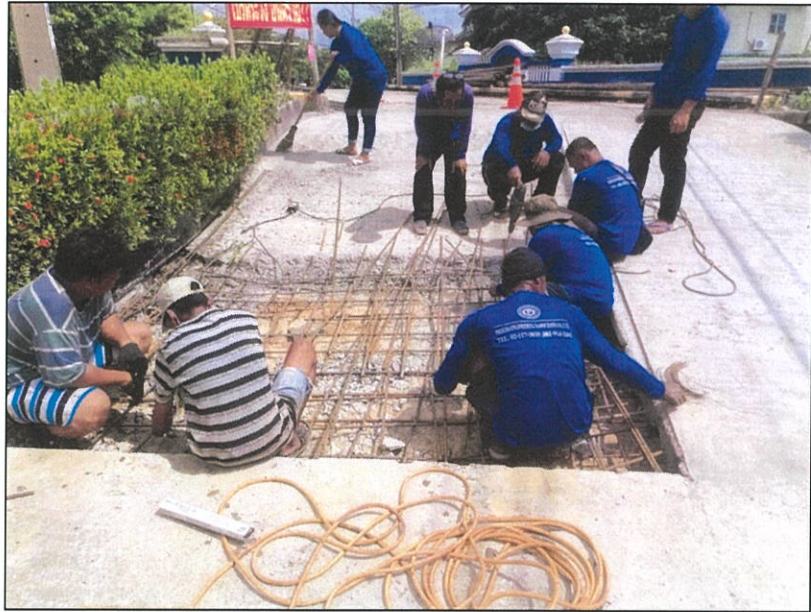
ภาพถ่ายการแก้ไขซ่อมแซมพื้นคอนกรีตบริเวณหมู่บ้านสิรินดา