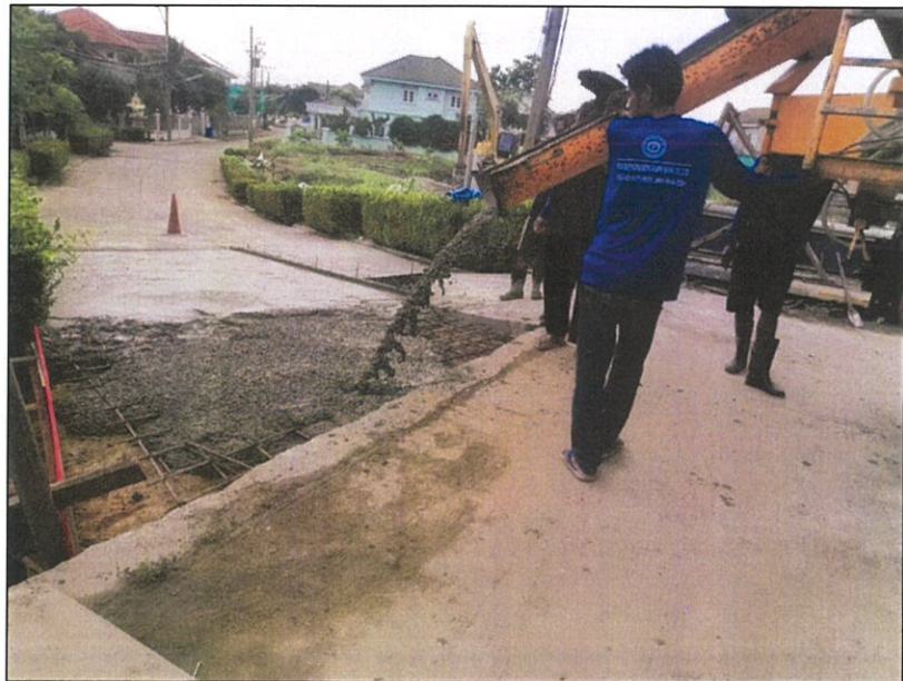
ดำเนินการแก้ไขซ่อมพื้นคอนกรีตที่ชำรุดทรุดตัว