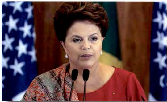
นางดิลมา รุสเซฟ

วันที่ ๑ กันยายน ๒๕๕๙ รัฐบาลประเทศเวเนซุเอลา มีปฏิกิริยาตอบโต้ทันทีหลังจากวุฒิสภาของบราซิล ลงมติถอดถอน นางดิลมา รุสเซฟ ออกจากตำแหน่งประธานาธิบดีของประเทศบราซิล โดยกระทรวงการต่างประเทศเวเนซุเอลา ได้แถลงการณ์ไม่เห็นด้วยกับการถอดถอนดังกล่าว เนื่องจากถือได้ว่าเป็นการรัฐประหารในรัฐสภา พร้อมตั้งระงับความสัมพันธ์ทางการเมืองและการทูต ด้วยการเรียกตัวเอกอัครราชทูตประจำประเทศเวเนซุเอลาในประเทศบราซิลกลับประเทศ เช่นเดียวกับ รัฐบาลเอกวาดอร์และโบลิเวีย ที่เรียกตัวเอกอัครราชทูตกลับแล้วเช่นกัน