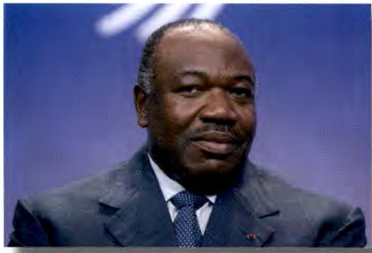
นายอาลี บองโก ออนดิมบา

วันที่ ๑ กันยายน ๒๕๕๙ นายอาลี บองโก ออนดิมบา ประธานาธิบดีของประเทศกาบองคนปัจจุบัน ได้รับชัยชนะในการเลือกตั้งครั้งล่าสุดเมื่อวันที่ ๓๑ สิงหาคม ๒๕๕๙ โดยได้รับคะแนนเสียงเลือกตั้งอยู่ที่ ๔๙.๘ เปอร์เซ็นต์ ในขณะที่ ฌ็อง ปิง ผู้สมัครจากพรรคฝ่ายค้านนั้นได้ ๔๘.๒๓ เปอร์เซ็นต์ ซึ่งชนะคู่แข่งจากพรรคฝ่ายค้านไปด้วยคะแนน ๑.๕๗ เปอร์เซ็นต์ เท่านั้น ส่งผลให้มีประชาชนจำนวนมากไม่พอใจผลการเลือกตั้ง จึงได้เดินขบวนไปยังรัฐสภาในกรุงลิเบรอวิลล์ เมืองหลวงของประเทศ