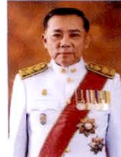
พลตำรวจเอก เอก อังสนานนท์ กรรมการธิการ