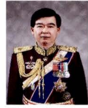
พลเอก อุดลยเดช อินทะพงษ์ กรรมการธิการ