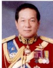
พลเอก อรุณ สมตบ กรรมการธิการ