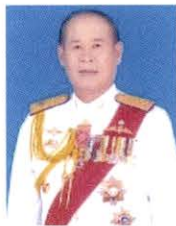
พลตรี จารึก อารีราชการัณย์ กรรมการและที่ปรึกษา