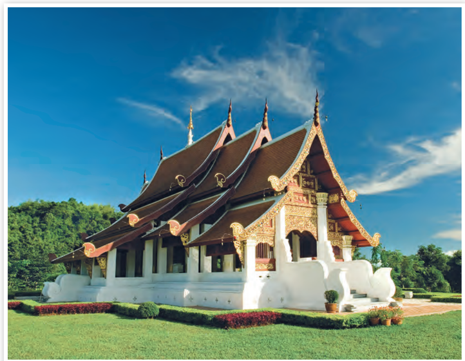
วิหารพระเจ้าล้านทอง

เส้นผ่าศูนย์กลางได้ ๒ เมตร ความสูง ๙ เมตร รวม ๙ องค์ สอบถามข้อมูล โทร. ๐ ๕๓๙๑ ๘๒๔๑, ๐๘ ๙๙๙๙ ๓๖๔๔