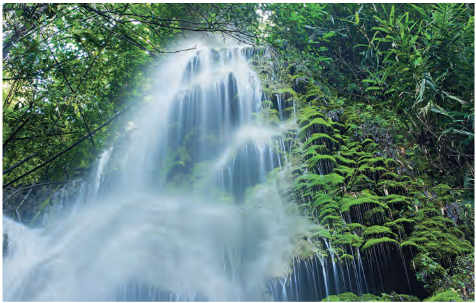
น้ำตกปูแกง

การเดินทาง จากอำเภอเมืองเชียงรายมาตามถนนสายเชียงราย-แม่จัน ๑๑ กิโลเมตร แล้วต่อด้วยทางหลวงหมายเลข ๑๒๐๙ อีก ๒๙ กิโลเมตร สอบถามข้อมูล โทร. ๐ ๕๓๙๑ ๘๒๓๔