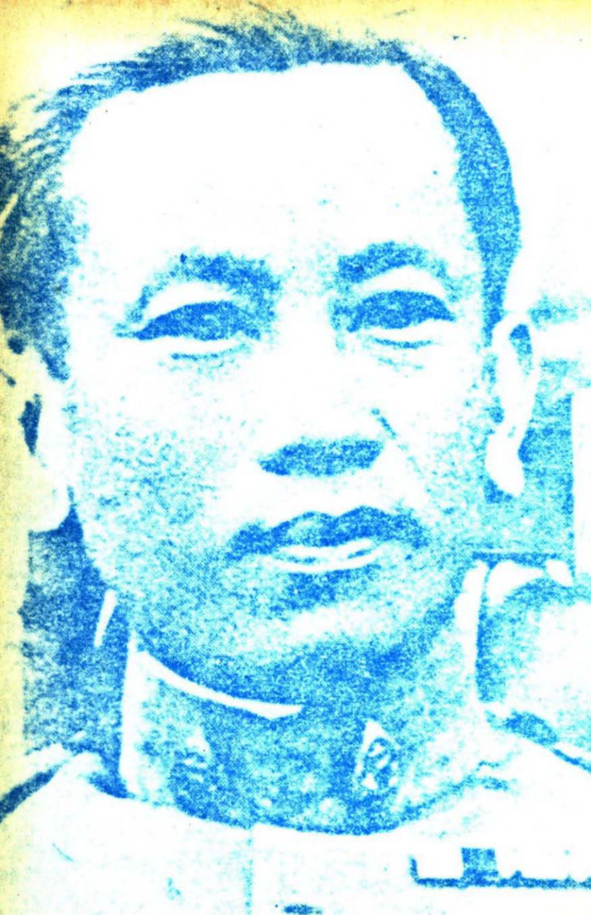
ท.อ. พระบาททรงสุระเดช