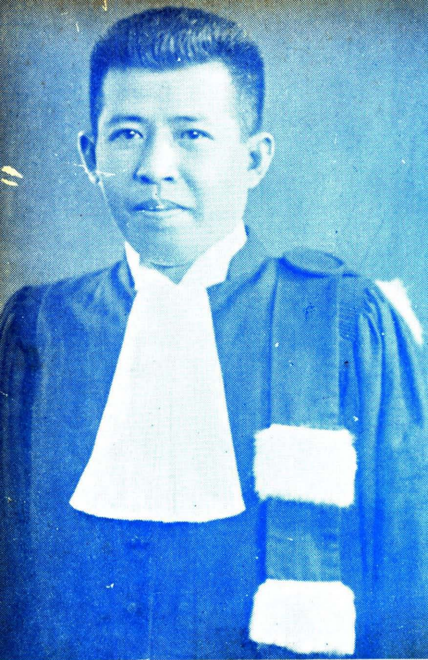
นายปรีดี พนมยงค์ ผู้ร่างเค้าโครงการเศรษฐกิจ