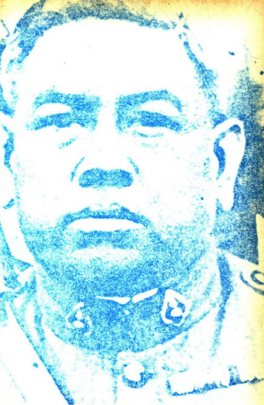
พ.อ. พระยาพหลพลพยุหเสนา