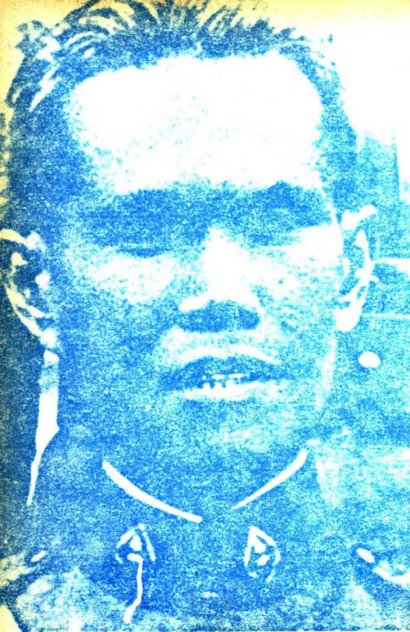
พ.อ. พระบาทช็อกเนย์