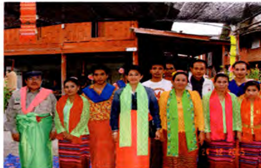
ชุมชนบางกระดี