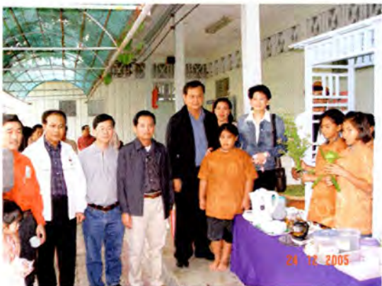
โรงเรียนพิทยาลงกรณ์ เขตบางขุนเทียน

จากการเดินทางไปศึกษาข้อเท็จจริงด้านการท่องเที่ยวเชิงเกษตรและวัฒนธรรม ของคณะอนุกรรมการการท่องเที่ยวกรุงเทพมหานคร และปริมณฑล ณ พื้นที่เขตบางขุนเทียน กรุงเทพมหานคร เมื่อวันที่ ๒๔ ธันวาคม ๒๕๔๘ นั้น คณะอนุกรรมการมีข้อสังเกตและข้อเสนอแนะเพื่อประกอบการพิจารณาเป็นแนวทางในการแก้ไขปัญหา และการจัดการด้านการท่องเที่ยว โดยสรุปดังนี้