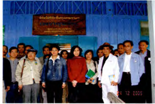
พิพิธภัณฑ์ท้องถิ่นกรุงเทพมหานคร