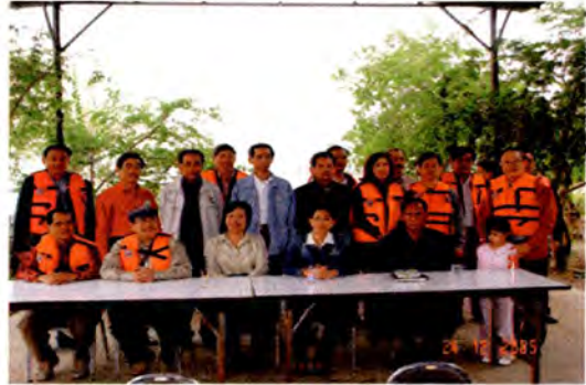
ชุมชนแสนตอ