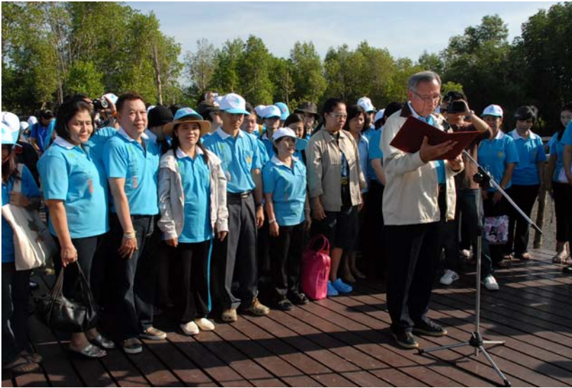
ปลูกป่าชายเลนเฉลิมพระเกียรติ พระบาทสมเด็จพระเจ้าอยู่หัวและสมเด็จพระนางเจ้าพระบรมราชินีนาถ วันอังคารที่ ๒๗ ตุลาคม ๒๕๕๒ ณ ศูนย์อนุรักษ์ทรัพยากร ทางทะเลและชายฝั่งที่ ๒ ต.โคกคราม อ.เมือง จ.สมุทรสาคร