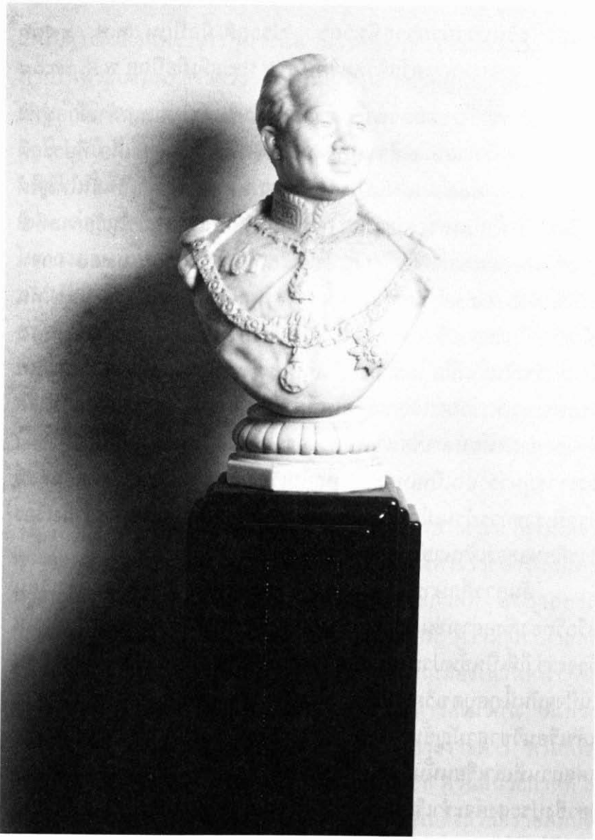
พระรูปสมเด็จพระเจ้าบรมวงศ์เธอ กรมพระยาเทวะวงศ์วโรปการฯ สลักด้วยหินอ่อน เมื่อปี พ.ศ. ๒๔๖๕ ปัจจุบันประดิษฐานอยู่ ณ ห้องเทวะวงศ์ กระทรวงการต่างประเทศ วังสราญรมย์