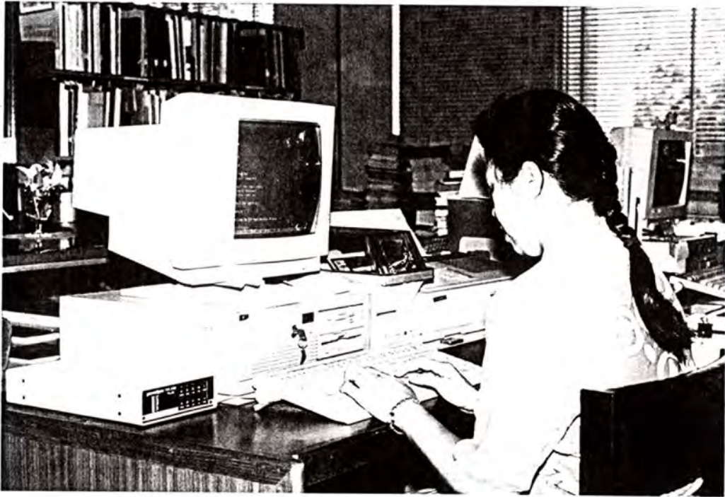
การสืบค้นข้อมูลโดยการ ON-LINE และการ TRANSFER ข้อมูล