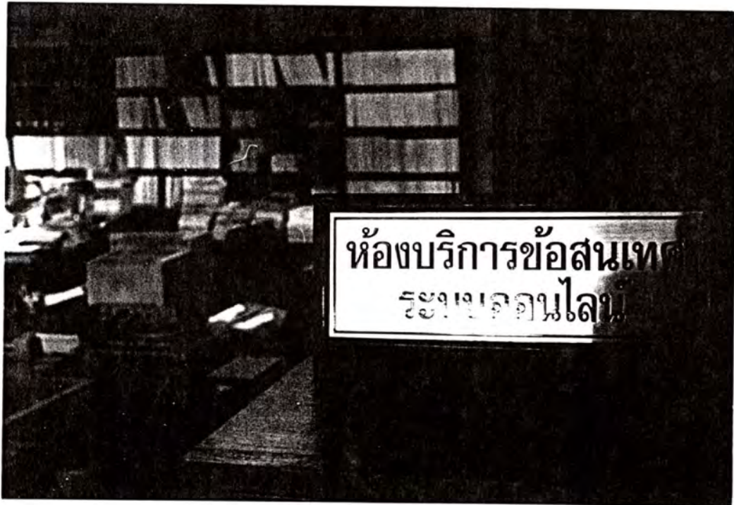
ห้องบริการข้อเสนอแนะระบบออนไลน์ ตั้งอยู่ห้องสมุด 1 ชั้น 1 อาคารรัฐสภา 1