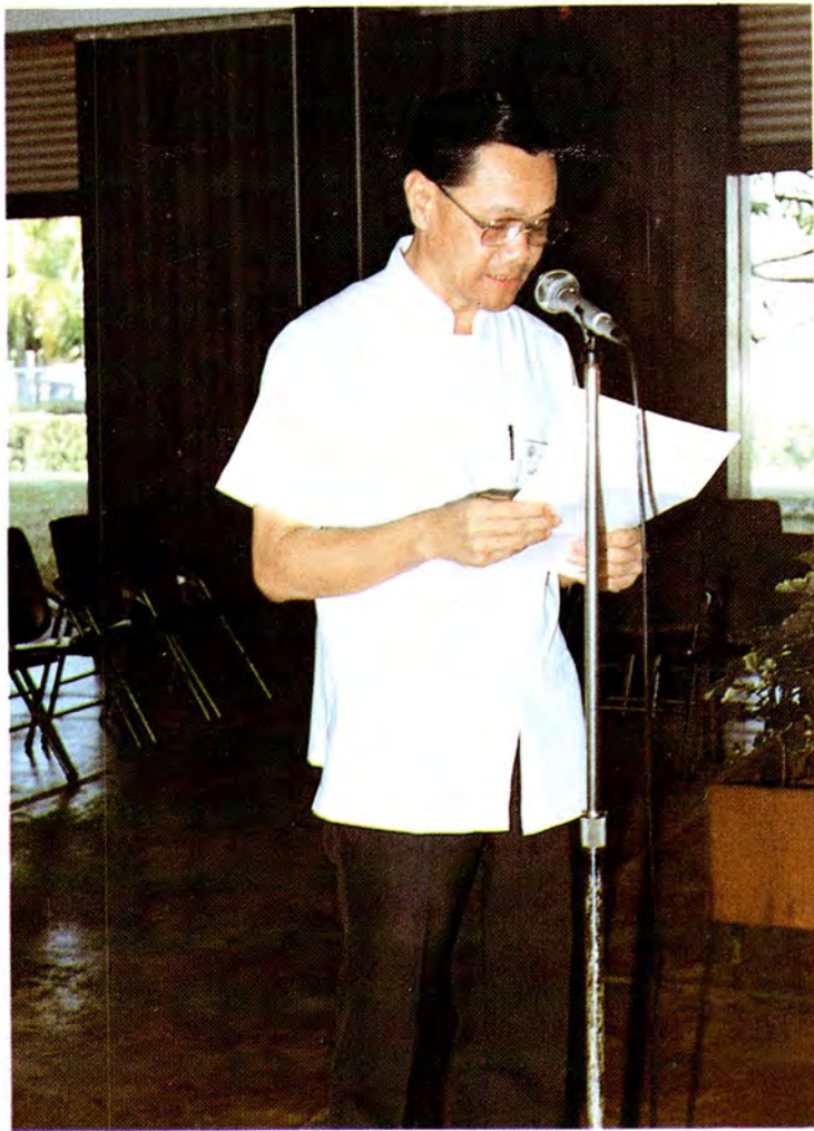
รองปลัดกระทรวงยุติธรรม (ฝ่ายวิชาการ) กล่าวรายงานในพิธีเปิดการสัมมนา