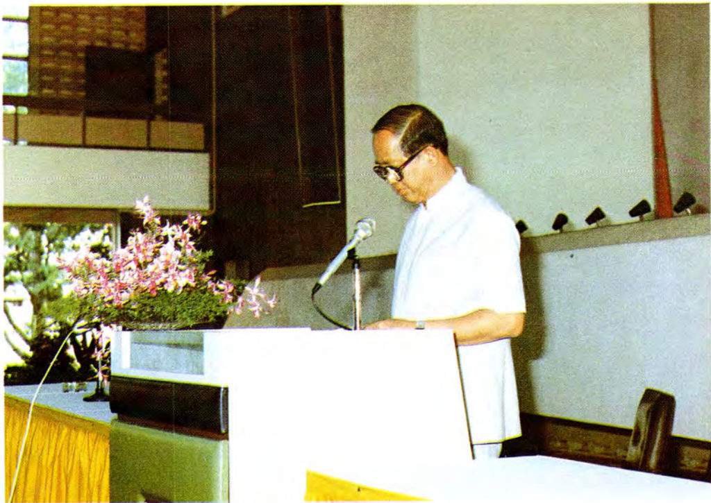
รัฐมนตรีว่าการกระทรวงยุติธรรมกล่าวเปิดการสัมมนา