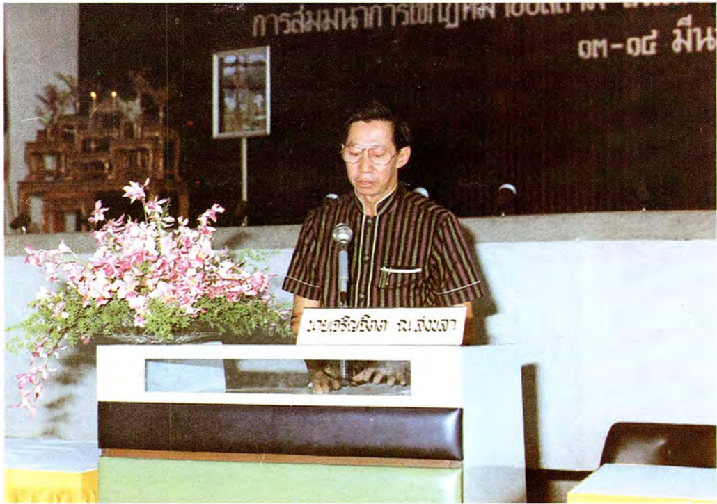
ผู้อำนวยการศูนย์อำนวยการบริหารจังหวัดชายแดนภาคใต้ บรรยายในที่ประชุมสัมมนา