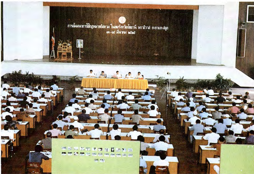
การประชุมกลุ่มใหญ่