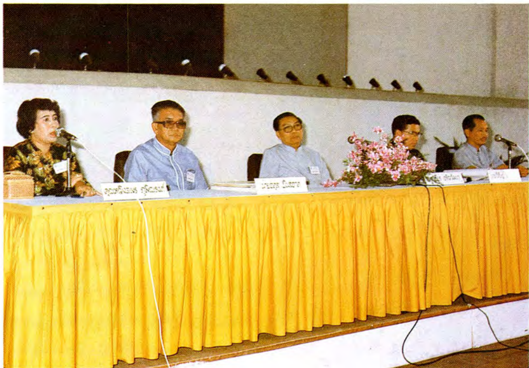
การอภิปรายเรื่อง “การใช้กฎหมายอิสลามและบทบาทของคณะตุ้ะยุติธรรม”