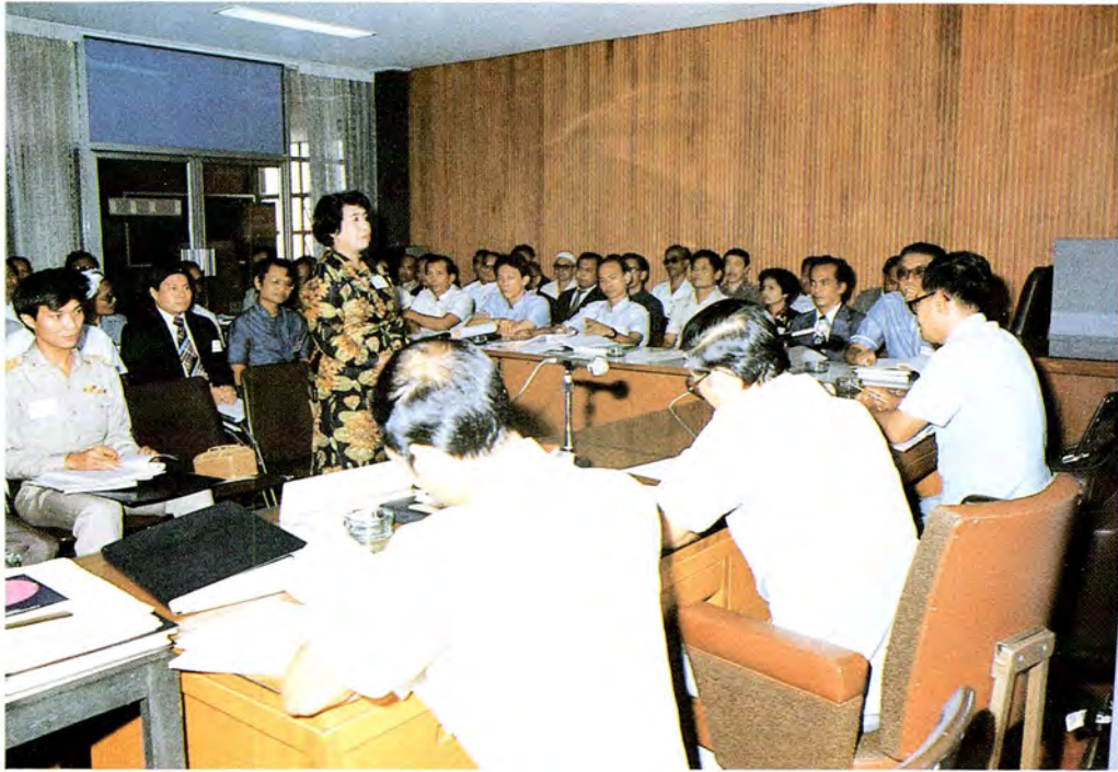
การประชุมกลุ่มย่อย