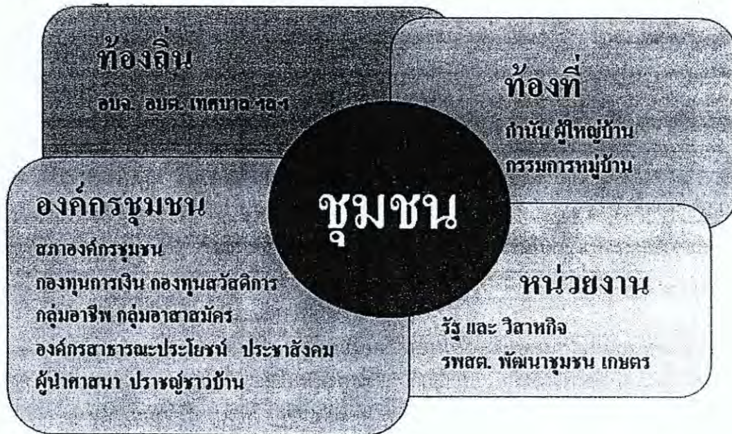
แผนภูมิที่ ๒ แสดงจุดพลังในการขับเคลื่อนชุมชน

๒.๑.๖.๕ อาจารย์ไพบูลย์ วัฒนศิริธรรม ได้อธิบายถึงองค์ประกอบของชุมชน ที่มีผลต่อชุมชนเข้มแข็งเรียกว่าเป็น “จุดพลัง” ในการขับเคลื่อนชุมชน ดังแผนภูมิ