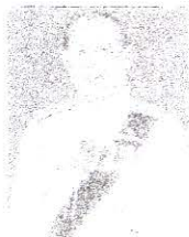
พลตรี จารึก อารีราชการณย์ กรรมการและที่ปรึกษา