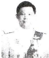
พลตำรวจเอก พงศพัศ พงษ์เจริญ โฆษกคณะกรรมการ