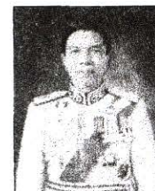
พลเอก วีรณ ฉันทศาสตร์โกศล กรรมการและที่ปรึกษา