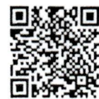
เอกสารประกอบ การพิจารณา สำนักวิชาการ