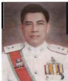
พลตำรวจตรี เกริก กัดยามมิตร ประธานที่ปรึกษาคณะกรรมการ