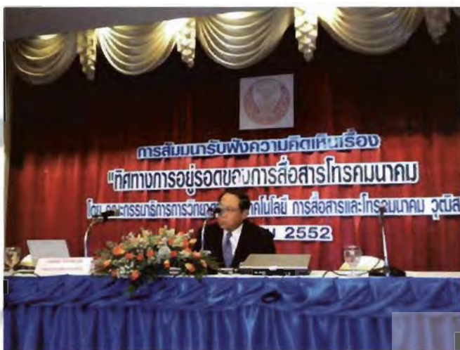
ภาพ : นายนิคม ไวยรัชพานิช รองประธานวุฒิสภา คนที่หนึ่ง กล่าวเปิดการสัมมนา รับฟัง ความคิดเห็น เรื่อง "ทิศทาง การอยู่รอดของการสื่อสาร โทรคมนาคม"

ซึ่งประเด็นทั้ง ๘ ข้อที่อนุกรรมการได้พิจารณาจะมีรายละเอียดอยู่ในเอกสารที่ได้แจกให้ทุกท่านได้ร่วมแสดงความคิดเห็นในที่สัมมนาแล้ว คณะกรรมการมีความประสงค์จะให้ท่านที่มาร่วมประชุมสัมมนา รับฟังความคิดเห็นครั้งนี้ได้เสนอแนวคิดโดยอิสระเพื่อสะท้อนปัญหาได้อย่างถูกต้องและชัดเจน คณะกรรมการจะได้รวบรวมและนำมาสรุปวิเคราะห์เชิงวิชาการเพื่อจะได้ข้อเท็จจริงนำเสนอต่อวุฒิสภา ให้ความเห็นชอบในการดำเนินการตามความเหมาะสมต่อไป ทั้งนี้เพื่อประโยชน์ต่อเศรษฐกิจโดยรวมของประเทศชาติ