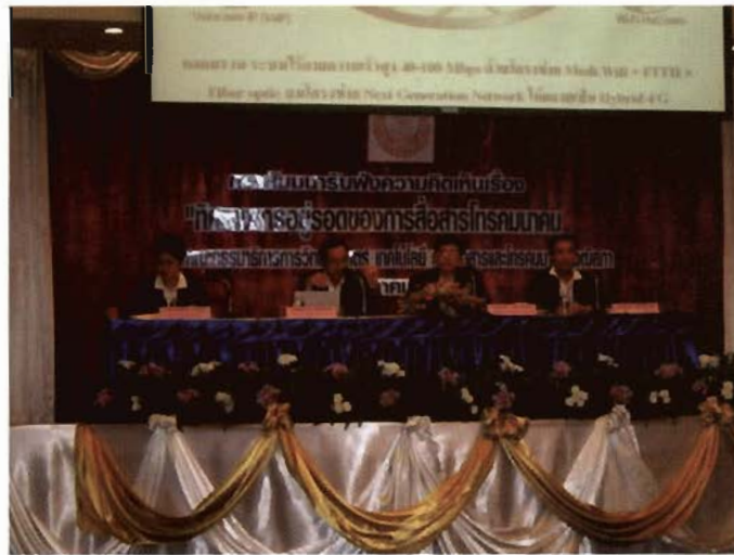
ภาพ : บรรยากาศภายในห้องสัมมนา

๙. รายงานการสัมมนาฯ ครั้งนี้จะทำไปประกอบเป็นข้อมูลส่วนสำคัญของรายงานการพิจารณาศึกษาของคณะกรรมการฯ เพื่อเสนอเข้าสู่ที่ประชุมวุฒิสภาให้ความเห็นชอบเพื่อส่งไปยังรัฐบาลเพื่อดำเนินการโดยด่วนต่อไป