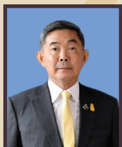
พลเอก นิวัฒน์ มินโยธิน