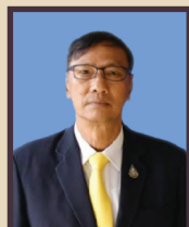
พลเอก ชูศักดิ์ เมฆสุวรรณ