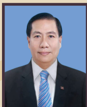
พลเอก มารุต ปิงโหวตสิงห์