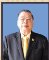
พันตำรวจตรี ยงยุทธ สารสมบัติ