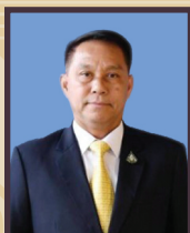
พลตำรวจเอก เดชนรงค์ สุทธิชาญบัญชา