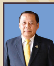
พลเรือเอก ศักดิ์สิทธิ์ เชิดบุญเมือง