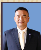
พลเอก บุญธรรม โอริส