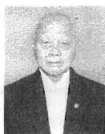
พลเอก อู๊ด เบื้องบน ที่ปรึกษาคณะกรรมาธิการ