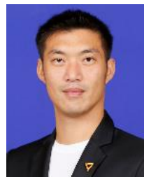
นายธนาธร จิงรุ่งเรืองกิจ ที่ปรึกษาคณะกรรมาธิการ