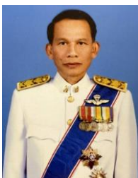
ศาสตราจารย์โกวิทย์ พวงงาม