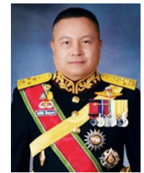
พลเอก กิตติทัศน์ เปี่ยมสุวรรณ์