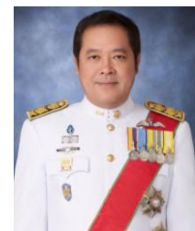
พันตำรวจเอก ทวี สอดส่อง รองประธานคณะกรรมการ คนที่สิบสอง