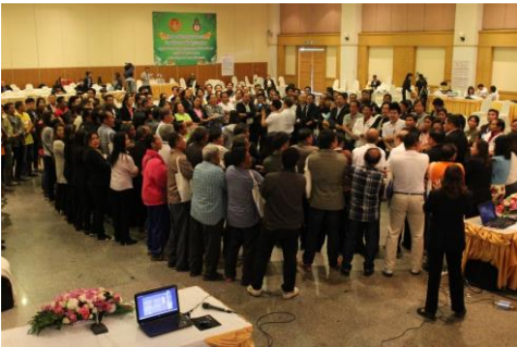
จัดขึ้นเมื่อวันที่ ๒๒ - ๒๓ มกราคม ๒๕๕๘ ณ โรงแรมเพชรรัตนการ์เด็นท์ จังหวัดร้อยเอ็ด