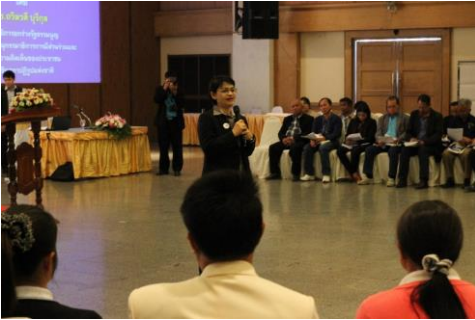
จัดขึ้นเมื่อวันที่ ๑๗ - ๑๘ มกราคม ๒๕๕๘ ณ โรงแรมสองพันบุรี จังหวัดสุพรรณบุรี