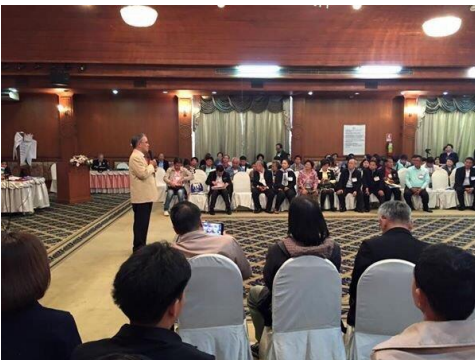
จัดขึ้นเมื่อวันที่ ๒๙ - ๓๐ มกราคม ๒๕๕๘ ณ โรงแรมเชียงใหม่ภูคำ จังหวัดเชียงใหม่