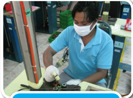
เครื่องดึงชิ้นงานแรงลม

ไม้เนื้อแข็ง ขนาดยาว – สันตามลักษณะงานปากกาเหล็กหนีบโดยใช้แผ่นยางติดไว้ที่ปากหนีบ เพื่อป้องกันการขูดลวดทองแดงหลุดออก นำไม้เนื้อแข็งหรือไม้หน้าสามมาประกบเป็นลักษณะตัวหนีบโดยยึดติดกับแผ่นไม้ด้านล่างเพื่อรองนั่งและเป็นตัวพยุงและรับแรงดึงนำคอร์