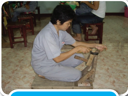
ปากกาจับชิ้นงานจากไม้