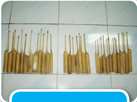
เข็มดิ่งลวดทองแดงทำจากไม้ไผ่

วัสดุที่ใช้ทำไม้ไผ่ (ลำขนาดเล็ก - ใหญ่ ตามลักษณะงานที่ใช้) ตัดตามความยาวประมาณ 6 นิ้ว ปลายมีความยาวประมาณ 6 นิ้ว ส่วนปลาย