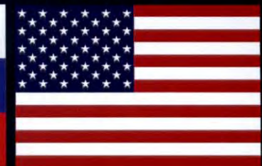
สหรัฐอเมริกา