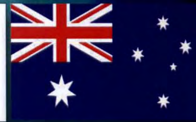
เครือรัฐออสเตรเลีย