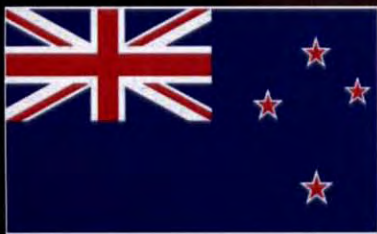
ประเทศนิวซีแลนด์