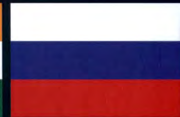
สหพันธรัฐรัสเซีย