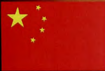
สาธารณรัฐประชาชนจีน