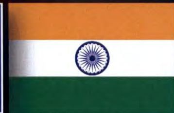
สาธารณรัฐอินเดีย