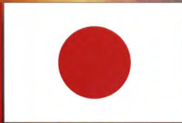
ประเทศญี่ปุ่น