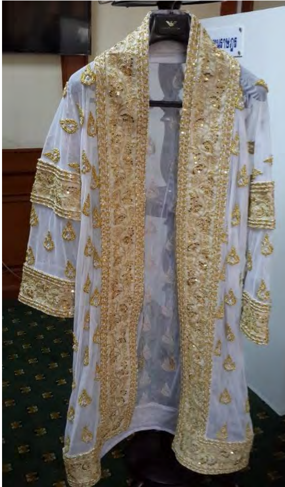
แผนภาพที่ ๗ ชุดครุยประธานรัฐสภาชุดใหม่