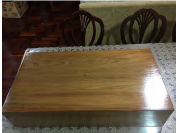
ภาพที่ 8 กล่องใส่เสื่อครุยประธานรัฐสภา

“กล่องไม้สักสำหรับเก็บชุดครุยประธานรัฐสภาตัวกล่อง ทำสีไม้ธรรมชาติ มีฝา ปิด - เปิดได้ ด้านบนฝากล่องติดตราครุฑ สีทอง ด้านในบุผ้ากำมะหยี่สีแดง ขนาดของกล่อง กว้าง ๘๕ ซม. ลึก ๔๕ ซม. สูง ๑๙ ซม.”