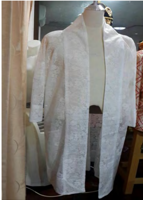
แผนภาพที่ ๒ โคร่งเสื้อครุยเนื้อผ้าลายตราพริกไทย สีขาว

ต่อมาเลขาธิการสภาผู้แทนราษฎร ได้ลงนามในคำสั่งสำนักงานเลขาธิการสภาผู้แทนราษฎร ที่ ๑๕๘๗/๒๕๖๐ ลงวันที่ ๒๒ กันยายน ๒๕๖๐ แต่งตั้งคณะกรรมการตรวจรับพัสดุ ให้มีอำนาจและหน้าที่ทำการตรวจรับพัสดุให้เป็นไปตามเงื่อนไขของใบสั่งจ้าง และดำเนินการตรวจรับพัสดุพร้อมรายงานผลการพิจารณาให้แล้วเสร็จภายใน ๓ วันทำการ นับถัดจากวันที่ผู้รับจ้างส่งมอบพัสดุ ทั้งนี้ผู้จัดสร้างเสื้อครุยประธานรัฐสภา ได้ส่งมอบให้กับคณะกรรมการตรวจรับพัสดุตามกำหนด เมื่อวันที่ ๒๓ มกราคม ๒๕๖๑