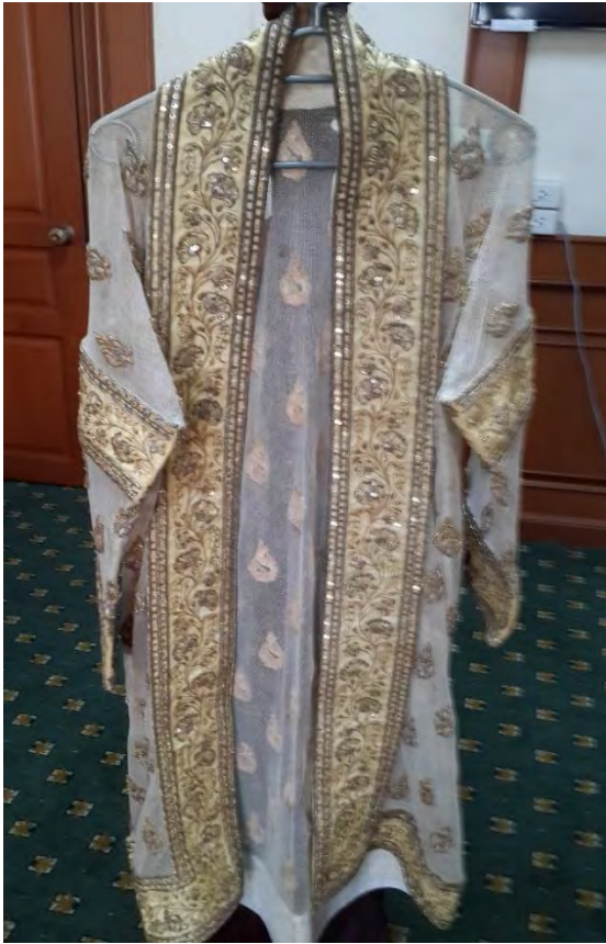
แผนภาพที่ ๑ ชุดครุยประธานรัฐสภาชุดแรกที่ชำรุดเสียหาย

ต่อมาในสมัย ศาสตราจารย์พิเศษพรเพชร วิชิตชลชัย ประธานสภานิติบัญญัติแห่งชาติ ทำหน้าที่ประธานรัฐสภา ได้มีดำริให้สำนักงานเลขาธิการสภาผู้แทนราษฎรดำเนินการจัดสร้างเสื้อครุยประธานรัฐสภาใหม่แทนตัวเก่าซึ่งชำรุดเนื่องจากใช้งานมานาน