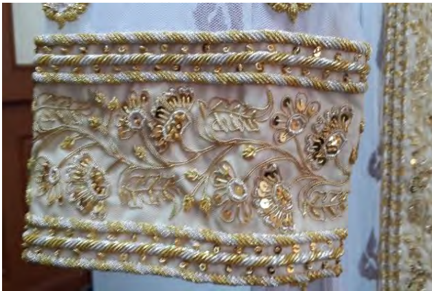
แผนภาพที่ ๖ ลวดลายที่จัดสร้างแล้วเสร็จ