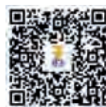
ครั้งที่ ๑๐