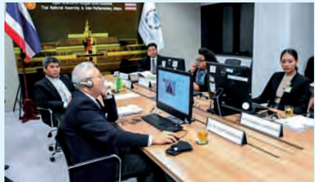
คณะผู้แทนรัฐสภาไทยเข้าร่วมการประชุมคณะมนตรีบริหารสหภาพรัฐสภา ครั้งที่ ๒๐๖ (สมัยวิสามัญผ่านสื่ออิเล็กทรอนิกส์)

รัฐสภาของแต่ละประเทศจะสามารถจัดตั้งหน่วยประจำชาติในสหภาพรัฐสภาขึ้นได้เพียงหน่วยเดียวเท่านั้น การเข้าร่วมเป็นสมาชิกของสหภาพรัฐสภาจะต้องแสดงเจตจำนงและรับข้อผูกพันตามธรรมนูญแห่งสหภาพรัฐสภา คณะมนตรีบริหารสหภาพรัฐสภาจะทำหน้าที่พิจารณาคำขอเข้าร่วมเป็นสมาชิกและคำขอกลับเข้าเป็นสมาชิกในสหภาพรัฐสภา และคำขอเข้าร่วมเป็นผู้สังเกตการณ์ในสหภาพรัฐสภา รวมทั้งพิจารณาสมาชิกภาพในสหภาพรัฐสภาตามสถานการณ์ปัจจุบันของแต่ละประเทศ เพื่อระงับหรือเพิกถอนสมาชิกภาพดังกล่าวตามที่คณะกรรมการบริหารสหภาพรัฐสภานำเสนอ