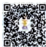
ครั้งที่ ๙