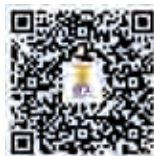
ครั้งที่ ๘