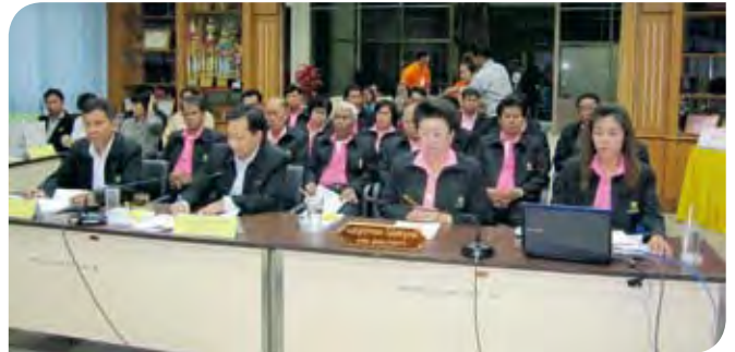
• รับฟังข้อมูล ณ องค์การบริหารส่วนตำบลบางกร่าง จังหวัดนนทบุรี

๓. คณะกรรมการโครงการฯ พิจารณาให้ความเห็นชอบแล้ว นำเสนอวุฒิสภาประกาศให้เป็นสตรีผู้นำองค์กรปกครองส่วนท้องถิ่นดีเด่น