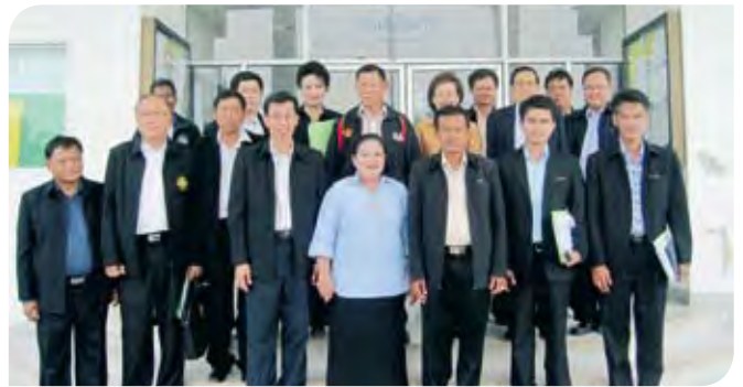
• รับฟังข้อมูล ณ องค์การบริหารส่วนตำบลบึงบา จังหวัดปทุมธานี

๒. คณะกรรมการโครงการฯ มอบหมายให้คณะอนุกรรมการคัดเลือกสตรีผู้นำองค์กรปกครองส่วนท้องถิ่นดีเด่นระดับเขตและระดับภาค ทั้ง ๔ ภาค พิจารณาคัดเลือกสตรีผู้นำองค์กรปกครองส่วนท้องถิ่นดีเด่นของแต่ละจังหวัด เพื่อเป็นตัวแทนระดับเขต ๆ ละ ๑ คน จำนวน ๑๘ เขต แล้วพิจารณาคัดเลือกให้เป็นตัวแทนระดับภาค ๆ ละ ๑ คน จำนวน ๔ คน