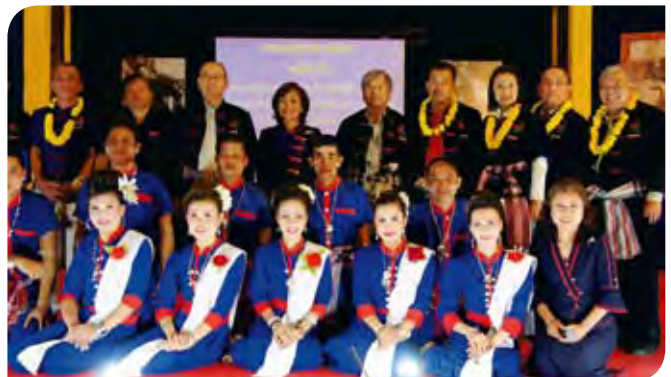
• รับฟังข้อมูล ณ เทศบาลตำบลเรณูนคร จังหวัดนครพนม

รัฐธรรมนูญแห่งราชอาณาจักรไทย พุทธศักราช ๒๕๕๐ ได้ให้สิทธิเสรีภาพแก่ประชาชนอย่างกว้างขวาง รวมทั้งเห็นถึงความสำคัญของความเสมอภาคระหว่างหญิงและชาย จึงเปิดโอกาสให้ผู้หญิงสามารถเข้ามามีบทบาทและมีส่วนร่วมทางการเมืองได้เท่าเทียมกับผู้ชาย แต่ปัจจุบันปรากฏว่าสตรีเข้ามา มีบทบาทและมีส่วนร่วมทางการเมืองน้อยมากเมื่อเทียบกับผู้ชาย ซึ่งหากจะมองหาสตรีซึ่งสามารถเข้ามามีบทบาทเป็นผู้นำประเทศ เช่น ประเทศเพื่อนบ้านของไทยอีกหลายประเทศจะพบได้ยากในปัจจุบัน อย่างไรก็ตาม แม้สตรีจะเข้ามามีบทบาทระดับประเทศจำนวนน้อย แต่ได้มีกลุ่มสตรีที่สามารถเข้ามามีบทบาทเป็นผู้นำองค์กรปกครองส่วนท้องถิ่น ทั้งในระดับองค์การบริหารส่วนจังหวัด เทศบาล องค์การบริหารส่วนตำบล อยู่พอสมควร