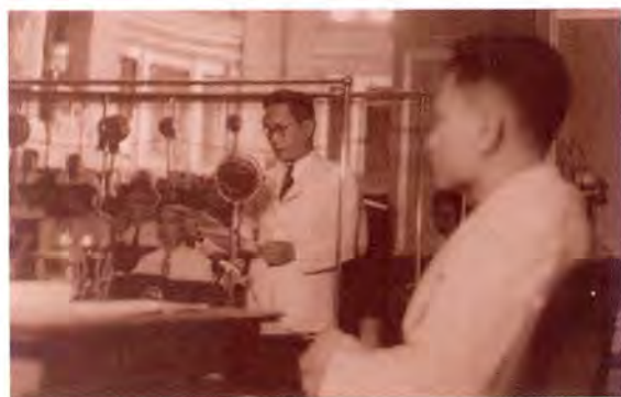
ภายในพระที่นั่งอนันตสมาคม ซึ่งใช้เป็นี่ประชุมสภา