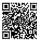
กระทู้ถามสด ด้วยวาจา