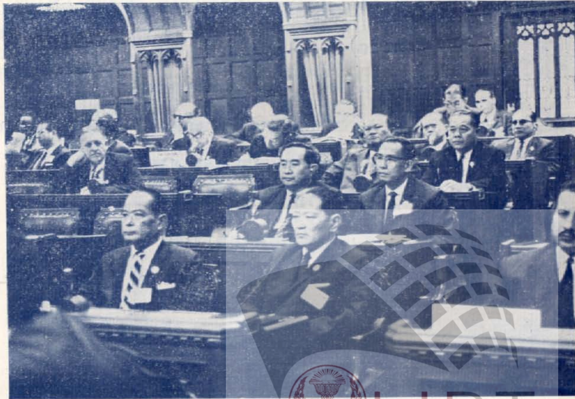
ผู้แทนหน่วยรัฐสภา ในที่ประชุมสหภ สภา ครั้งที่ ๕๔