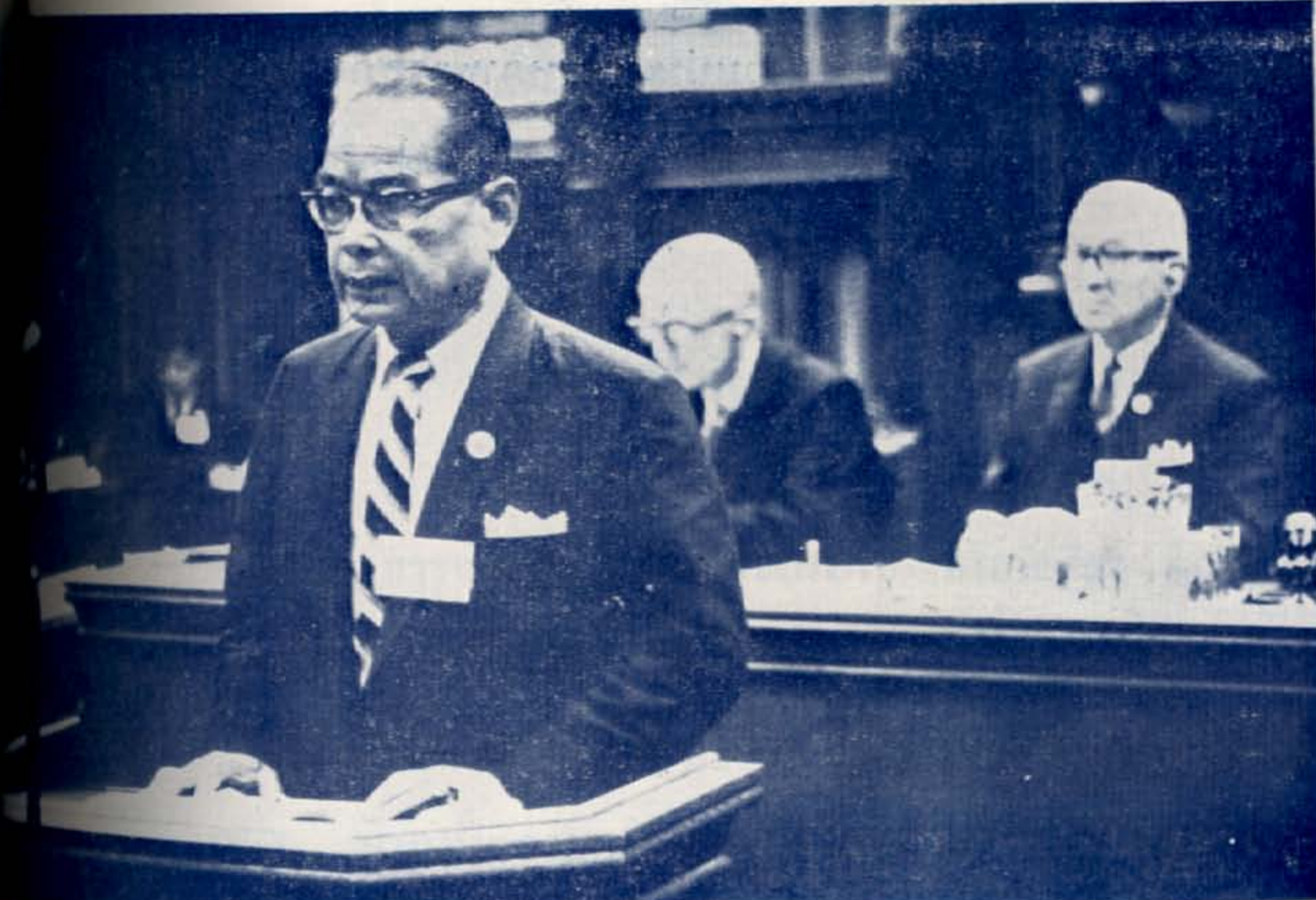
ประธานหน่วยรัฐสภา ไทยกล่าวคำปราศ ในที่ประชุมสหภ รัฐสภาครั้งที่ ๕๔ รัฐสภาแคนาดา ออกตาวา ๕ กันยายน ๒๕๐๘